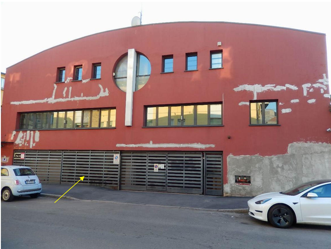
Foto 2 - Indicato dalla freccia il portone di accesso alle autorimesse.