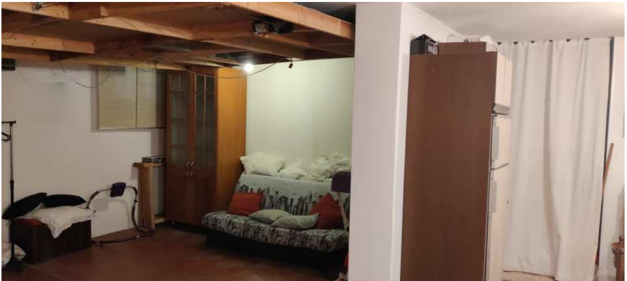
Foto n° 26 – Vista del locale al piano seminterrato adibito a taverna