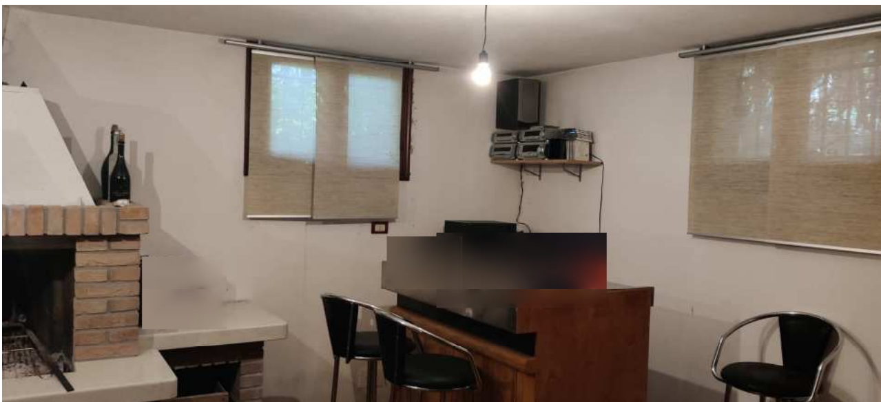
Foto n° 27 – Vista del locale al piano seminterrato adibito a taverna