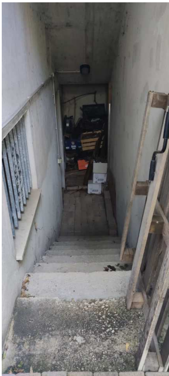
Foto n° 24 – Vista della scala esterna che conduce al piano seminterrato