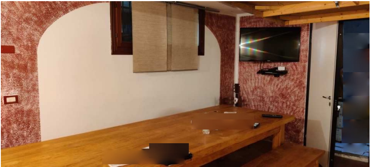
Foto n° 25 – Vista del locale al piano seminterrato adibito a taverna