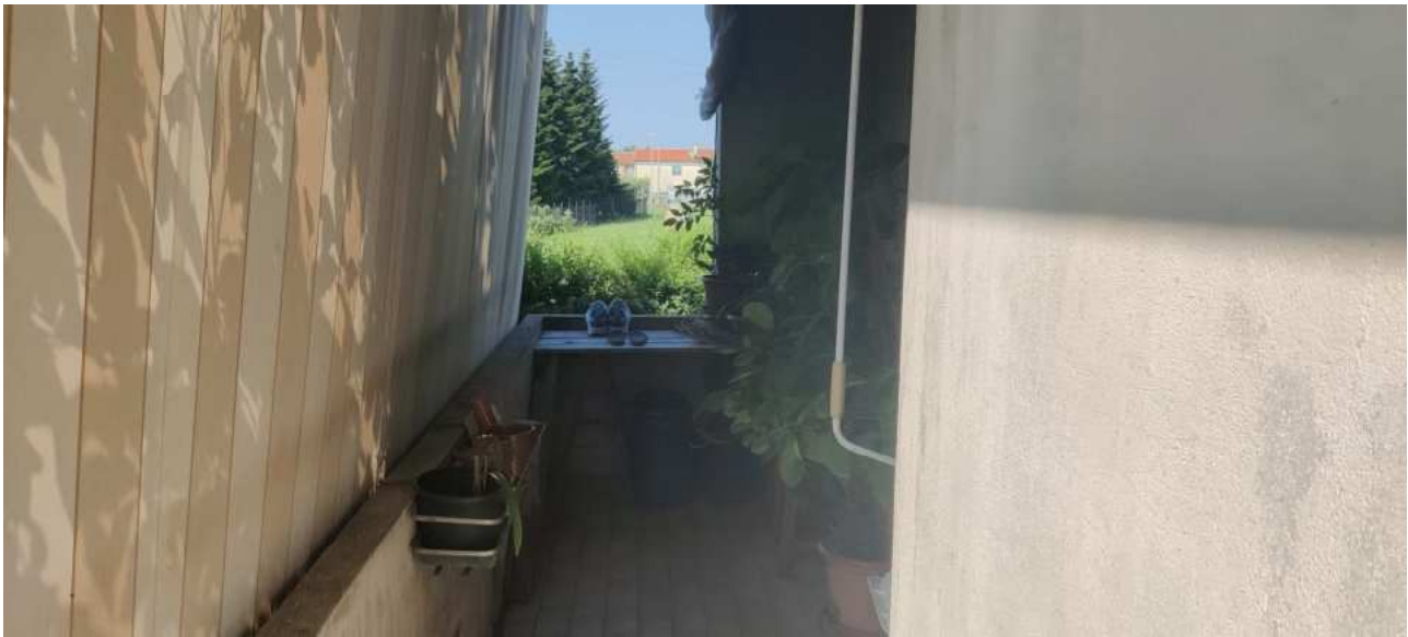
Foto n° 19 – Vista della terrazza accessibile da cucina e soggiorno