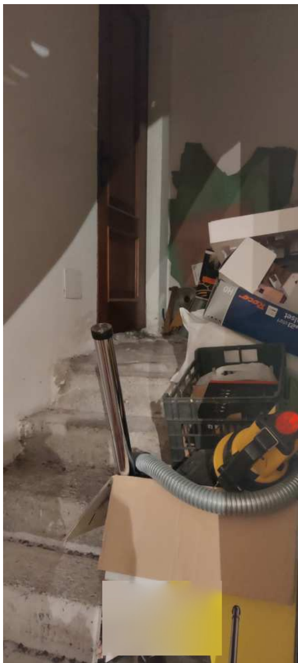
Foto n° 29 – Vista della scala interna che parte dal piano seminterrato