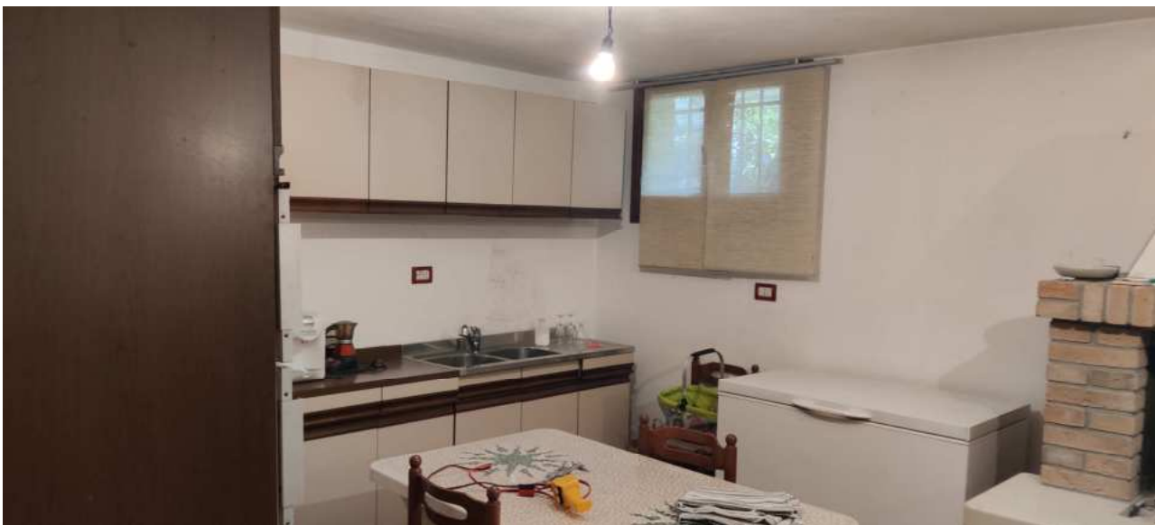
Foto n° 28 – Vista del locale al piano seminterrato adibito a taverna