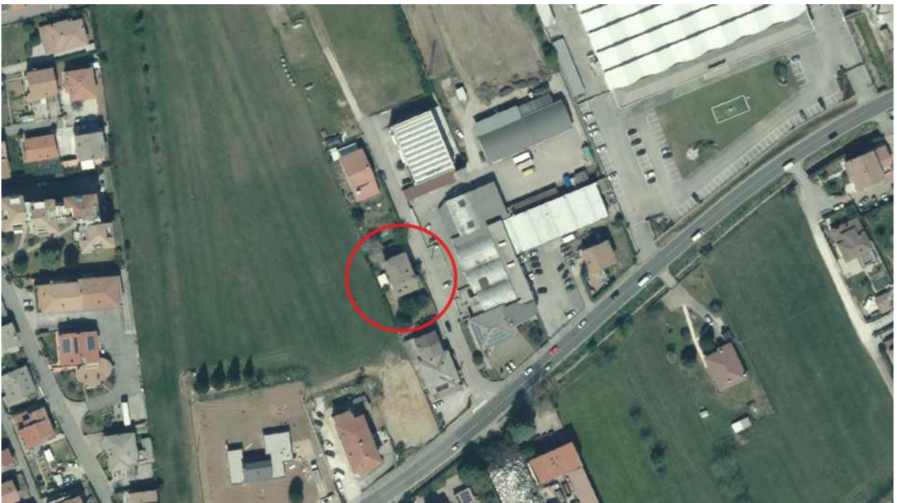
Foto 02 - Vista aerea