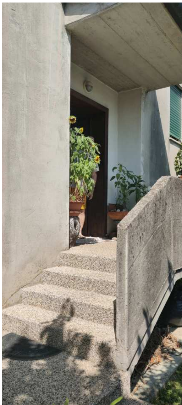
Foto n° 08 – Vista della scala esterna che porta all'ingresso dell'appartamento al piano rialzato