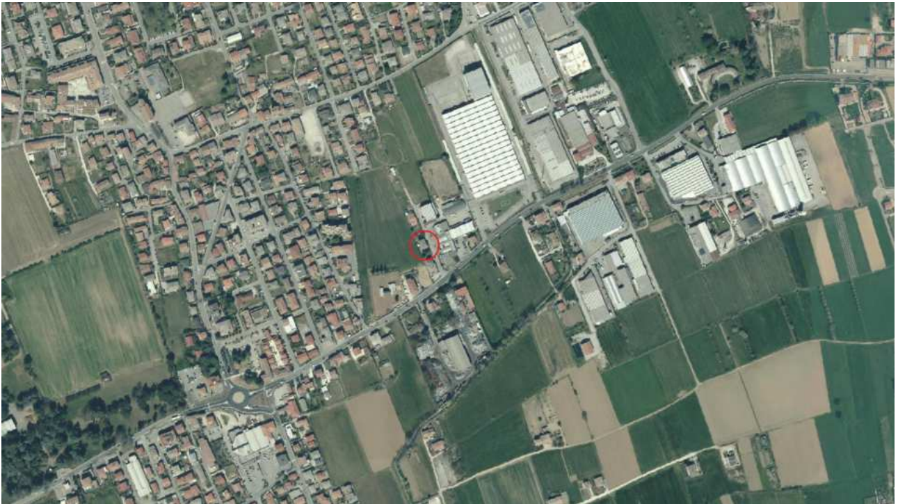
Foto 01 - Vista aerea