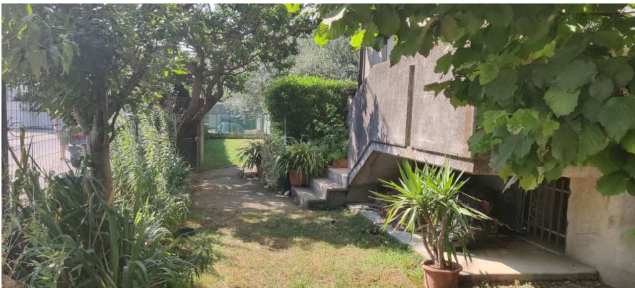
Foto n° 04 – Vista della corte comune di fronte all'accesso al piano rialzato