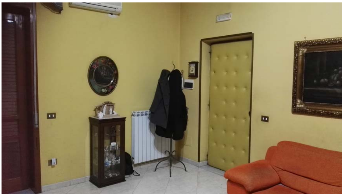
Foto 3 - vista dell'ingresso all'appartamento