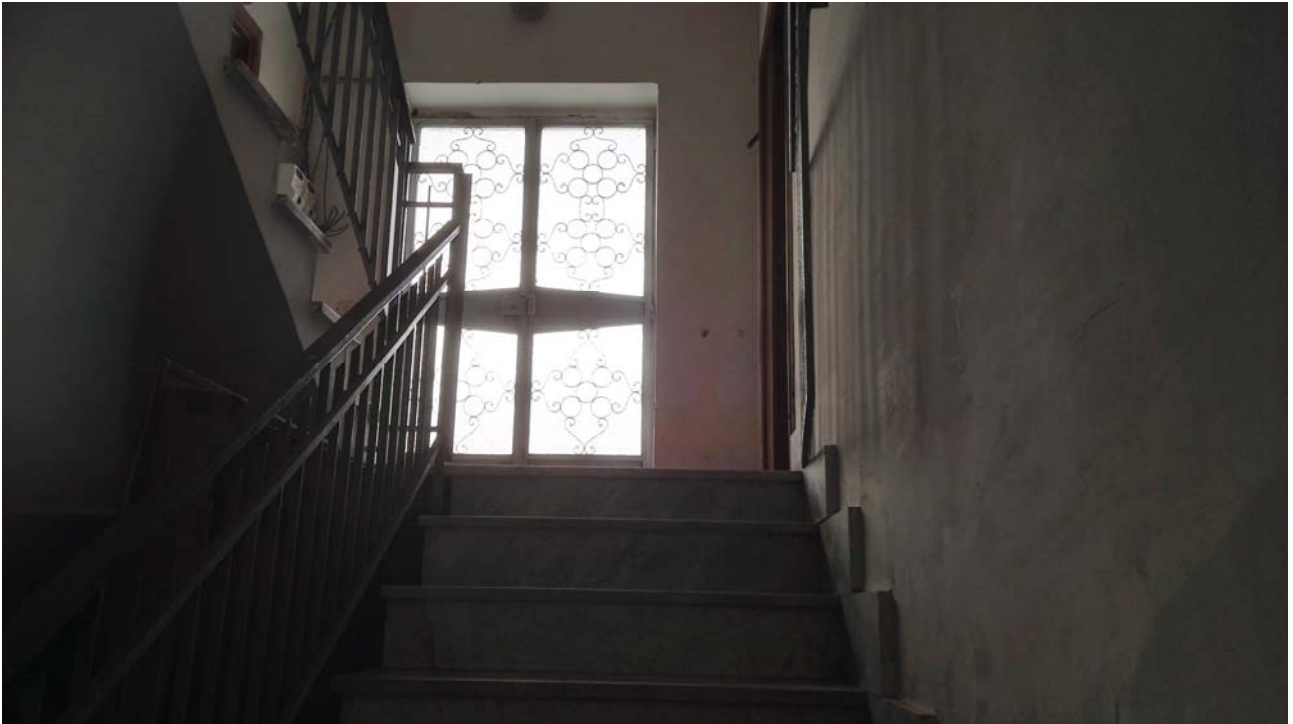
Foto 14 - vista del portoncino d'ingresso dalla strada privata