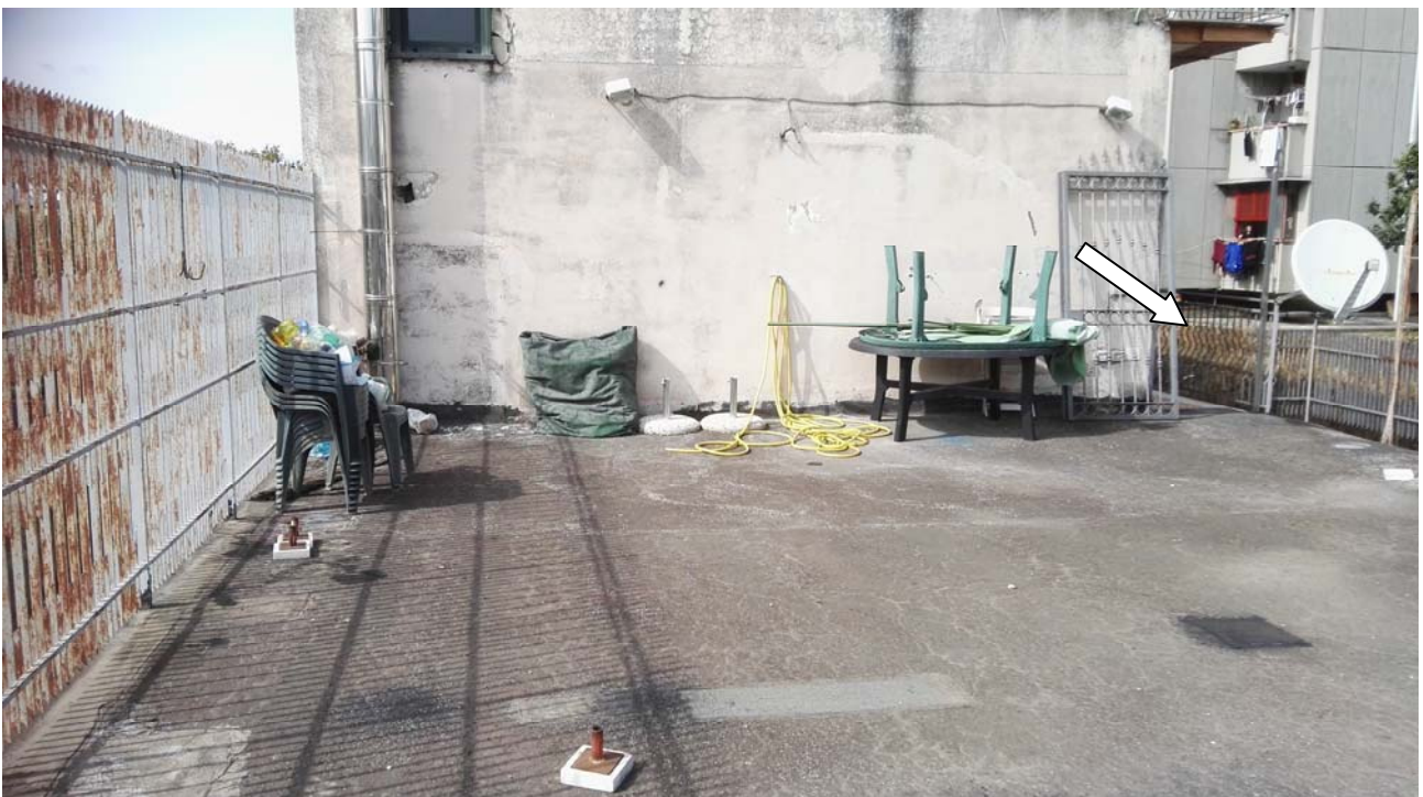
Foto 19 – vista del lastrico solare dove è visibile ingresso dal balcone dell'appartamento

Bene 3 – Lastrico solare piano primo - p.lla 696 sub 101