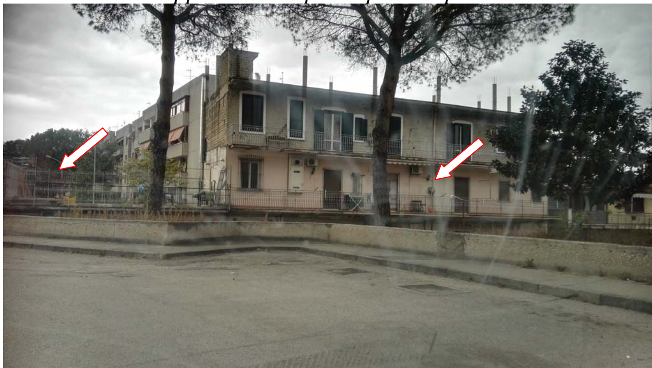
Foto 1 - vista dell'edificio dalla strada via Alcide de Gasperi dove è visibile anche il lastrico solare descritto al bene 3