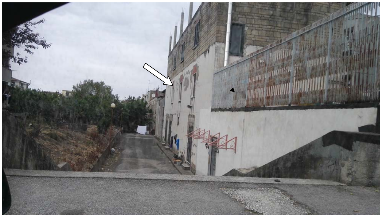
Foto 2 - vista dell'edificio lato sud dalla strada via Alcide de Gasperi