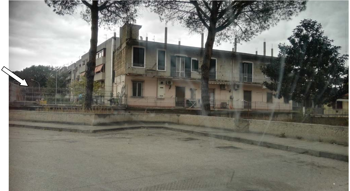
Foto 22 – vista del lastrico solare con il balcone dell'appartamento da via Alcide de Gasperi