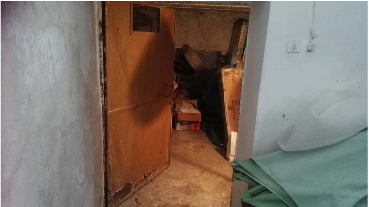
Foto 16 - vista ingresso cantinola