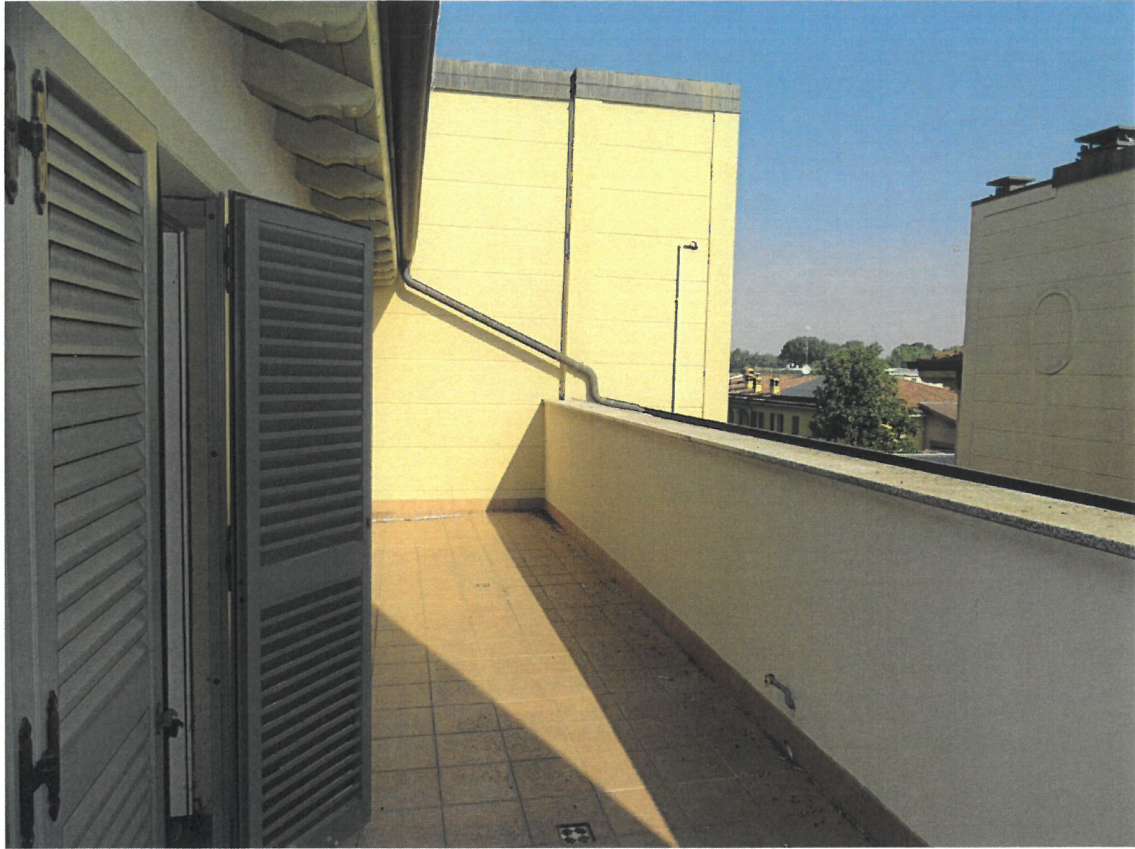
Lotto 2 sub. 834: