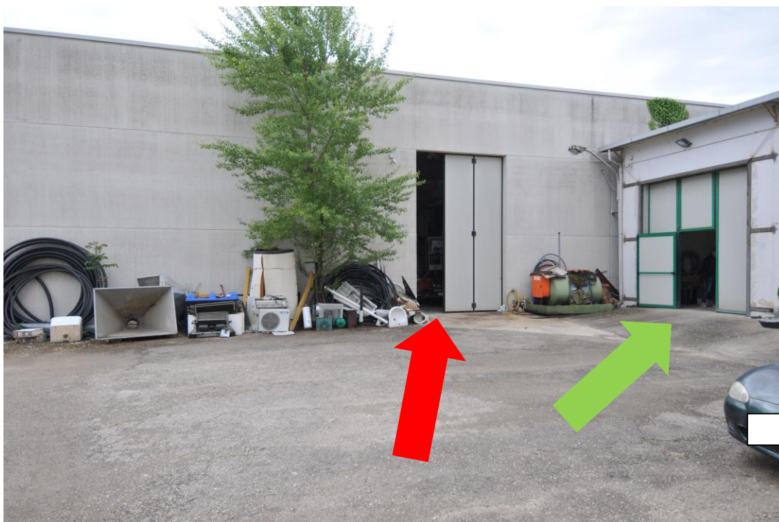
Foto 8 – LOTTO 1 e LOTTO 2 – Prospetto Nord-Ovest e porte di accesso. LOTTO 1 freccia rossa; LOTTO 2 freccia verde