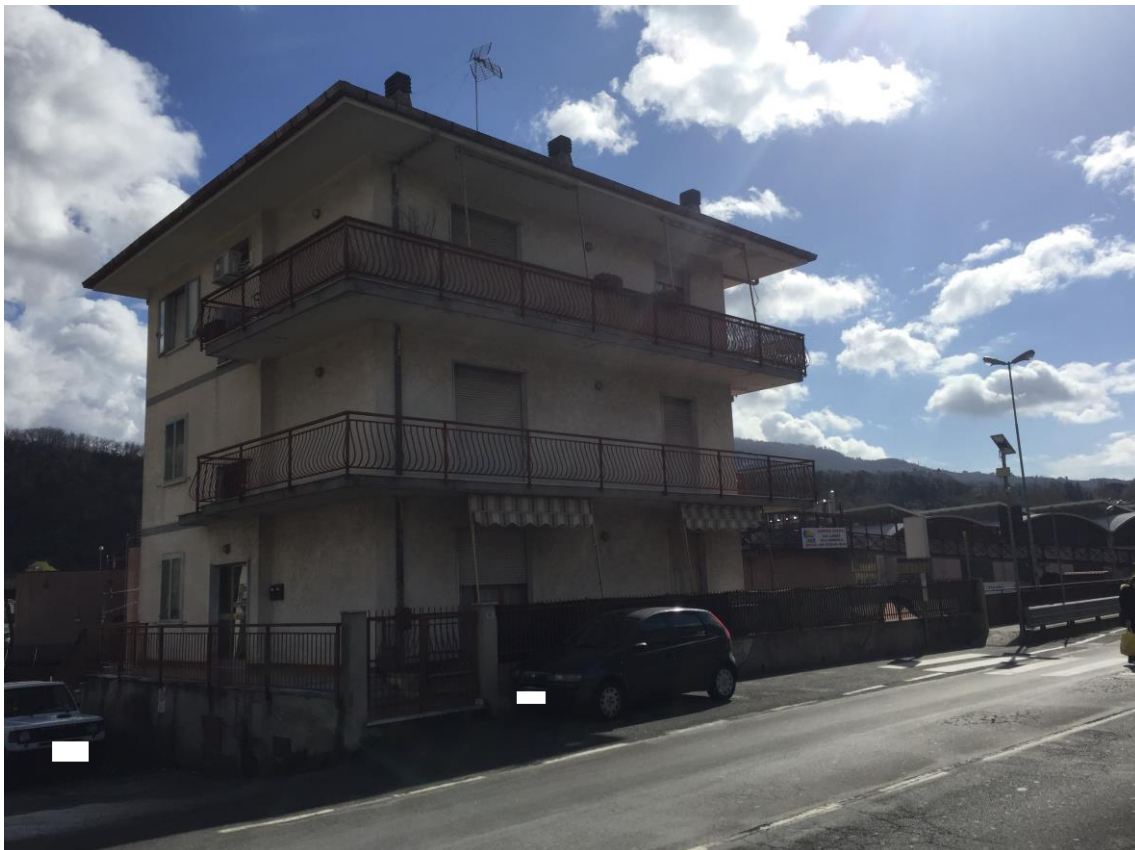
Foto 2: VEDUTA GENERALE DELL'IMMOBILE OGGETTO DI STIMA – PROSPETTO OVEST