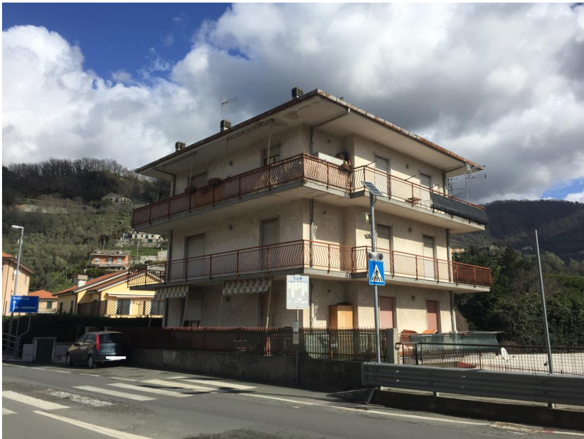
Foto 1: VEDUTA GENERALE DELL'IMMOBILE OGGETTO DI STIMA – PROSPETTO SUD-OVEST