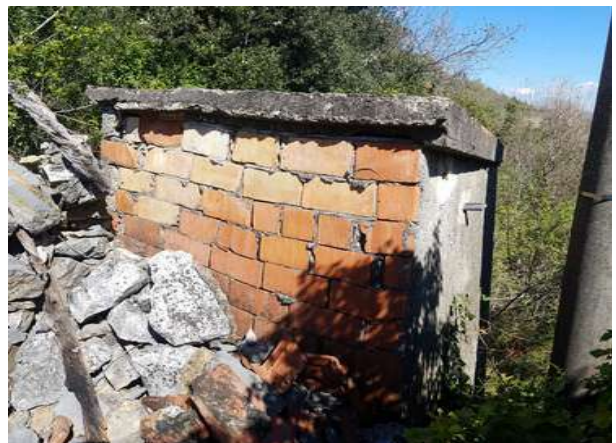
manufatto costruito senza titolo in aderenza al mappale 119 e non accatastato