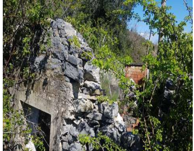
manufatto collabente di cui al mappale 119