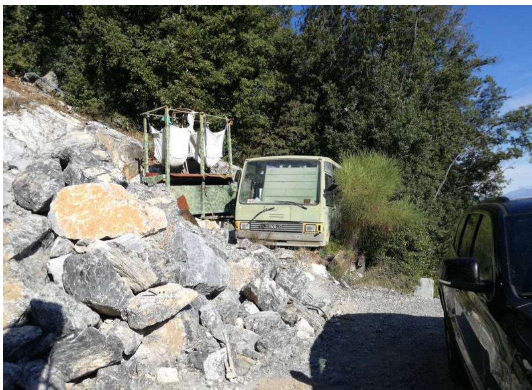
presenza di una carcassa di minibus