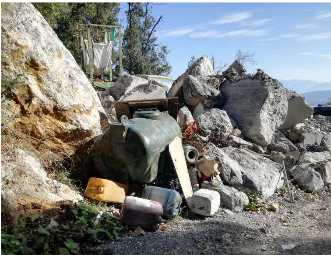
zona antistante l'accesso alla cava ( presenza di rifiuti ingombanti)