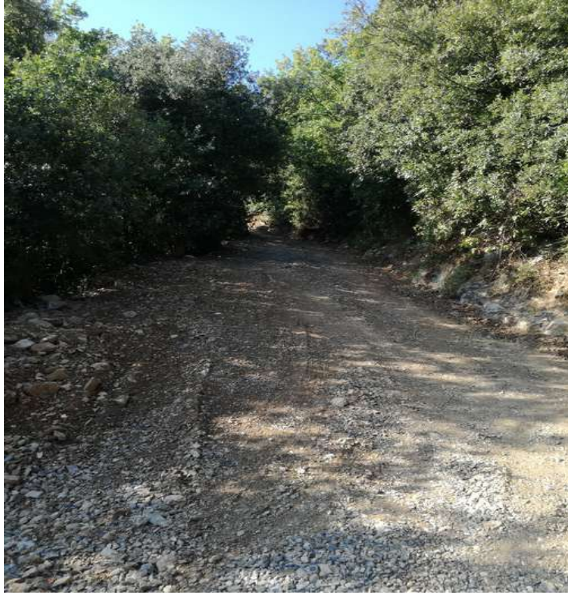
Strada di accesso alla Cava su terreni di proprietà