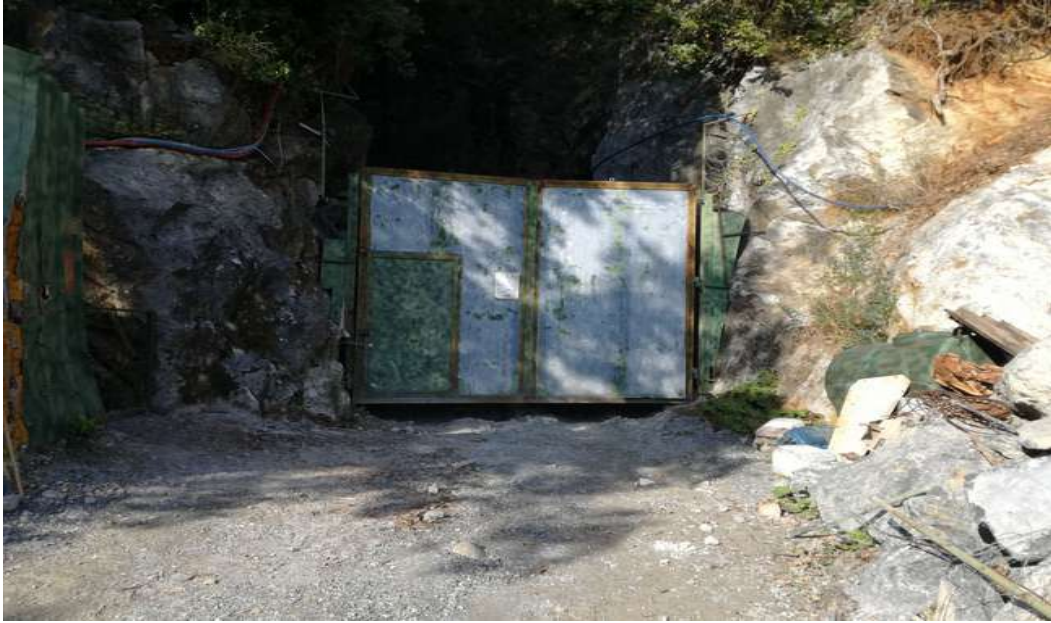
cancello d'ingresso alla cava su mappale di proprietà ( part. 333)