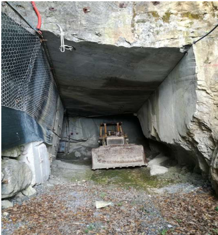
ingresso alla cava sotterranea su mappale di proprietà ( part. 333)