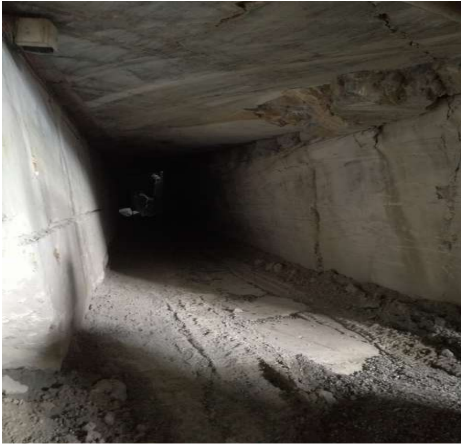
zona della cava in area di proprietà