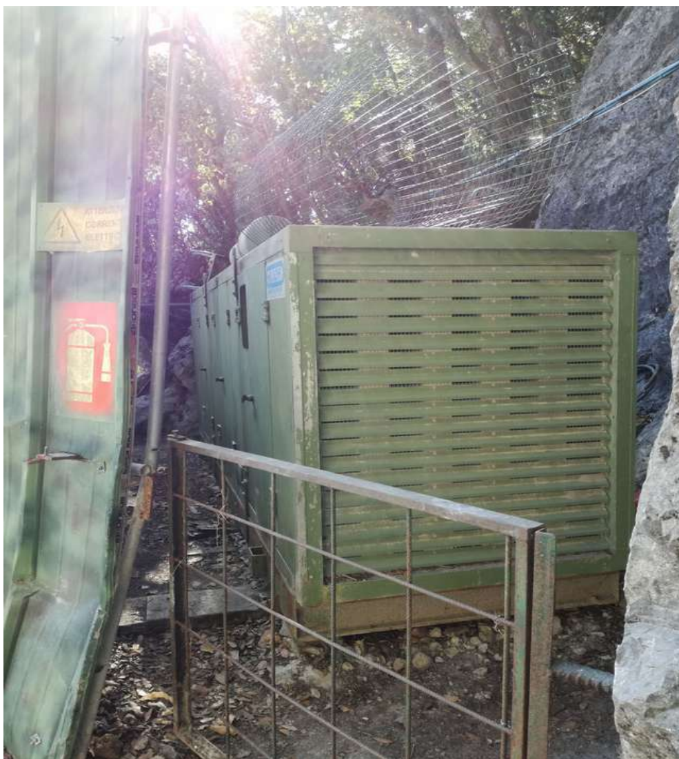
zona antistante l'ingresso – gruppo elettrogeno - ( non oggetto di stima )