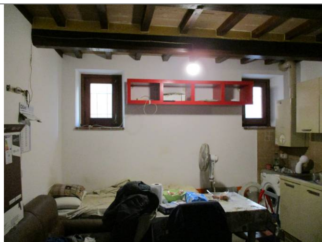
Foto n. 7 - Monocale - P.T.