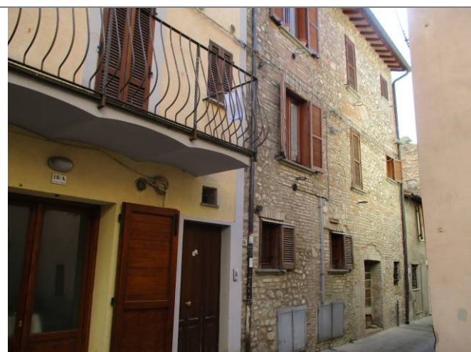
Foto n. 3 - Vista edificio - Via Lago Persio