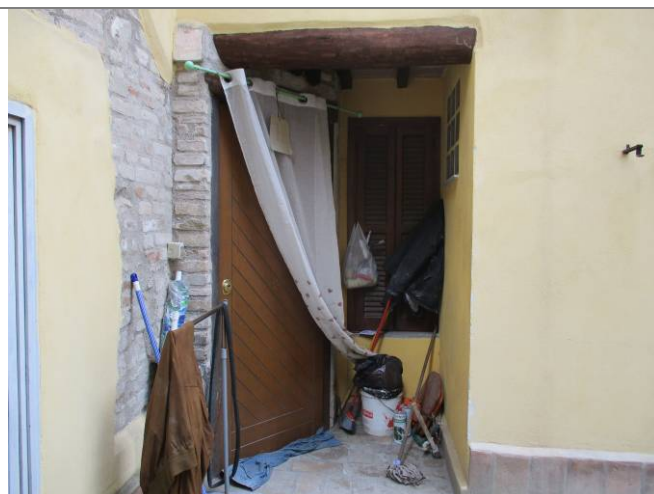
Foto n. 2 - Ingresso monolocale - civico 7/B