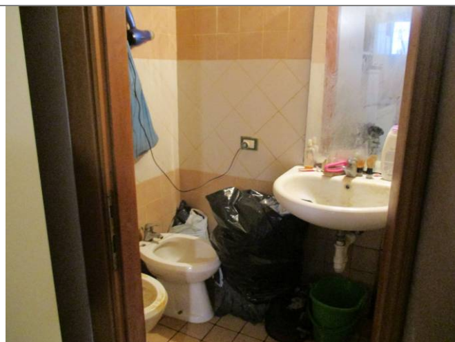
Foto n. 9 - Bagno - P.T.