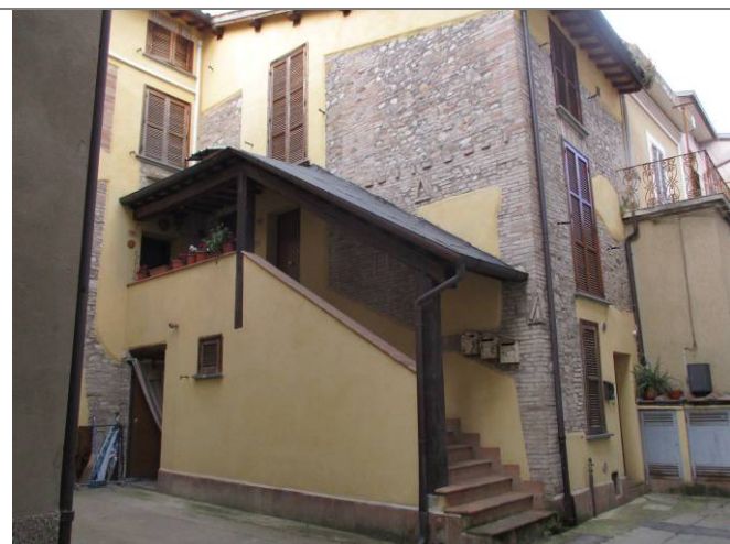
Foto n. 1 - Vista edificio - Via Clitunno