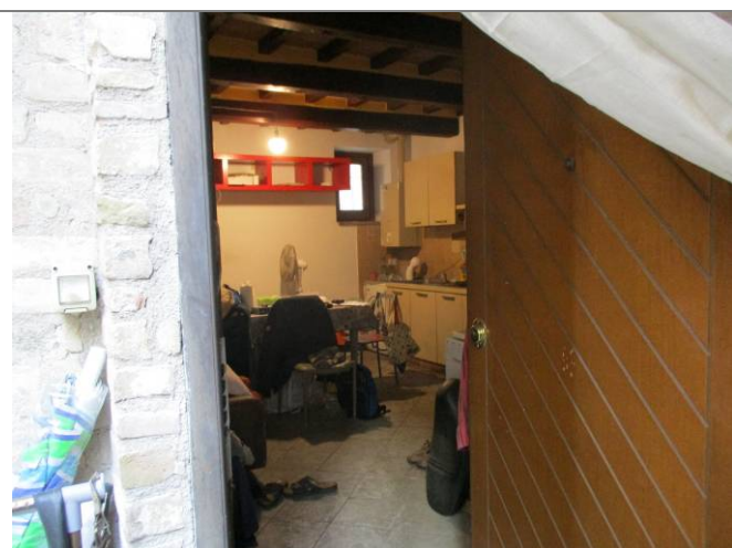
Foto n. 5 - Vista ingresso monolocale - P.T.