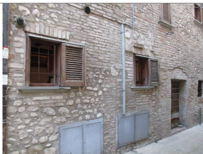
Foto n. 4 - Vista edificio - Via Lago Persio