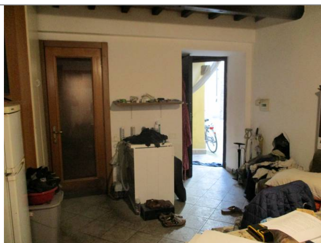
Foto n. 6 - Monolocale - P.T.