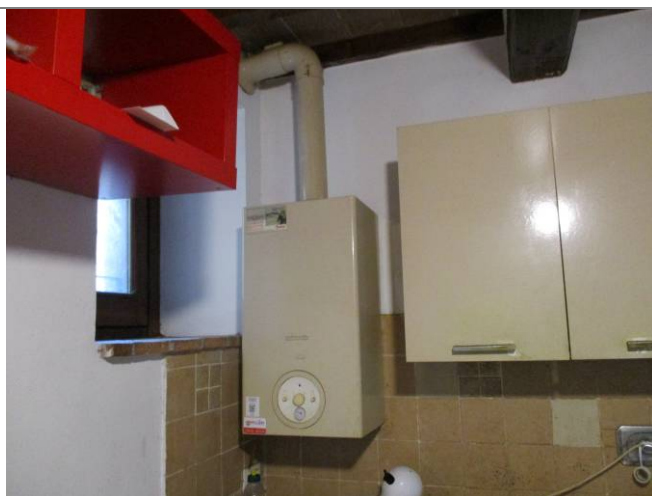
Foto n. 8 - Particolare caldaia - P.T.