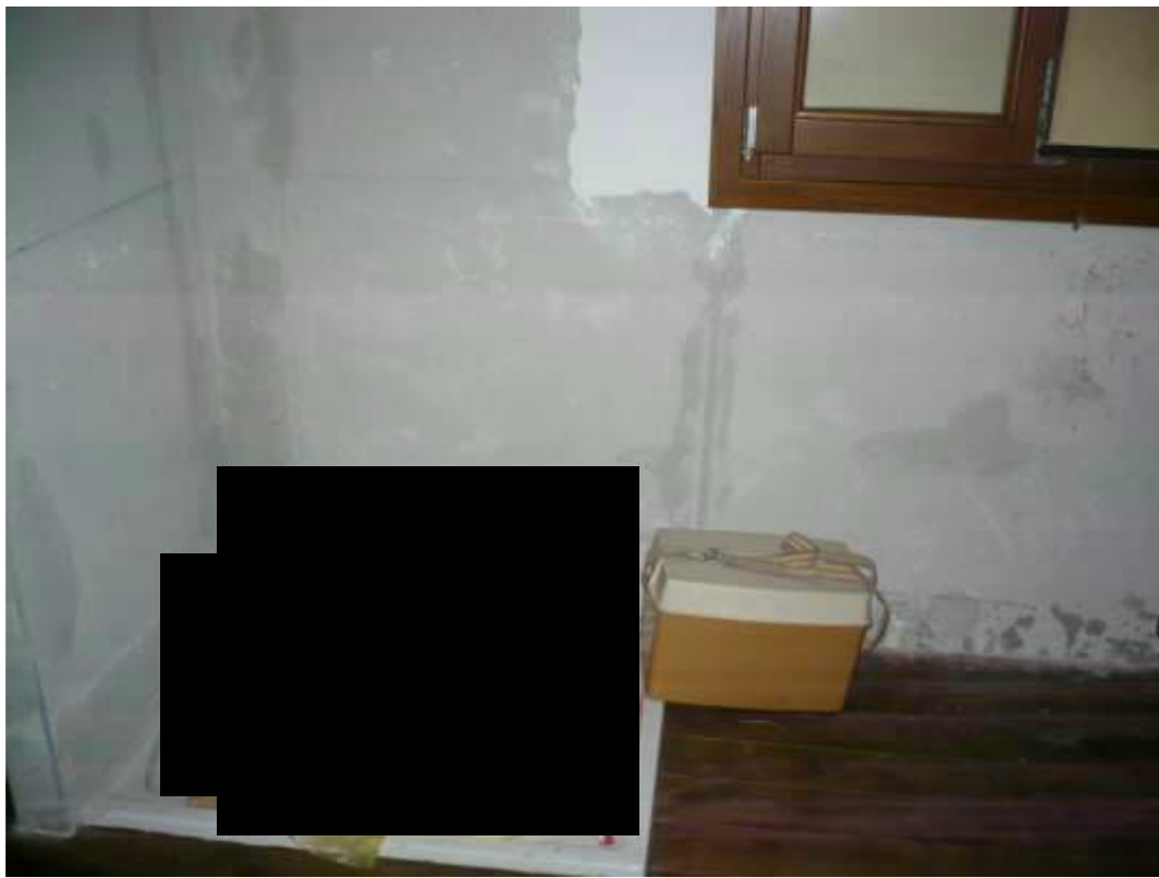
Bagno – piano primo