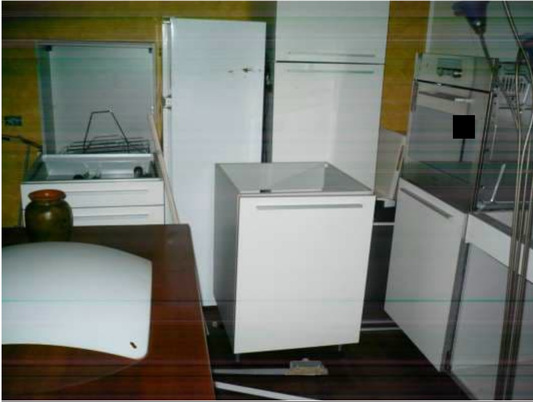
Letto – piano primo