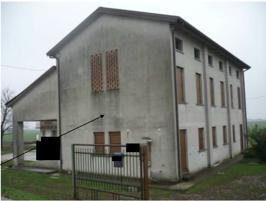
Prospetto Est /Nord