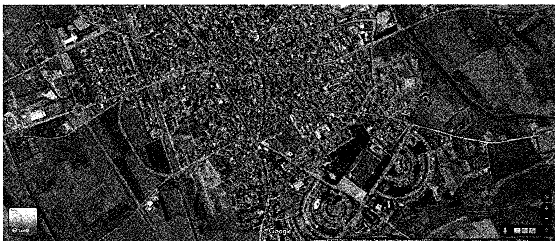
FIGURA 1- INDIVIDUAZIONE DEL BENE NEL CENTRO URBANO DI SERRAMANNA

L'immobile si raggiunge facilmente dalla via Cagliari (strada S.P. 196dir), e svoltando a destra, si percorre la via Grandi sino ad arrivare all'incrocio con Via XXV Aprile e proseguendo dritti si arriva in Via Oberdan.