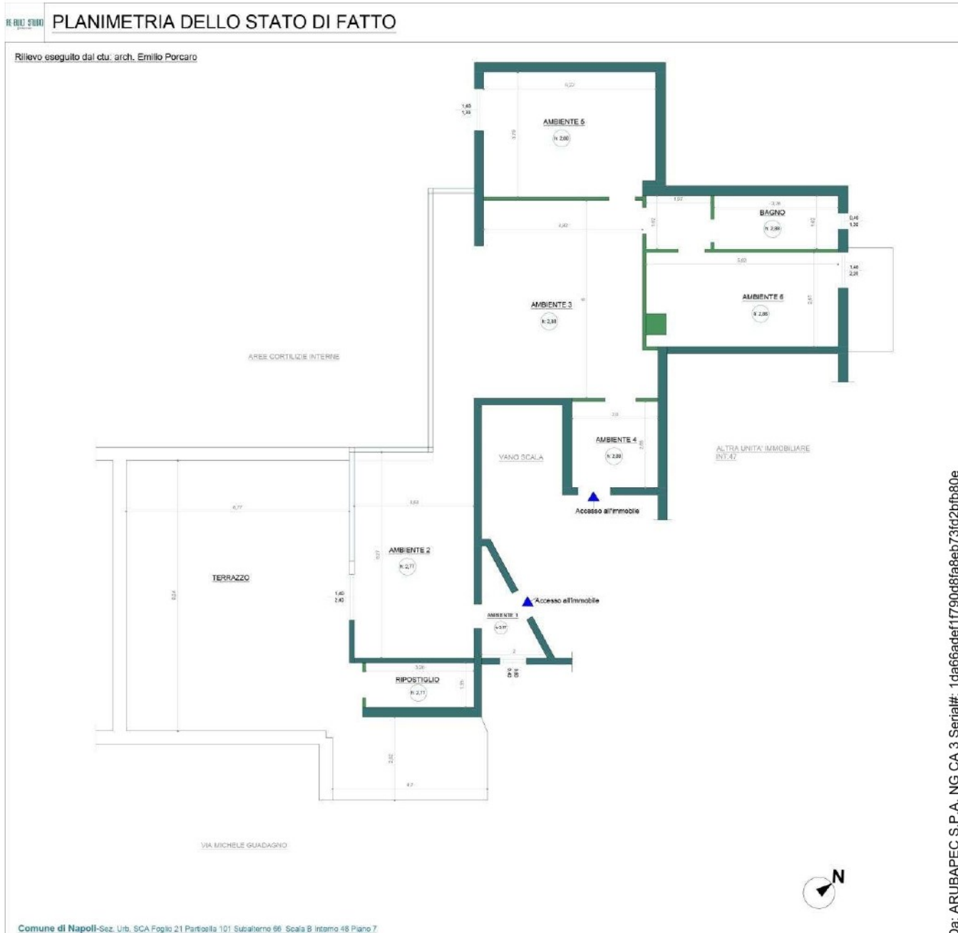
Planimetria dello stato reale dei luoghi dello scrivente (all.25)

Ad integrare il rilievo fotografico va a riportarsi, di seguito, il rilievo eseguito dallo scrivente per la verifica della reale consistenza dell'immobile: