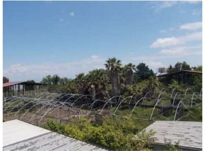
viste della porzione di terreno ad est del piccolo fabbricato abusivo