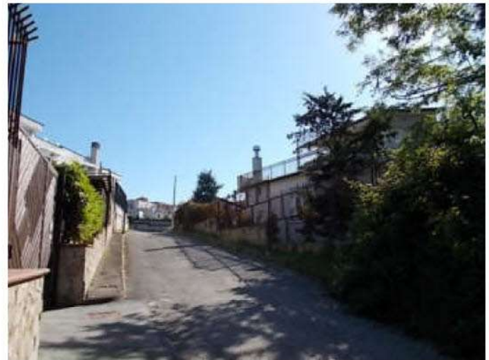
strada privata che si diparte da Via del Mare civico 53, e conduce al cancello d'ingresso all'area in possesso dei comproprietari