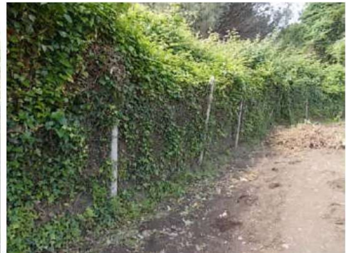
viste dalla particella limitrofa n. 95 del confine nord nella parte infestata dai rovi