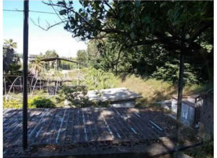
viste del piccolo fabbricato abusivo e della porzione di terreno ad est dello stesso