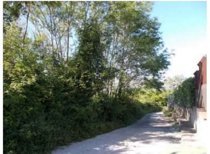
altre viste della strada privata, si noti la porzione di terreno infestata dai rovi