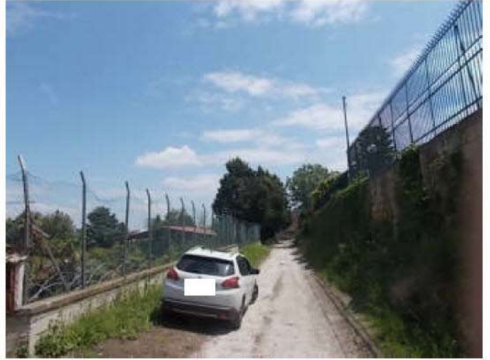
altre viste della strada privata e del confine sud del terreno oggetto di divisione