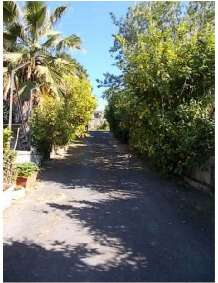
viste della rampa d'ingresso dove viene esercitata la servitù di passaggio a favore della particella n. 95 estranea alla divisione