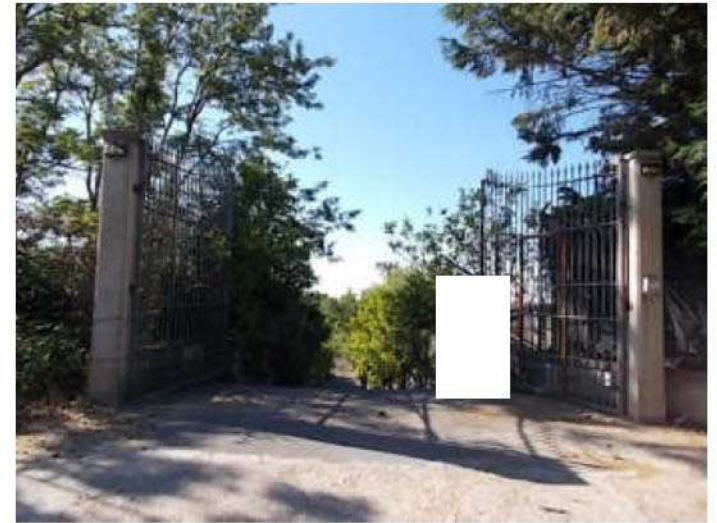
viste della strada privata nella parte dove è stato realizzato il cancello d'ingresso alla superficie in possesso dei comproprietari