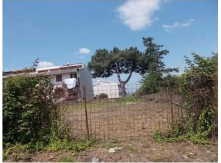
altre viste della strada privata, si noti la pendenza della stessa, a destra e la porzione di terreno liberata recentemente dai rovi