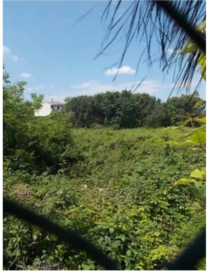
viste dalla rampa di accesso della porzione infestata dai rovi