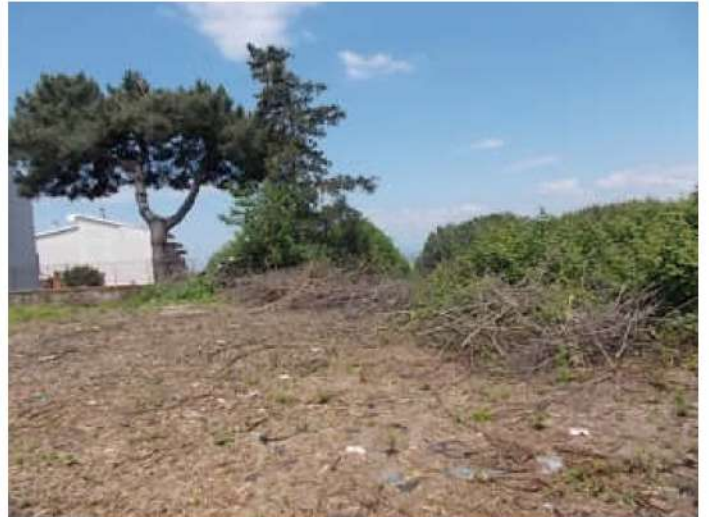
viste della porzione del terreno oggetto di divisione recentemente liberata dai rovi