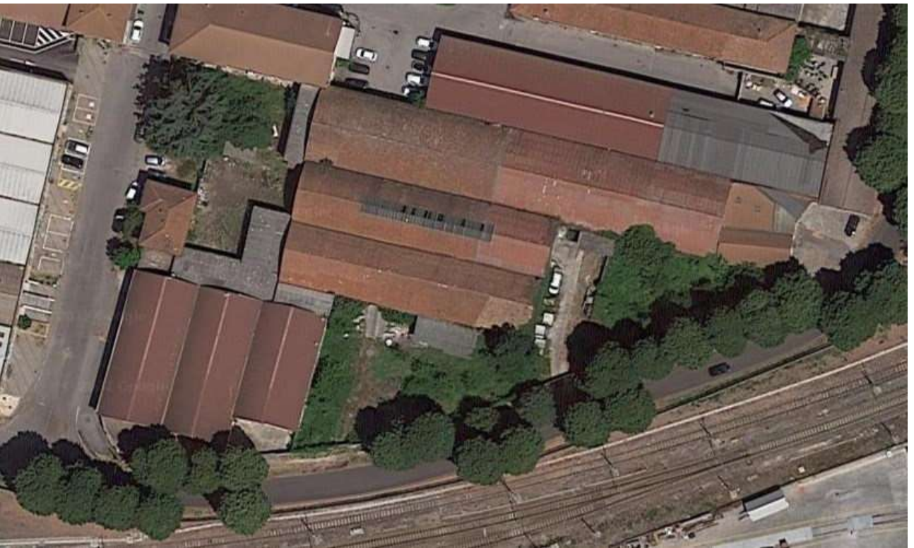
Ortofoto del complesso edilizio