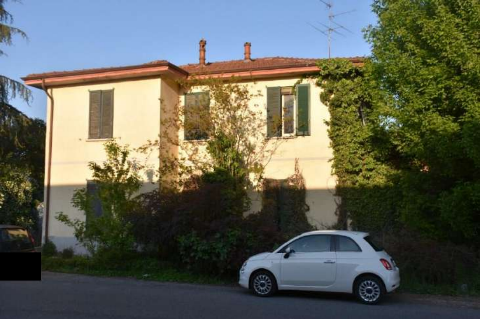
Palazzina uffici lato ovest