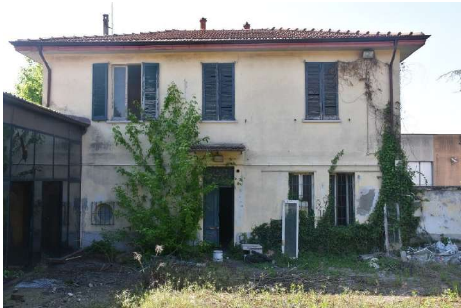
Palazzina uffici lato est