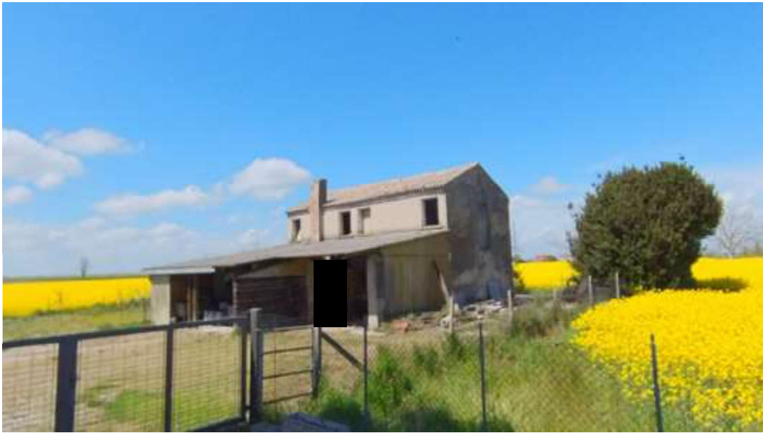
Figura 20 fabbricato insistente sul mappa 47, foglio 5