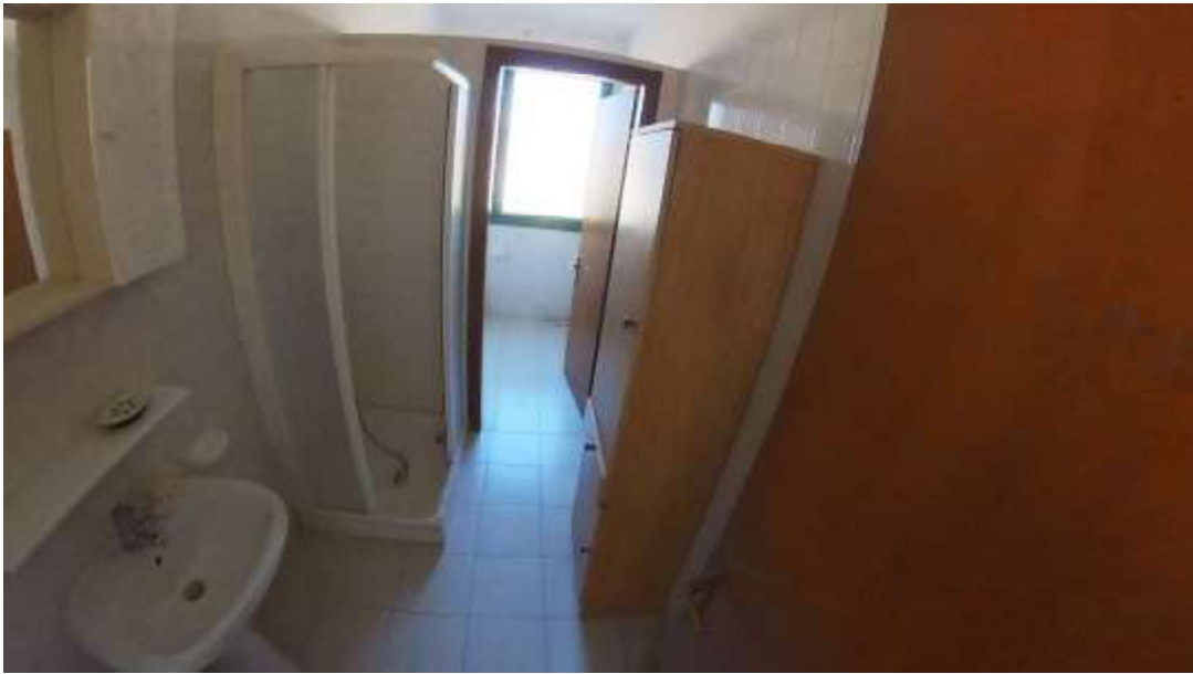
Figura 6 Primo piano mn 119