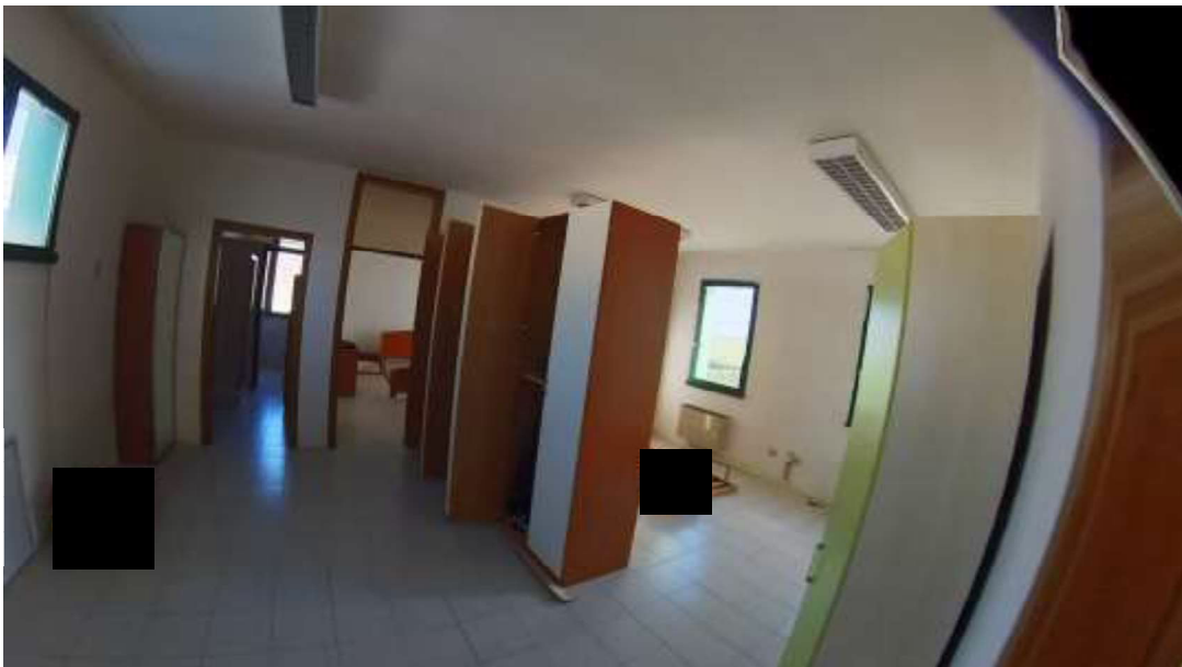
Figura 11 Primo piano mn 119