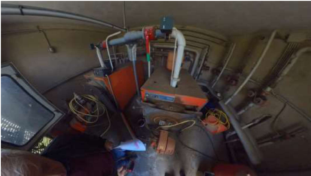
Figura 18 Centrale termica