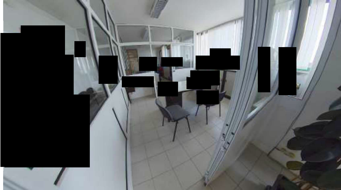
Figura 2 Uffici mn 119 fg 5