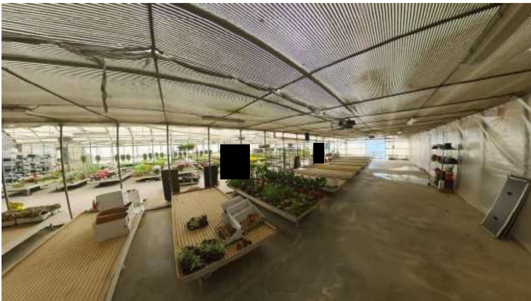
Figura 16 Serre