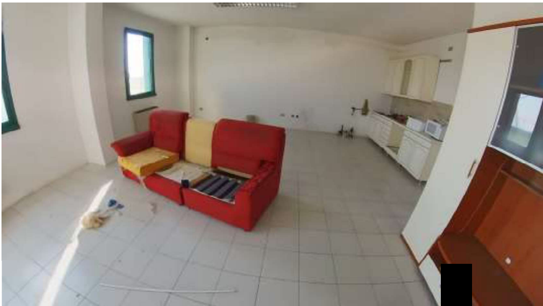
Figura 9 Primo piano mn 119