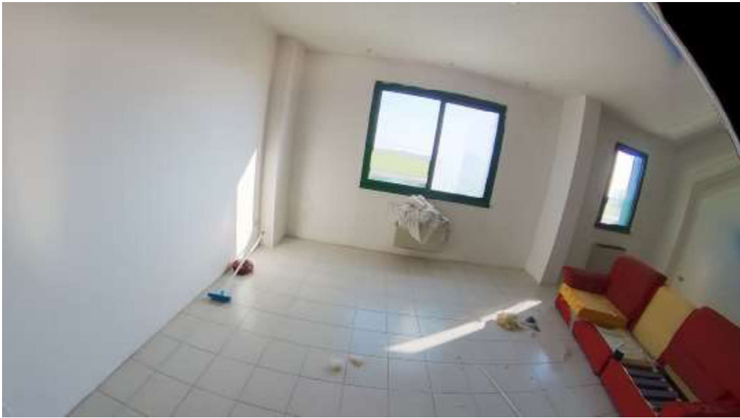
Figura 10 Primo piano mn 119