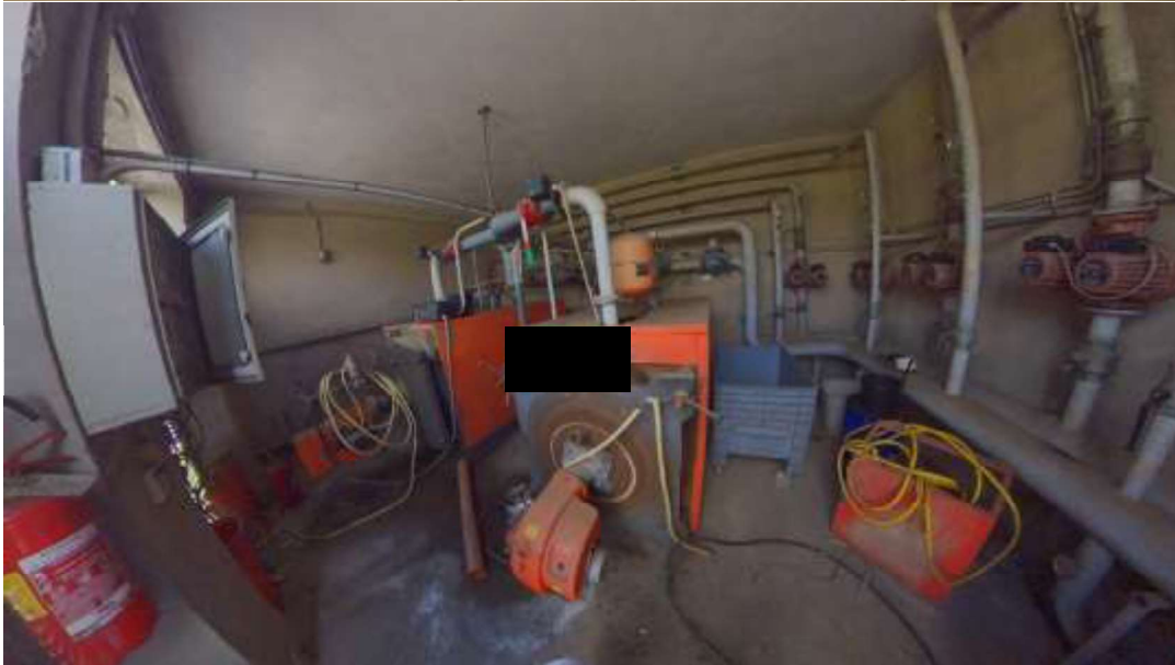
Figura 17 Centrale termica