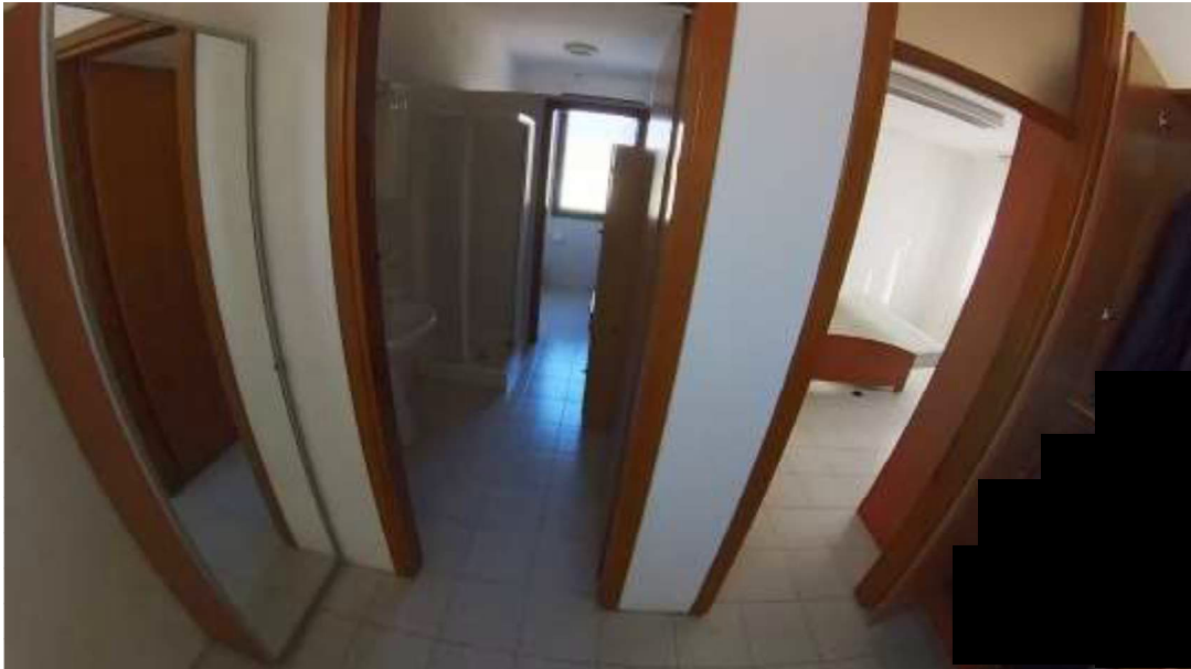
Figura 5 Primo piano mn 119