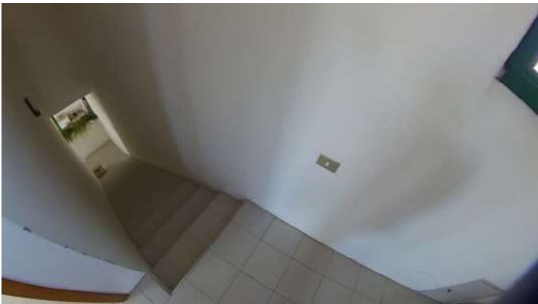
Figura 3 Primo piano mn 119