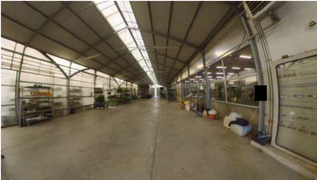
Figura 12 capannone avanserra