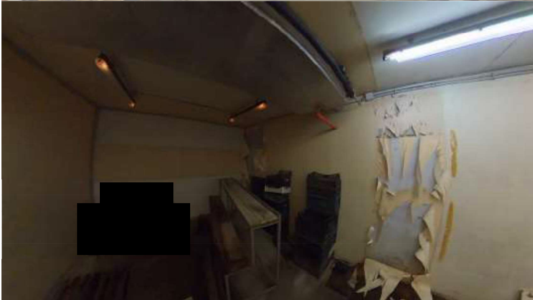
Figura 15 cella frigo Nord-Ovest