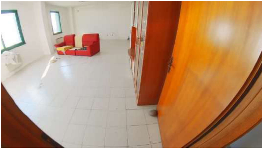
Figura 8 Primo piano mn 119