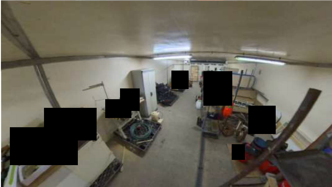
Figura 14 cella frigo interna al capannone