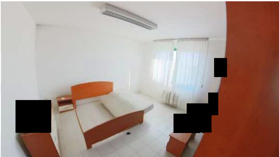
Figura 7 Primo piano mn 119