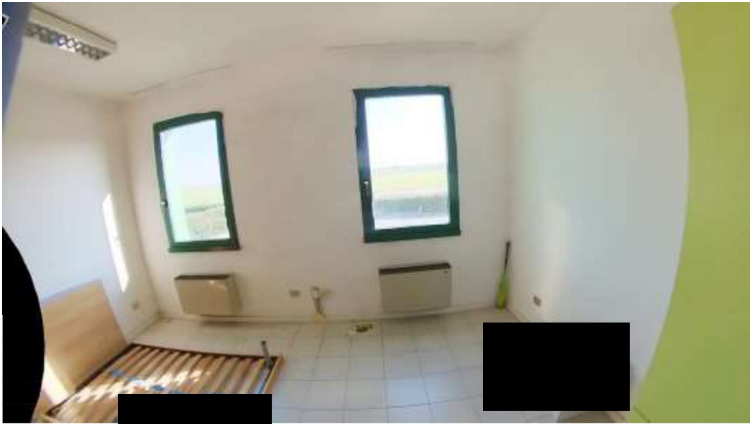
Figura 4 Primo piano mn 119