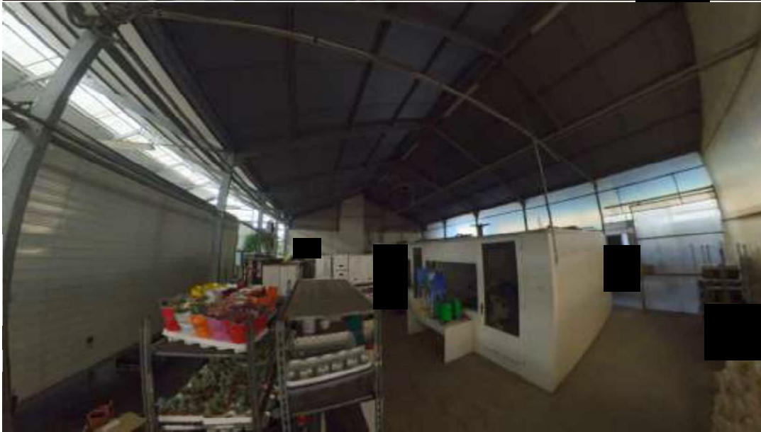
Figura 13 Capannone deposito