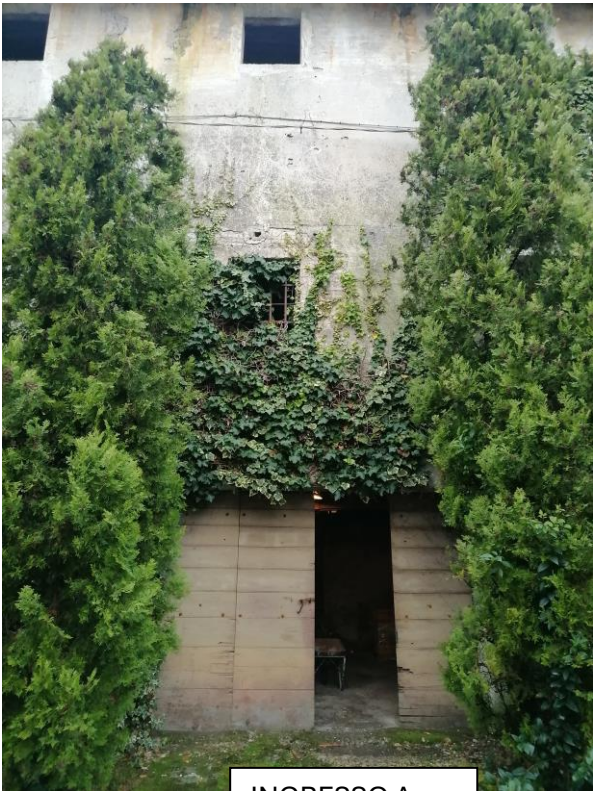
INGRESSO A PIANO TERRA