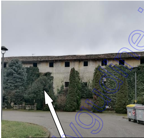
INGRESSO A 1 E 2 P TRAMITE PORTA POSTA A CIRCA 3 m. DAL SUOLO ACCESSIBILE CON SCALA AMOVIBILE