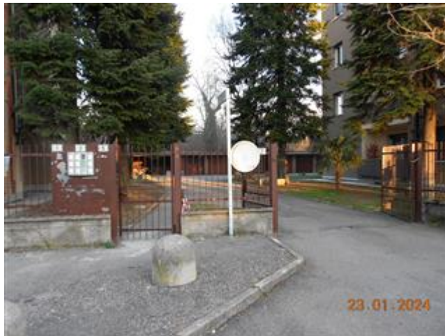
INGRESSO AL COMPLESSO