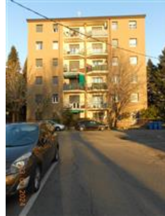
FRONTE SU STRADA