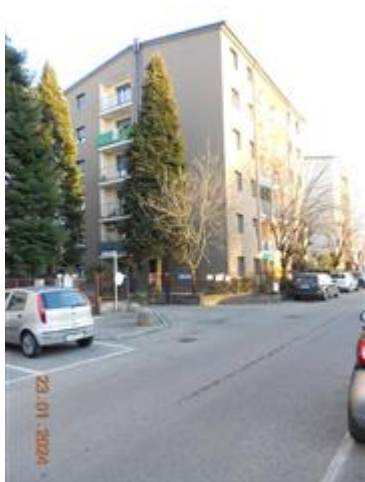
VIA DI ACCESSO