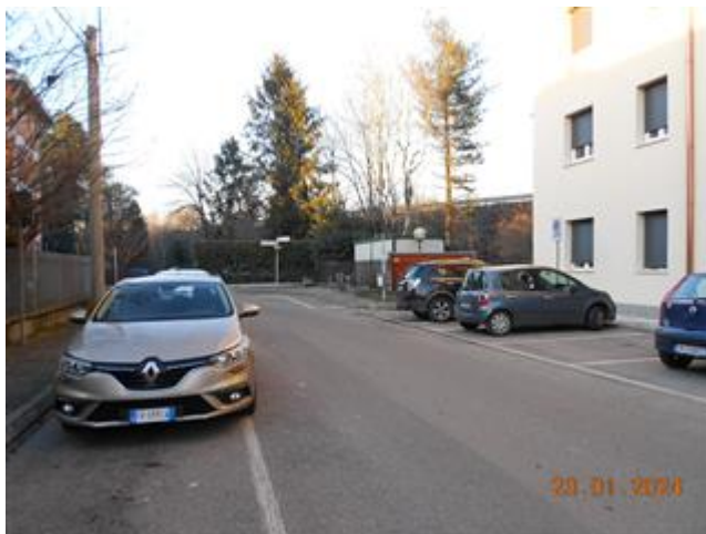
VIA DI ACCESSO