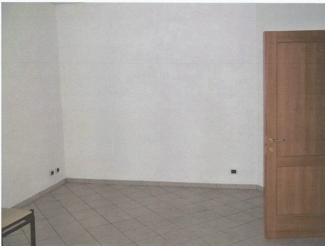
VISTA CUCINA UNITA' IMMOBILIARE LATO SUD