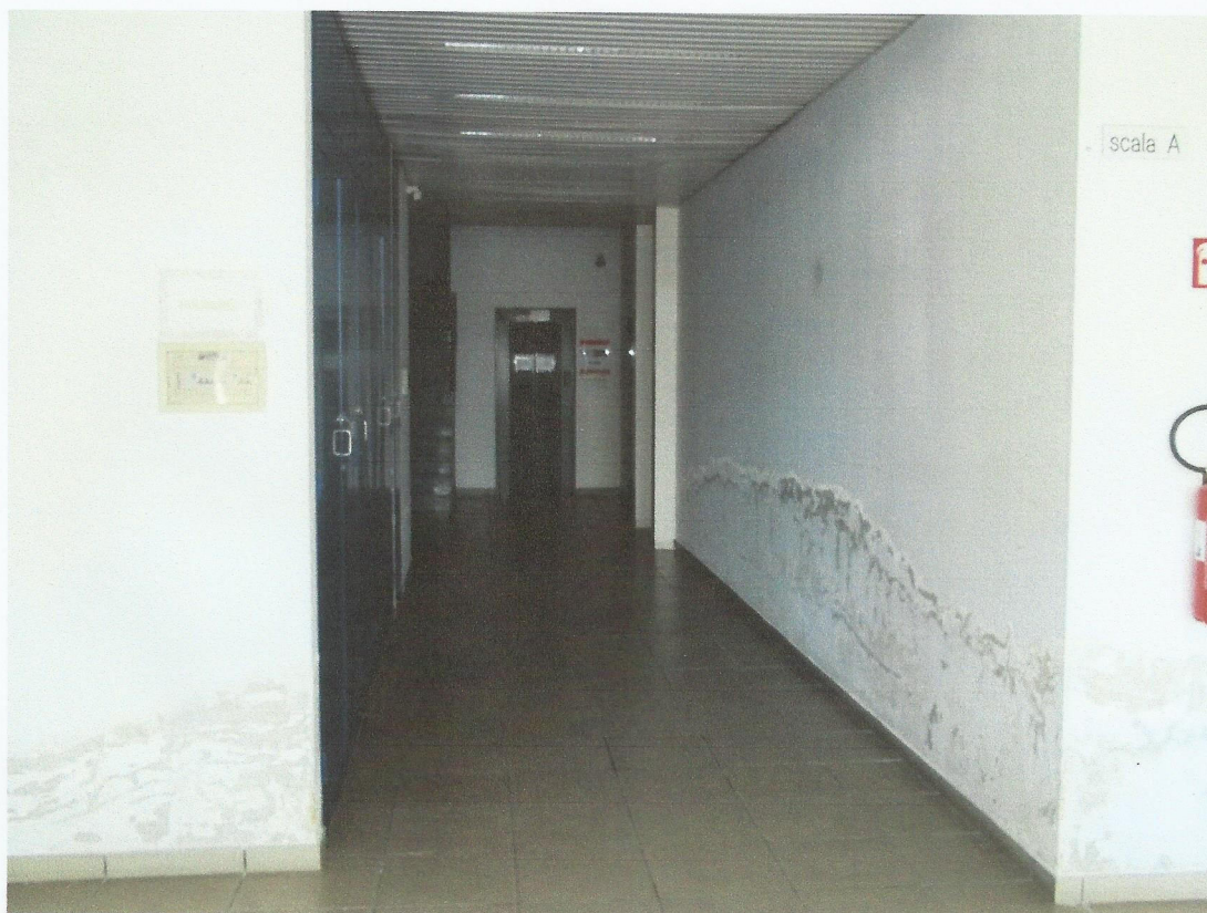
VISTA ASCENSORE CONDOMINIALE "CORPO D"