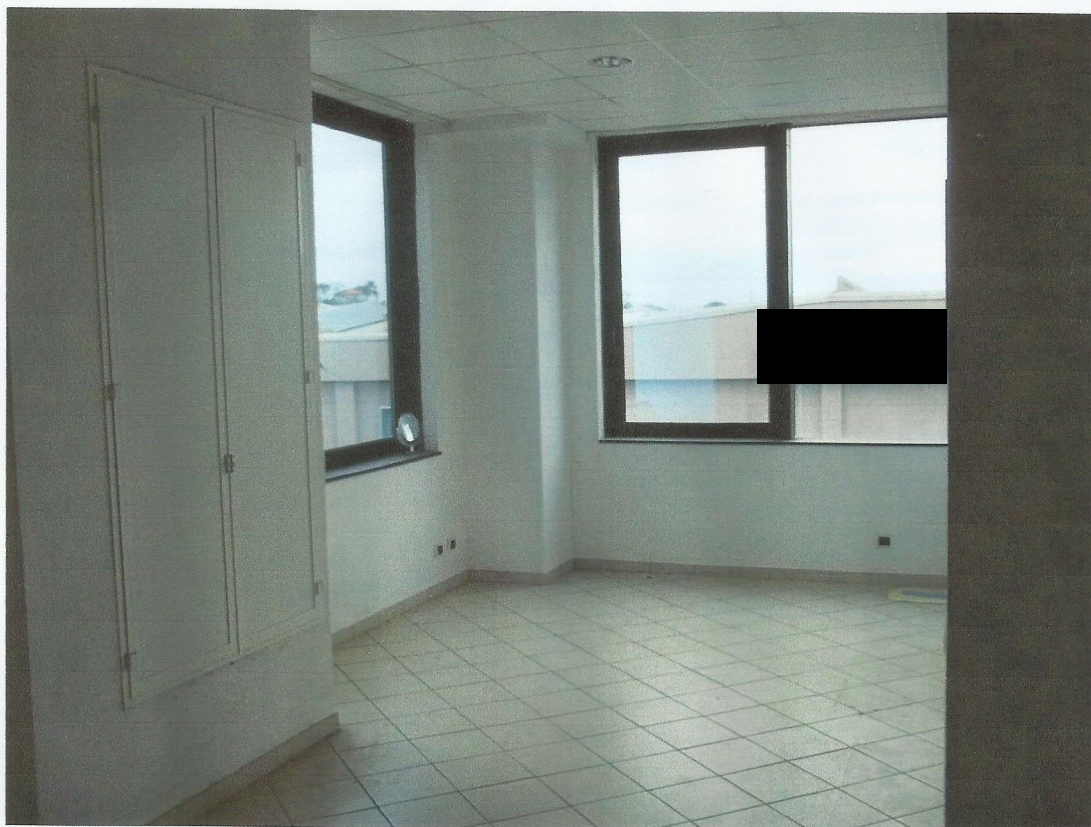
VISTA CAMERA DA LETTO 1 UNITA' IMMOBILIARE LATO NORD