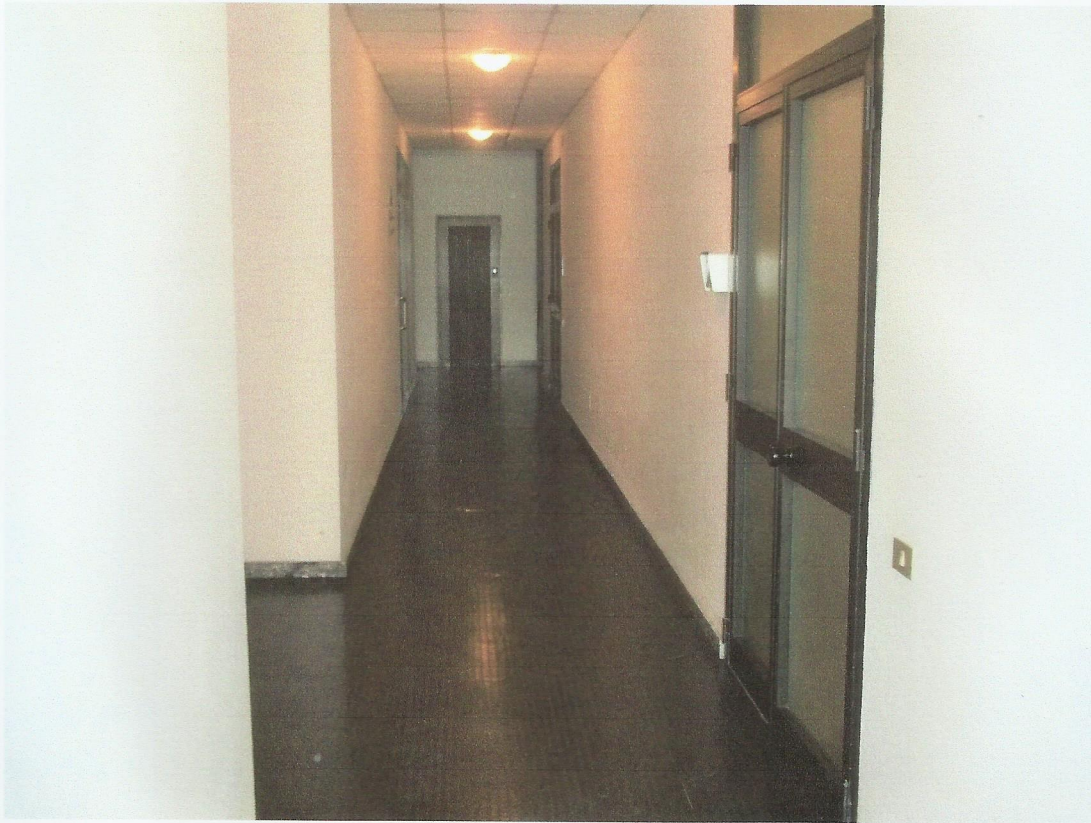
VISTA INGRESSO UNITA' IMMOBILIARE LATO NORD