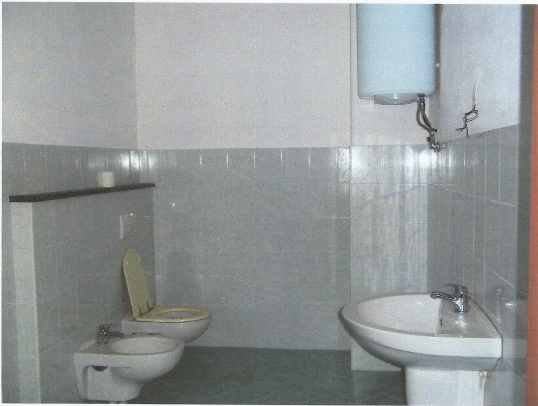
VISTA BAGNO 2 UNITA' IMMOBILIARE LATO NORD