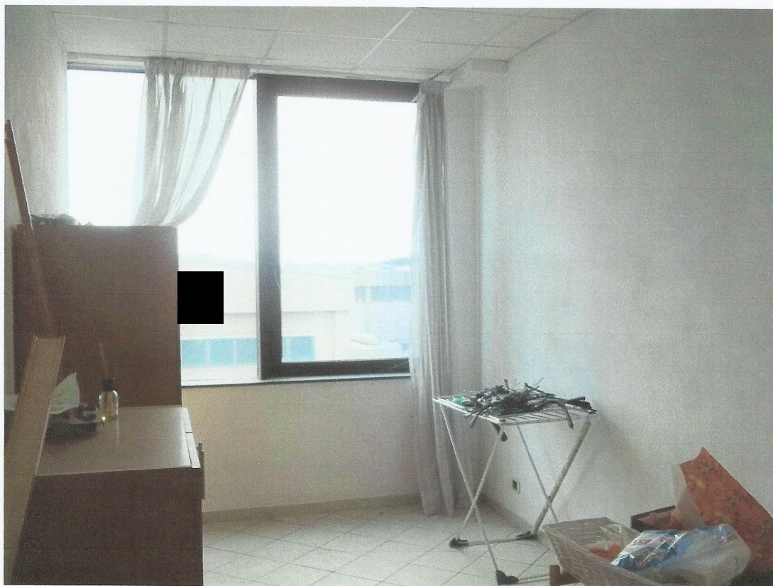
VISTA CAMERA DA LETTO 3 UNITA' IMMOBILIARE LATO NORD