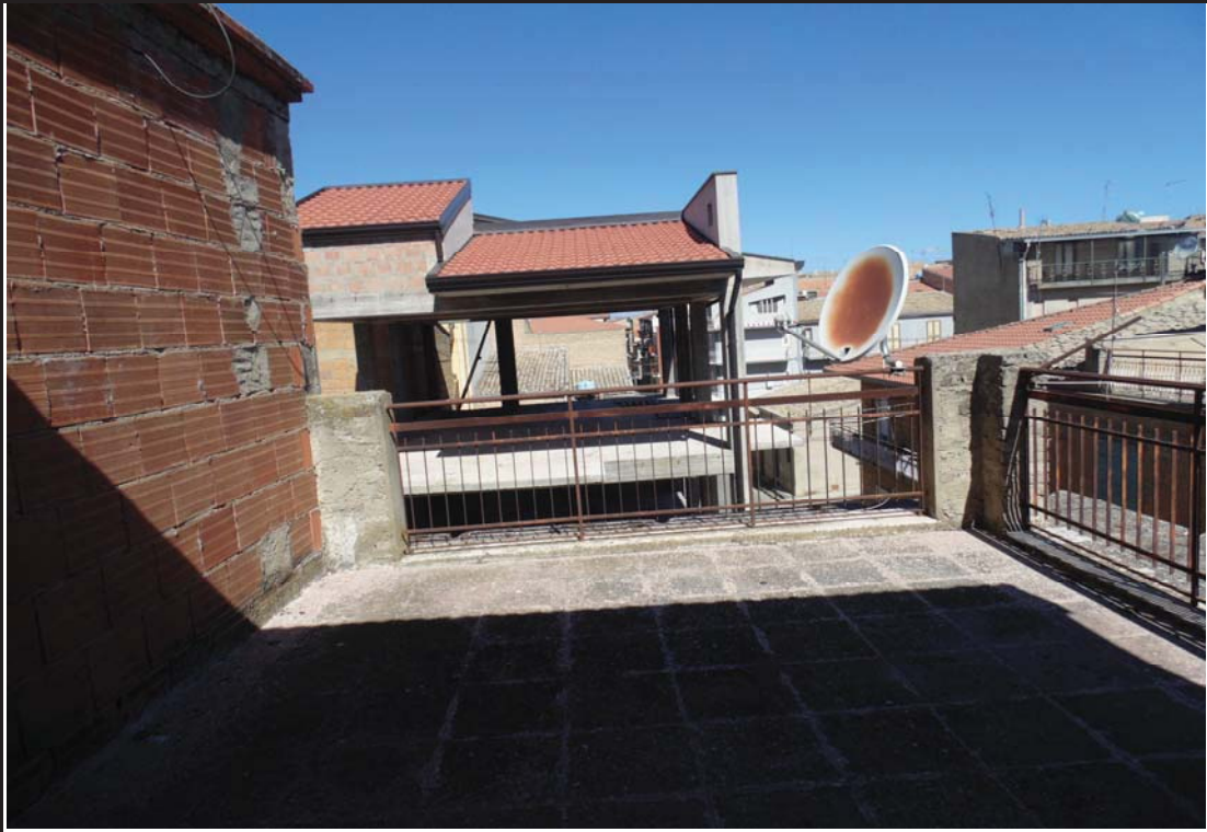
❖ Immobile fg 15 part.282 sub3 via Oliveti n.21-23-25: terrazza P2°