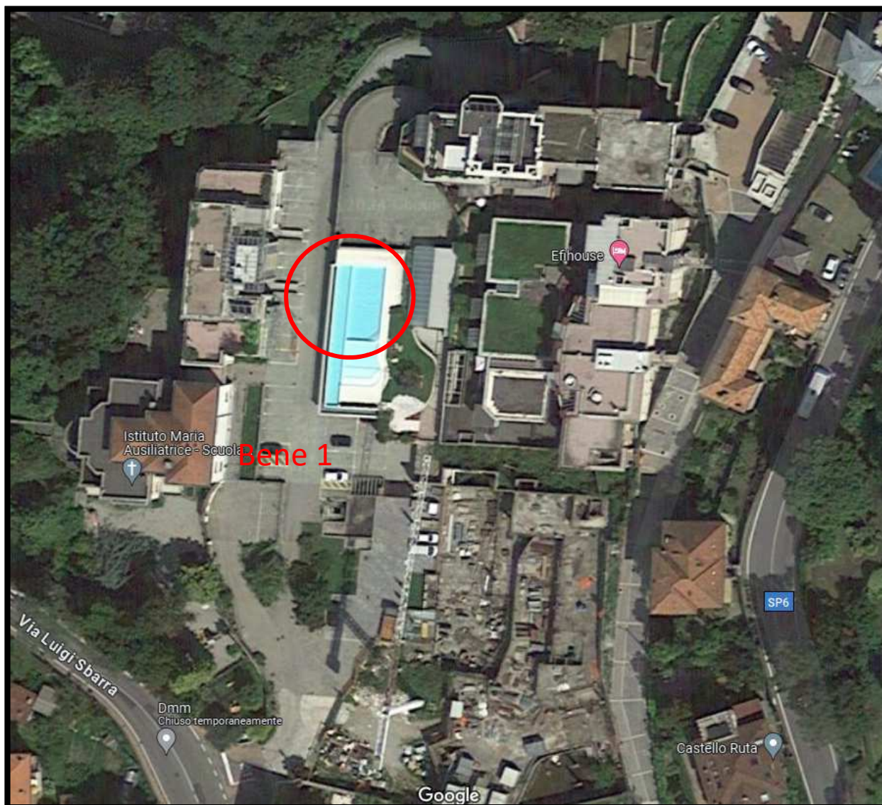
Immagine da siti di pubblica consultazione