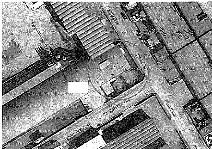
VISTA DEL FABBRICATO

Esso confina con via Parri, via A. Moro, [REDACTED] s.s.a..