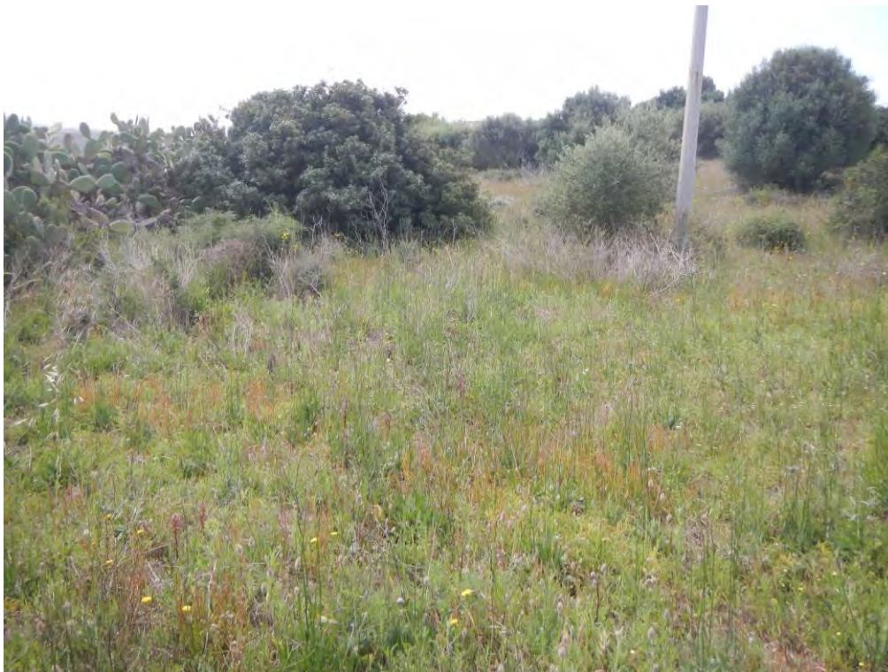
Foto 10: parte di terreno con vegetazione diradata (presenza di linee elettriche)