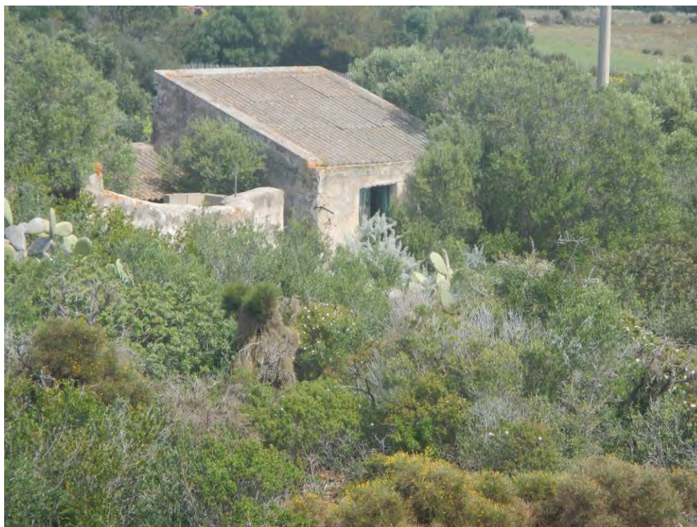
Foto 13: dettaglio edificio con presenza di coperture in cemento amianto