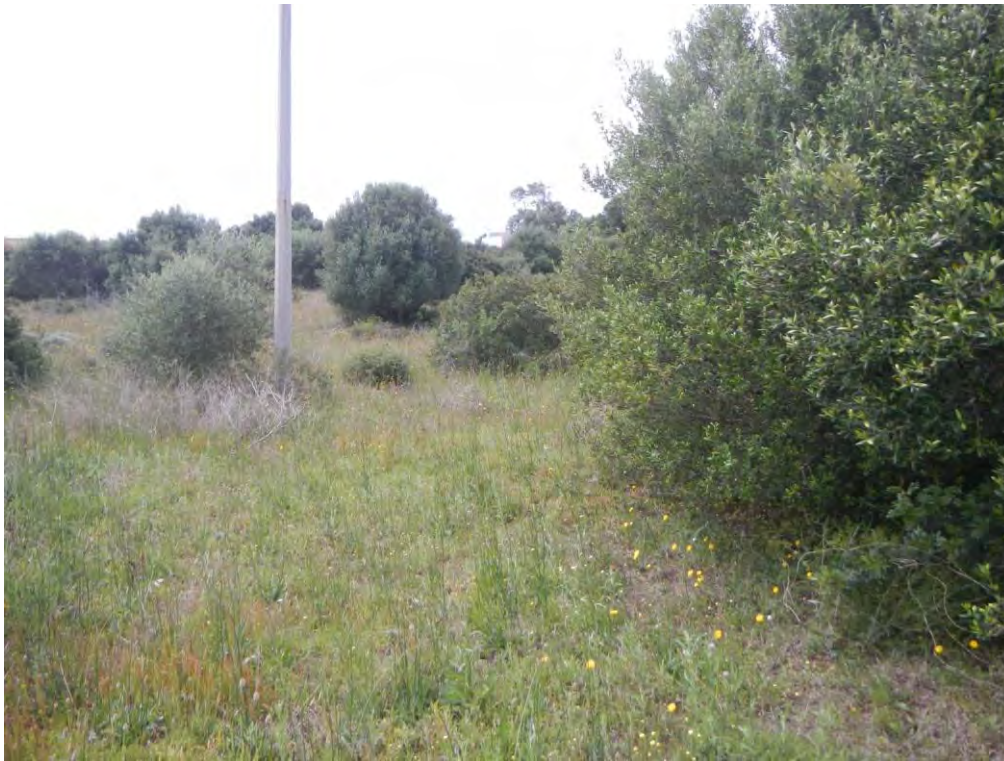
Foto 9: parte di terreno con vegetazione diradata (presenza di linee elettriche)