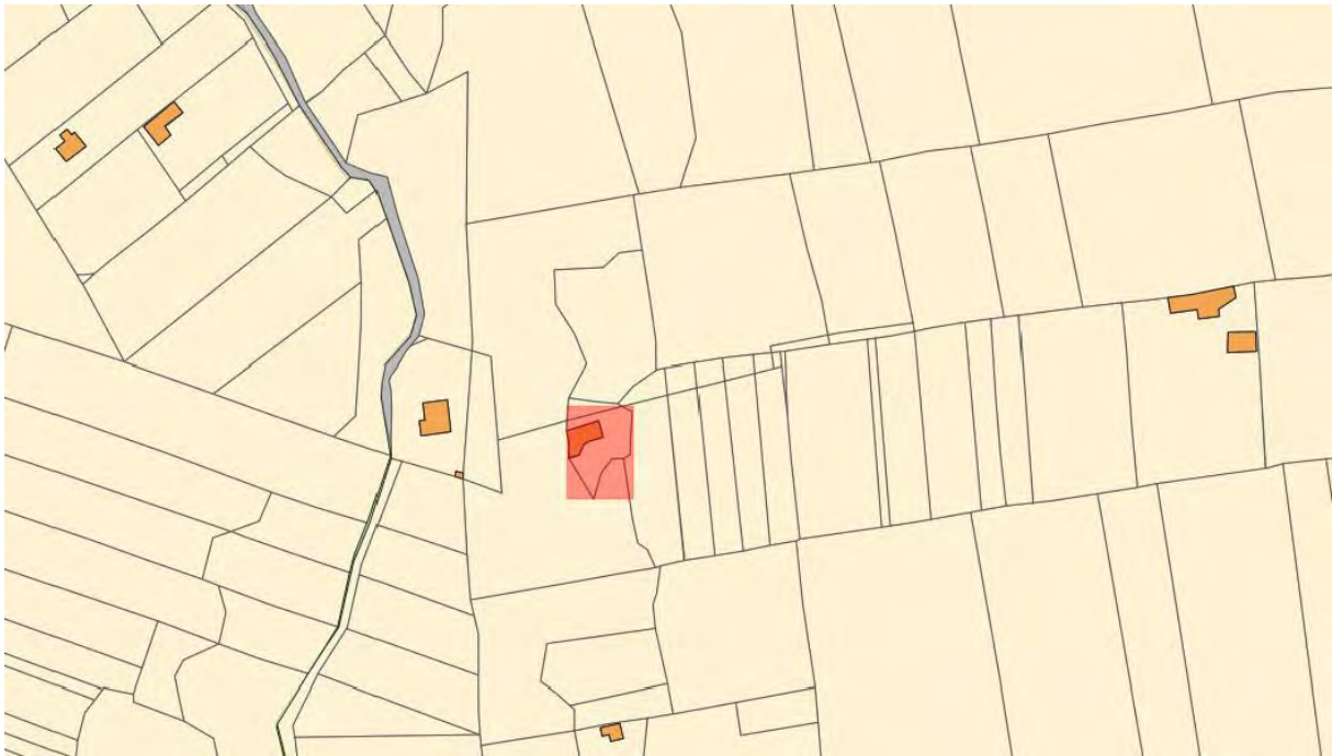
Foto 3: estratto da geoportale cartografico catastale - fabbricato