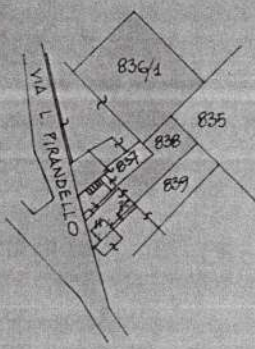
Figura conforme la mappa catastale e tavolare del C.C. di Servola F.M. 7