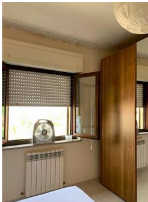
Umidità presente anche sul soffitto della stanza da letto.