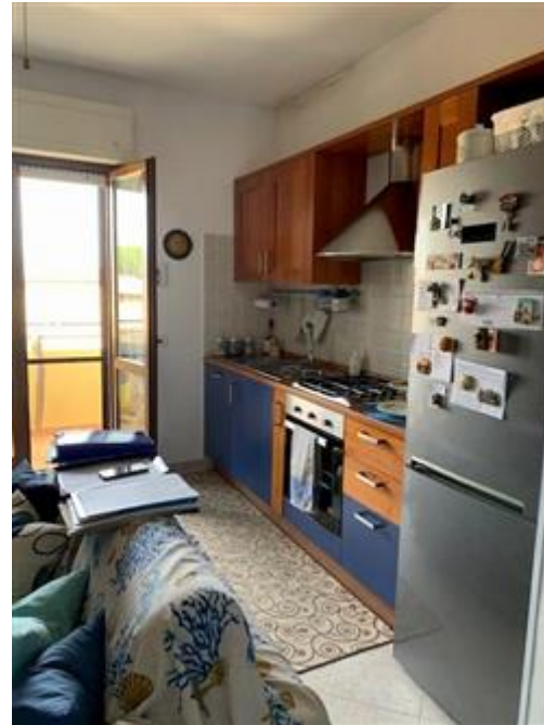
Angolo cucina - soggiorno . In alto, in prossimità del balcone, sono presenti macchie di umidità.