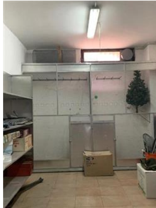
Interno box, al piano S1