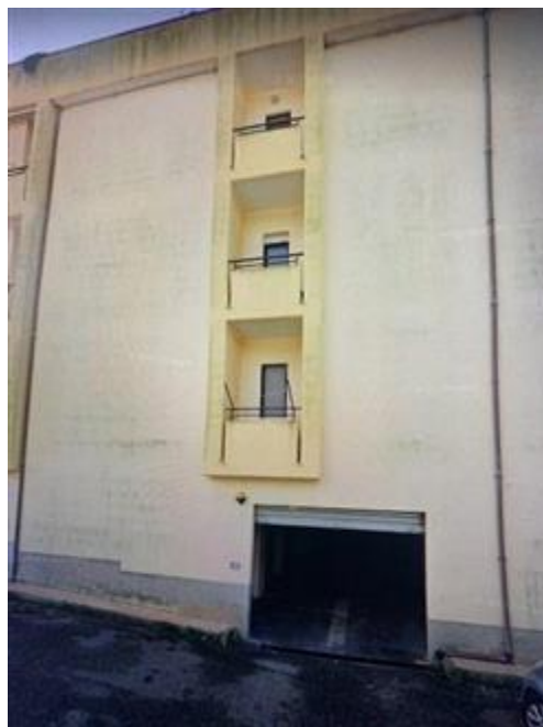
Facciata nord con ingresso ai box.