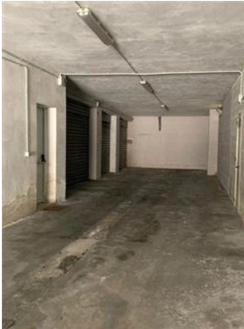
Ingresso al Box