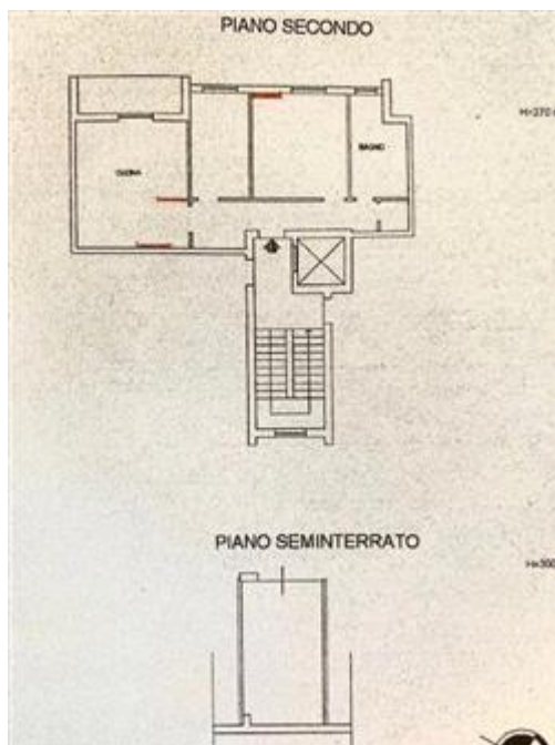
Nella presente planimetria, sono evidenziate, con il colore rosso, le parti esistenti nell'abitazione, ma non presenti nella pianta catastale.