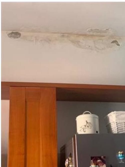
Presenza di umidità sul soffitto e zona alta del soggiorno