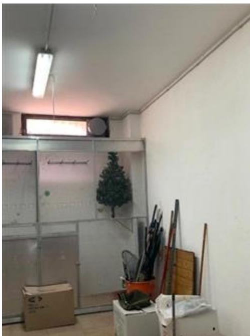
Box al piano seminterrato.