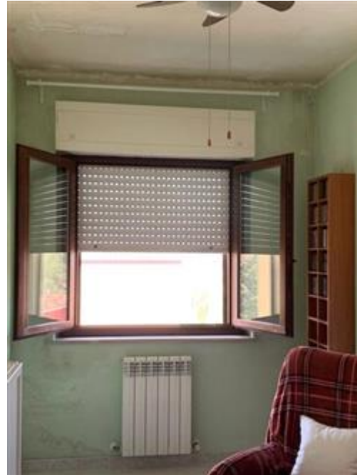
Stanzetta con molta umidità