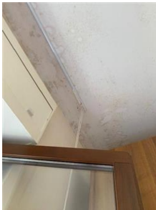
Umidità in cucina