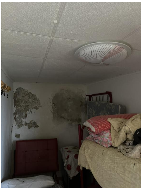
Fotografia n.9 – Piano Primo – L'ambiente destinato a Camera