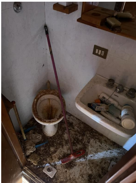
Fotografia n.10 – Piano Primo – L'ambiente destinato a W.c..