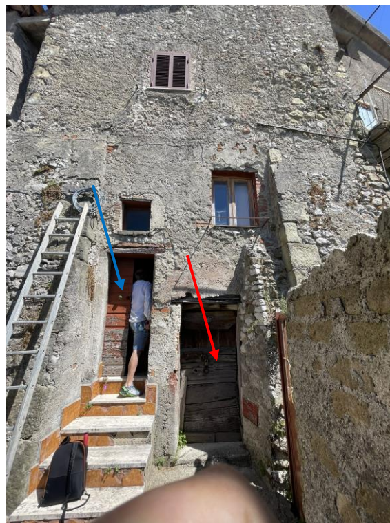
Fotografia n.1 – La porzione del fronte della Particella n.398 ricomprensente anche il bene immobile staggito. Con la freccia color rosso l’accesso agli Ambienti Cantina posti al Paino Terra e, con la freccia color blu, quelli adibiti alla civile abitazione ubicati al Piano Primo.