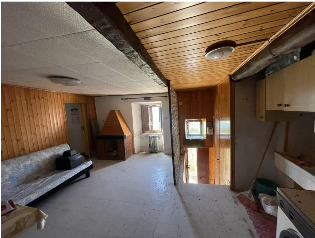
Fotografia n.7 – Piano Primo – Altra visuale dell'ambiente destinato ad angolo cucina/soggiorno/pranzo