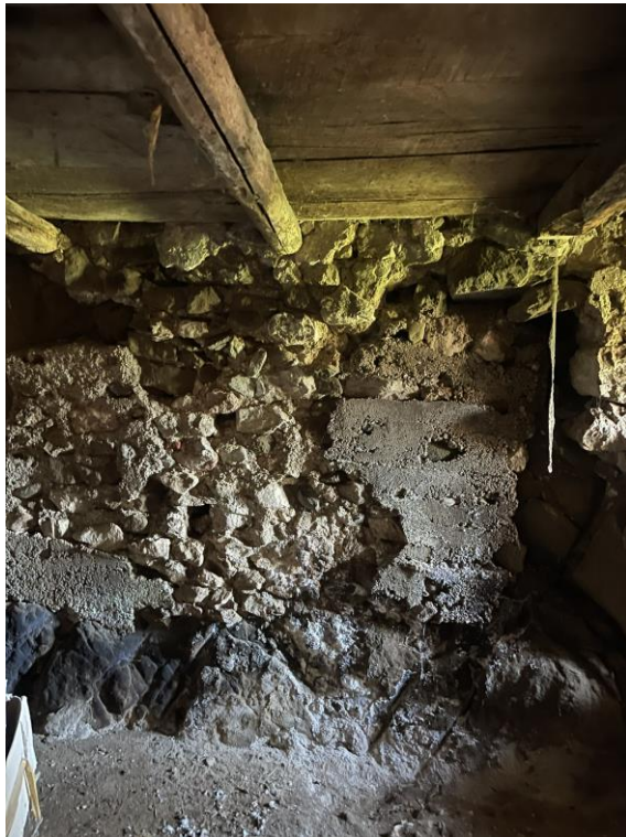
Fotografia n.5 – Piano Terra – Altra visuale dell'interno dell'Ambiente Cantina 2