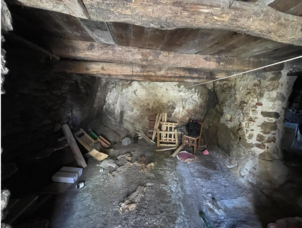
Fotografia n.2 – Piano Terra – L'interno dell'Ambiente Cantina 1