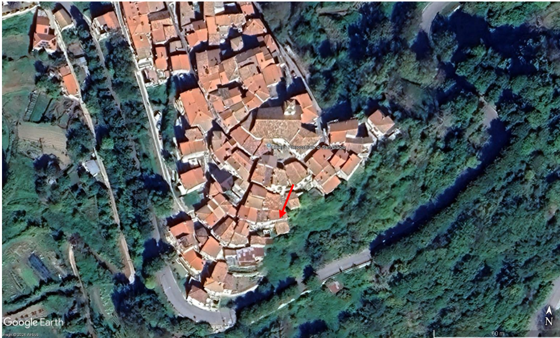
Aerofotogrammetria dei luoghi oggetto di procedura esecutiva – Con la freccia color rosso l’ubicazione del bene staggito.