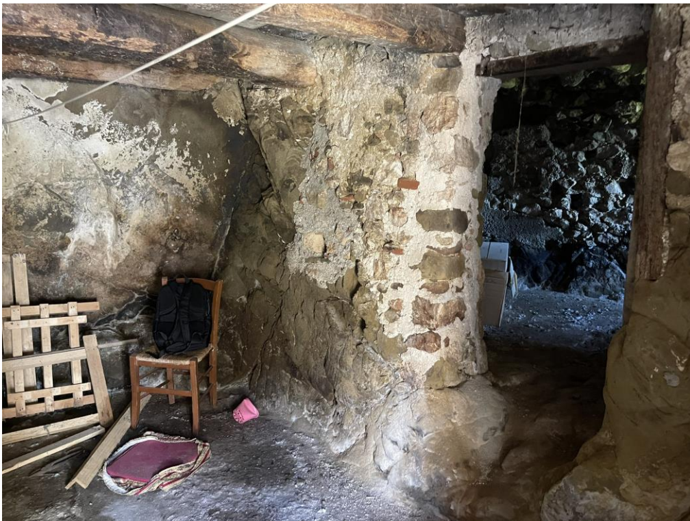
Fotografia n.3 – Piano Terra – Altra visuale dell'interno dell'Ambiente Cantina 1