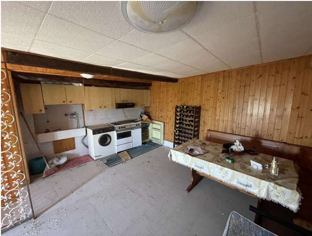
Fotografia n.6 – Piano Primo – L'ambiente destinato ad angolo cucina/soggiorno/pranzo