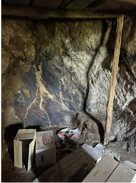
Fotografia n.4 – Piano Terra – L'interno dell'Ambiente Cantina 2