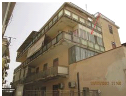
Chiusura balcone lato SUD da parte del debitore omissis