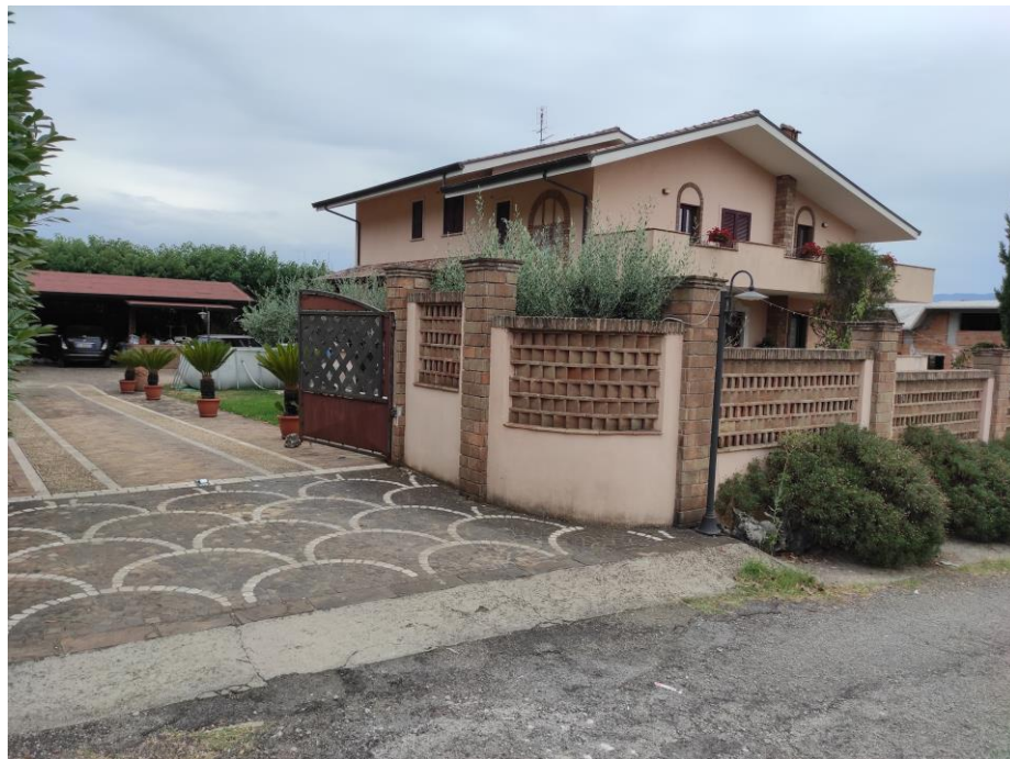
Vista generale del fabbricato da via Grotta Scacciamosca in cui sono ubicati i beni oggetto della presente Esecuzione Immobiliare. (lato nord-ovest)