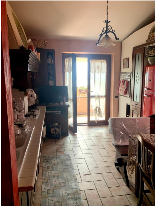
Vista parziale interna della cucina.