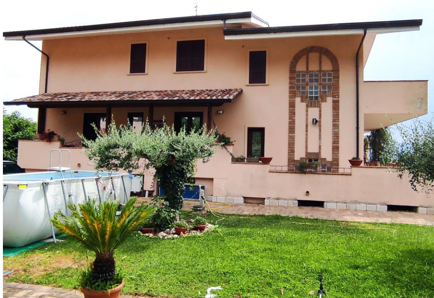
Prospetto laterale del fabbricato in cui sono ubicati i beni oggetto della presente Esecuzione Immobiliare (lato nord). In cui si evince sul balcone l'ingresso del bene n. 1 contraddistinto con il sub 7.