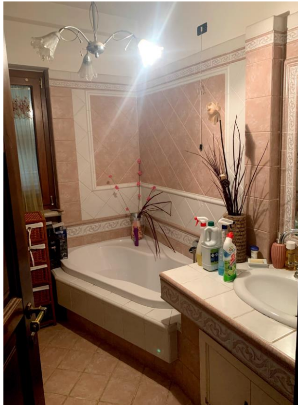
Vista parziale interna del bagno padronale.

03037 PONTECORVO (Fr) Via B. CROCE, snc Tel./fax. 0776761774 e-mail: dariobastoni@libero.it Pec: architettodariobastoni@pec.it