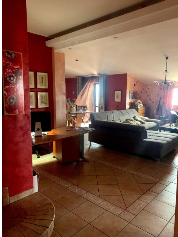
Vista parziale interna della sala da pranzo dalla zona ingresso.