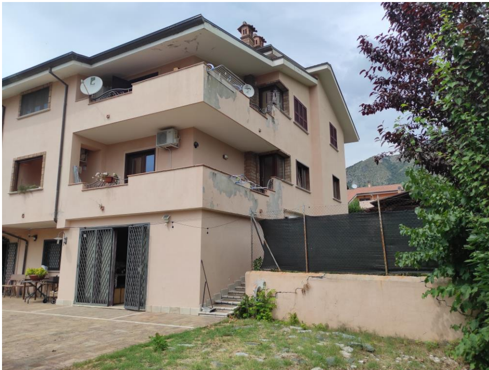
Prospetto laterale del fabbricato in cui sono ubicati i beni oggetto della presente Esecuzione Immobiliare (lato est).