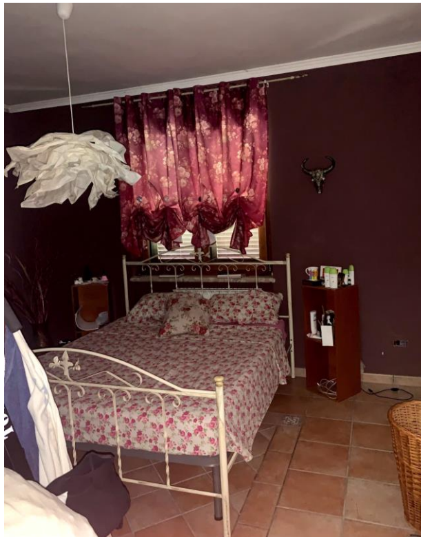
Vista parziale interna di una camera da letto.

03037 PONTECORVO (Fr) Via B. CROCE, snc Tel./fax. 0776761774 e-mail: dariobastoni@libero.it Pec: architettodariobastoni@pec.it