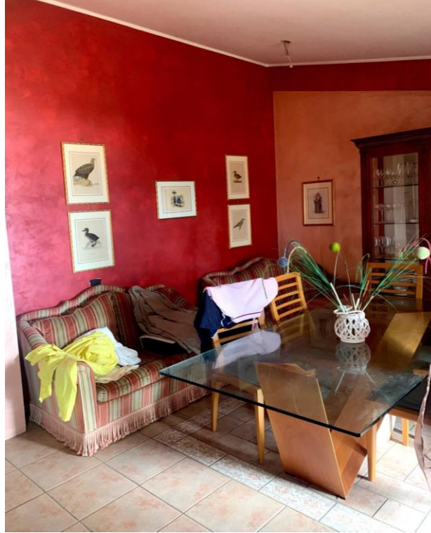
Viste parziali interne della sala da pranzo.

(Appartamento a piano primo ubicato a Castrocielo (FR) - Via Grotta Scacciamosca, 23 in N.C.E.U., al Fg. 6 P.lla 374 Sub 6)