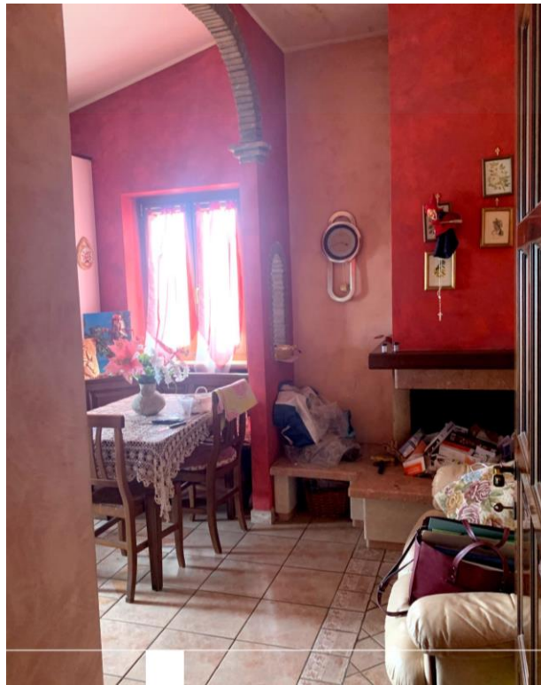
Vista parziale interna della cucina dalla zona ingresso.

03037 PONTECORVO (Fr) Via B. CROCE, snC Tel./fax. 0776761774 e-mail: dariobastoni@libero.it Pec: architettodariobastoni@pec.it