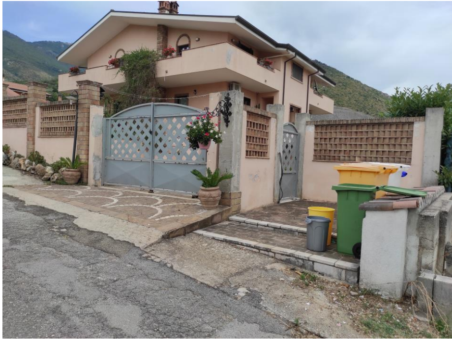
Vista generale del fabbricato da via Grotta Scacciamosca in cui sono ubicati i beni oggetto della presente Esecuzione Immobiliare. (lato sud-ovest)