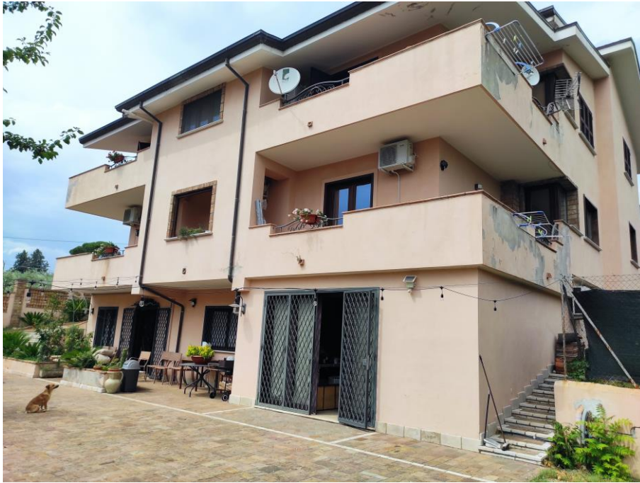
Prospetto laterale del fabbricato in cui sono ubicati i beni oggetto della presente Esecuzione Immobiliare (lato sud). In cui si evince a piano primo sottostrada l'ingresso del bene n. 2 contraddistinto con il sub 5.