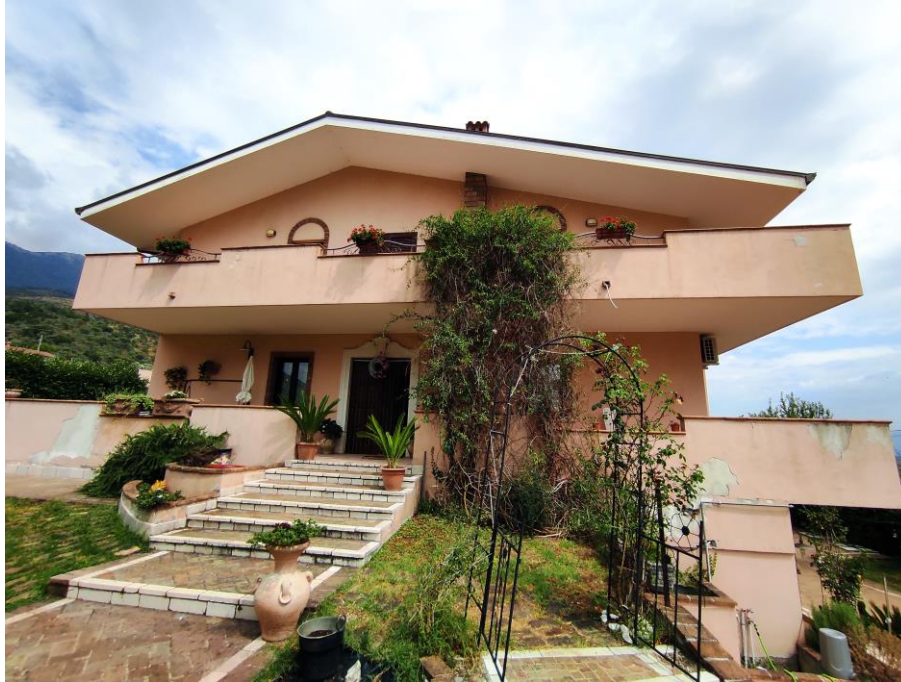
Prospetto frontale lato ingresso del fabbricato in cui sono ubicati i beni oggetto della presente Esecuzione Immobiliare (lato ovest). In cui si evince l'ingresso dei beni n. 1, 3 e 4 contraddistinti con i sub 6,7,8.