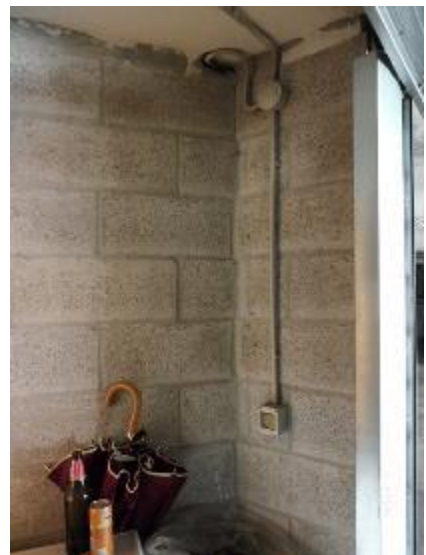
_immagini interne sub 21