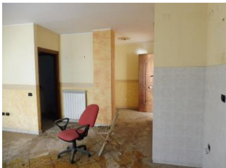
_soggiorno con angolo cottura