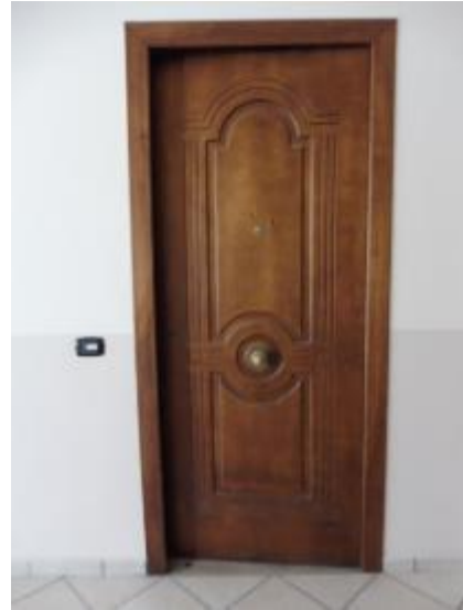
_androne comune e accesso all'unità abitativa