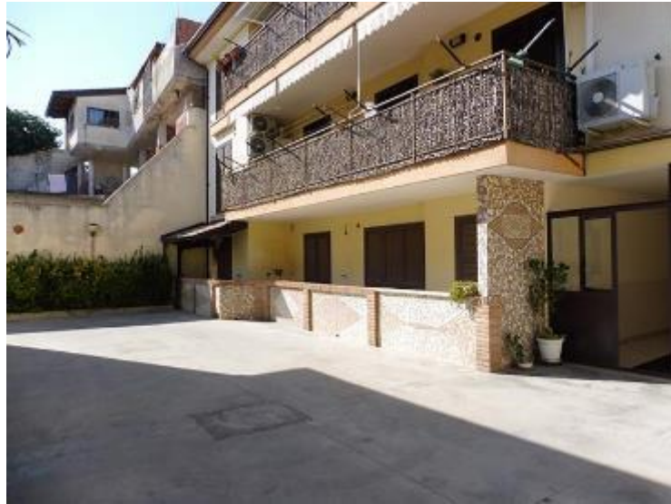
_immagini esterne - dal cortile interno comune