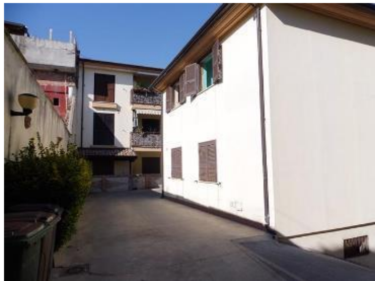
_immagini esterne - da via Starza e dal cortile interno comune