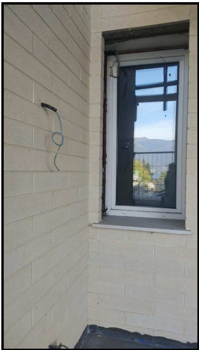
Portico e area esterna