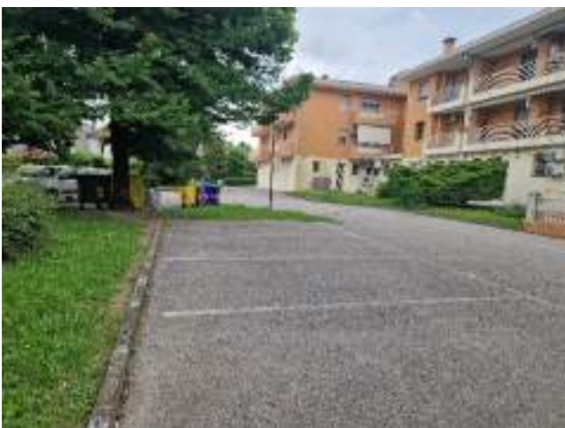
foto n. 17 - posti auto area scoperta