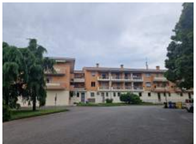
foto n. 18 - area scoperta est