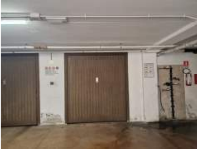
foto n. 13 - portone garage