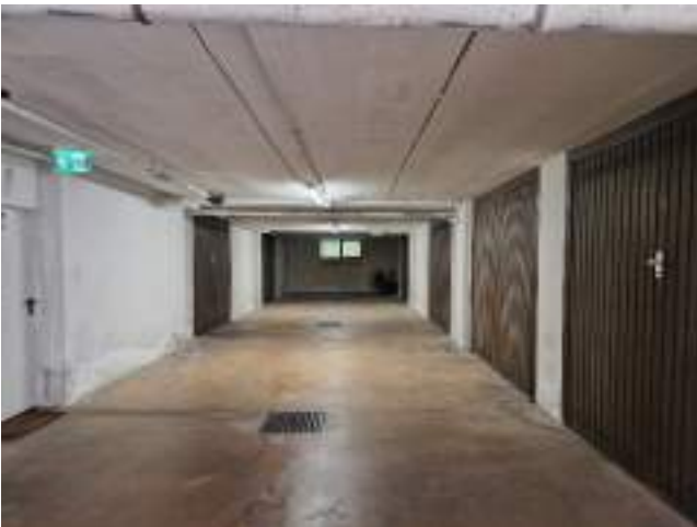
foto n. 15 - corsia di manovra