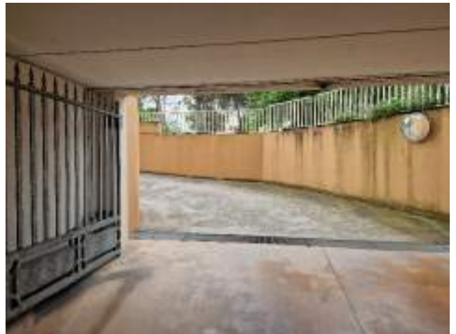
foto n. 16 - rampa di accesso ai garages