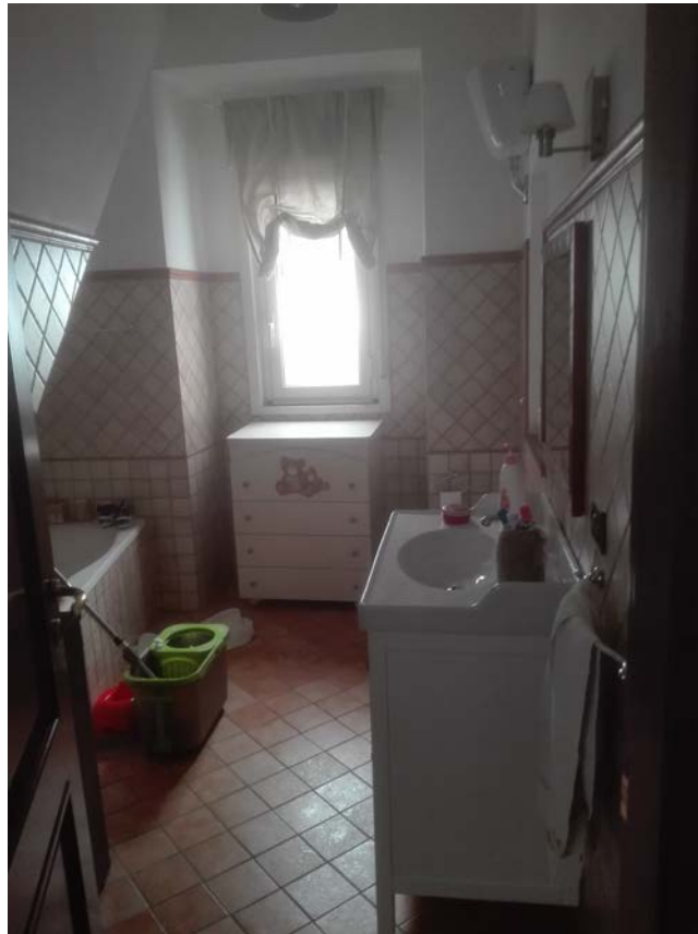
13. Bagno piano secondo