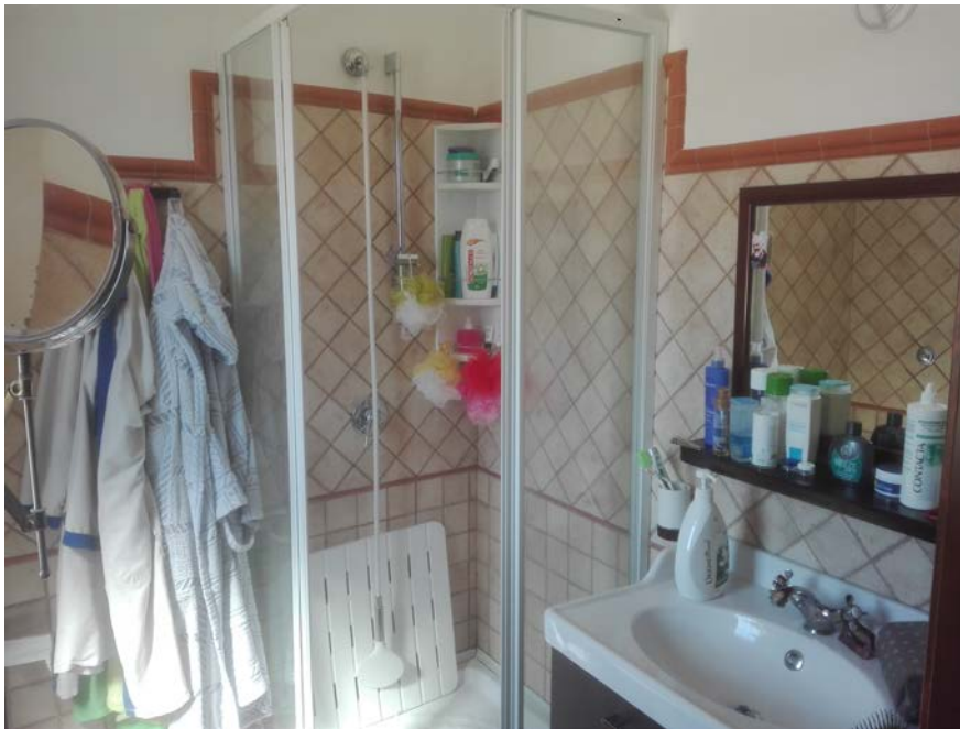
9. W.C. piano primo