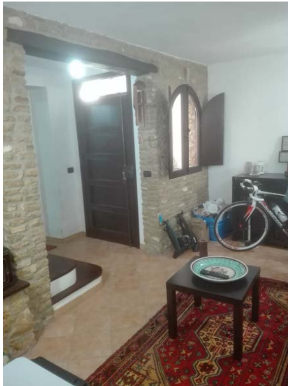
5. Ingresso piano terra