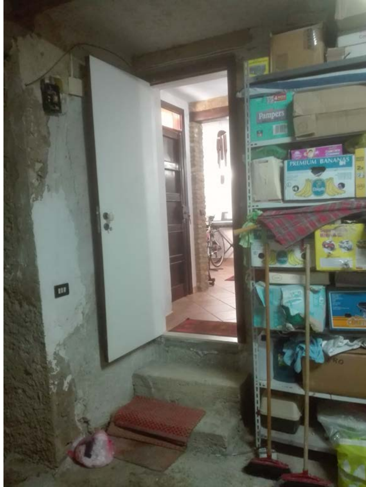
4. Magazzino piano terra