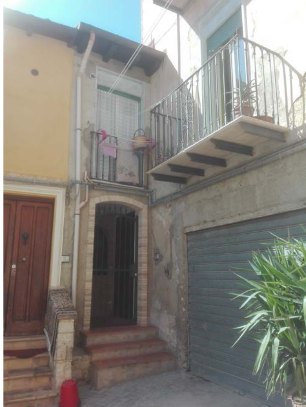
2. Ingresso piano terra da Via Dandolo