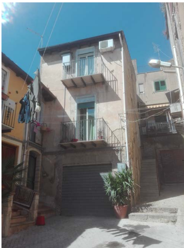
1. Vista da Via Dandolo