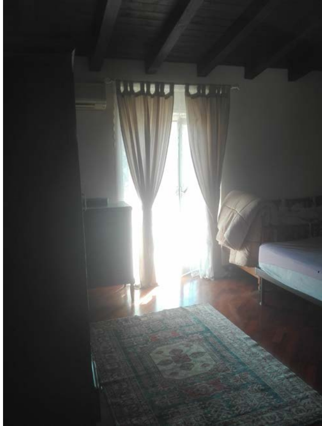
12. Letto Primo