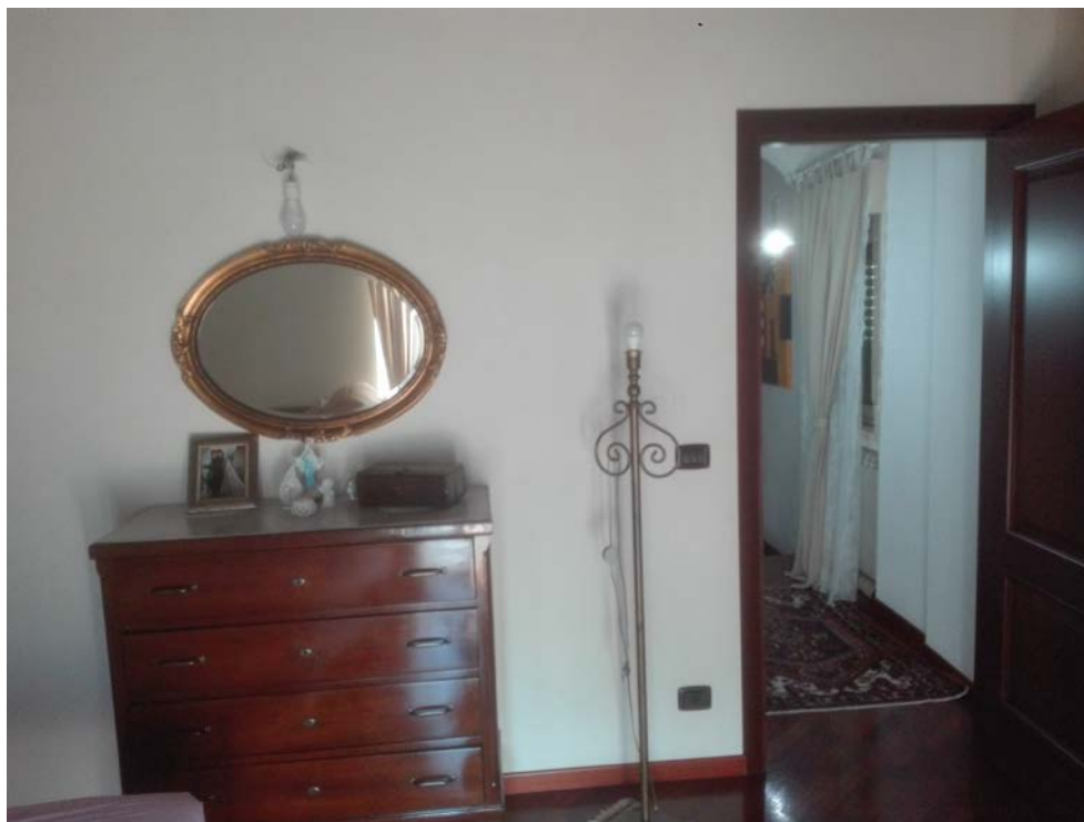
11. Letto piano primo