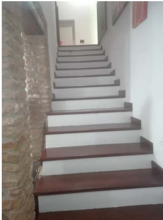
7. Scala terra- primo