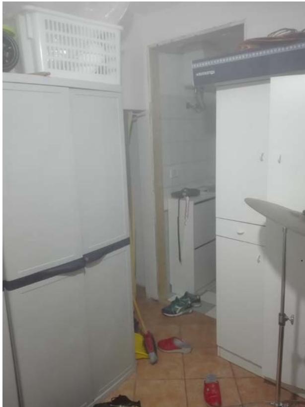
6. Disimpegno piano terra