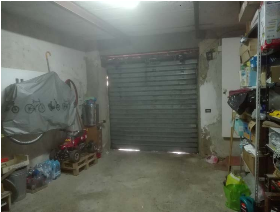
3. Magazzino piano terra