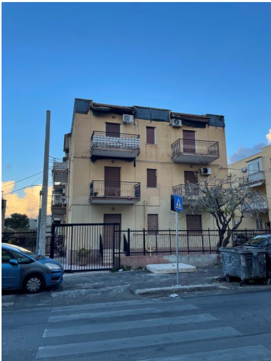
Vista prospetto principale da Via Galletti