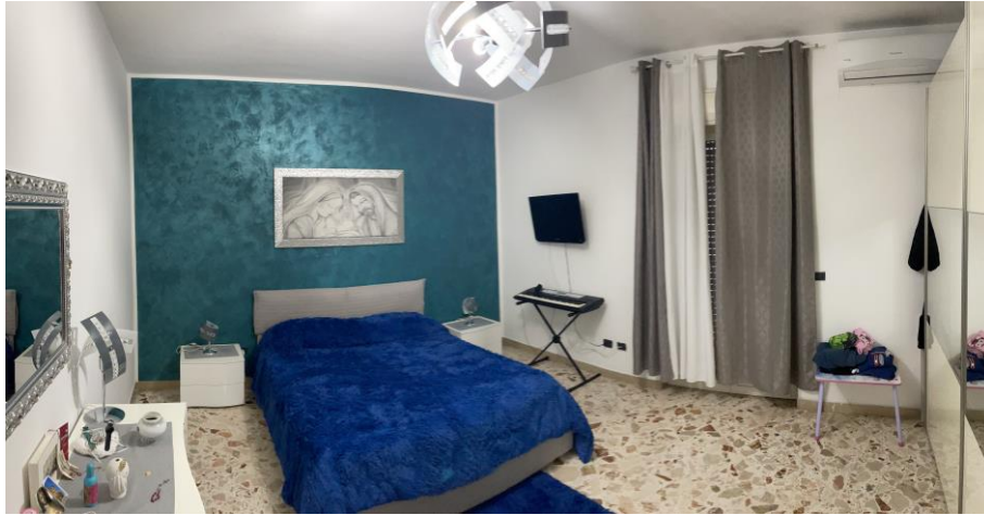
Vano camera da letto