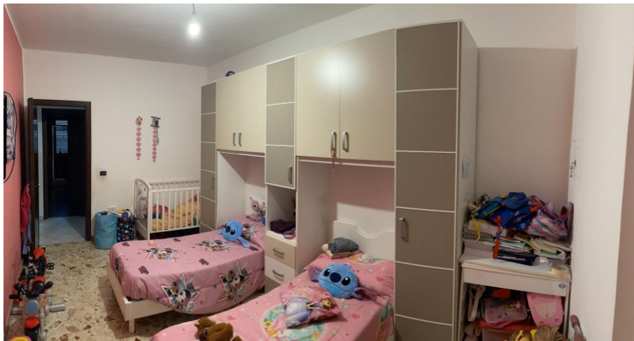
Vano camera da letto