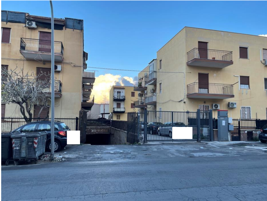
Vista ingresso carrabile e pedonale da Via Galletti