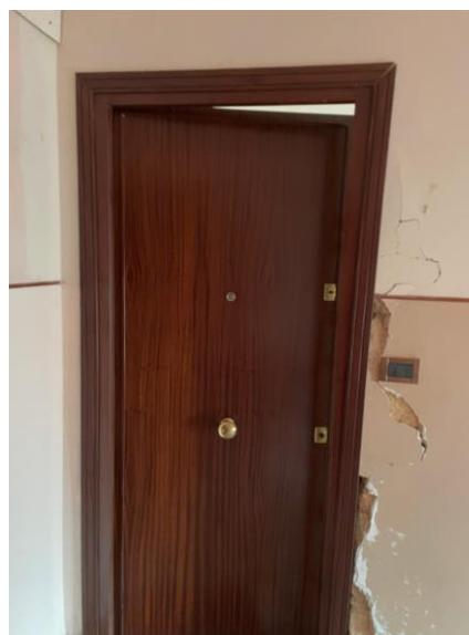
Vano scala e ingresso appartamento