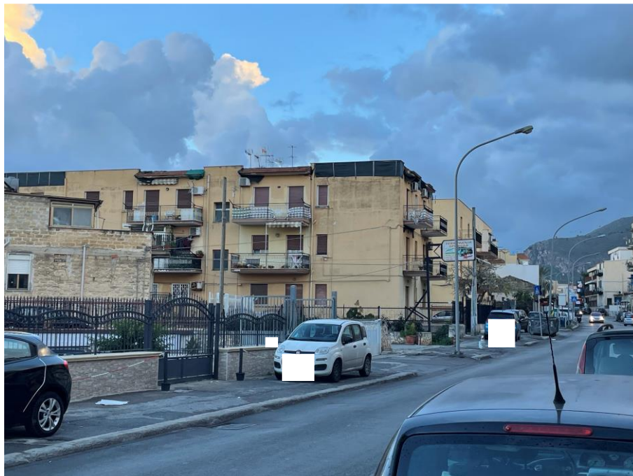
Vista prospetto laterale da Via Galletti