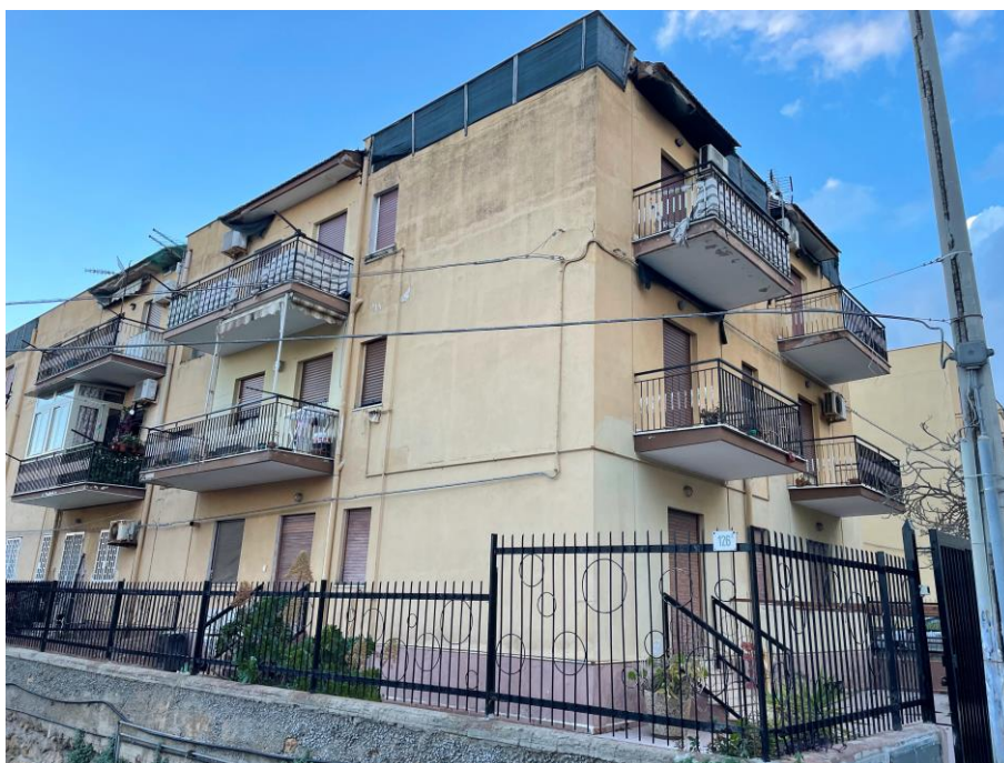
Vista prospetto laterale da Via Galletti