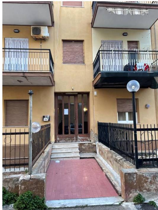
Vista ingresso da strada privata