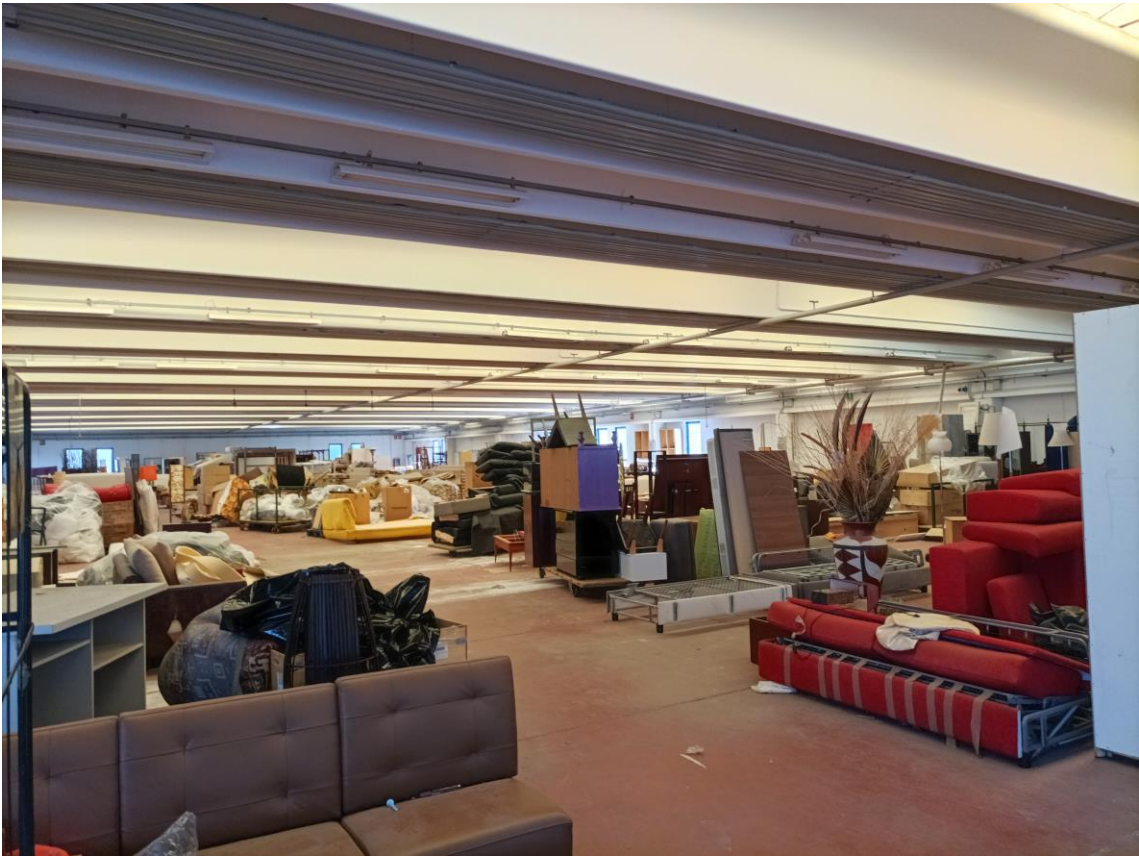
Veduta interna – Piano Terra.