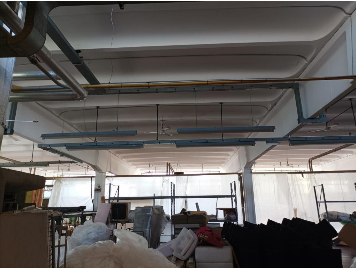
Veduta interna - Piano Terra.