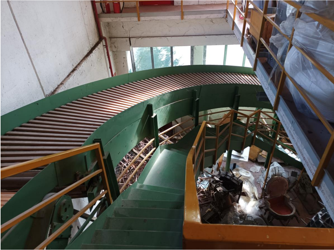
Veduta interna – Scala e scivolo di collegamento tra i piani.