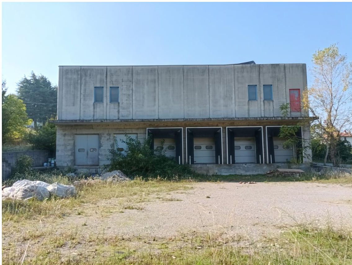
Veduta esterna – prospetto a Est.