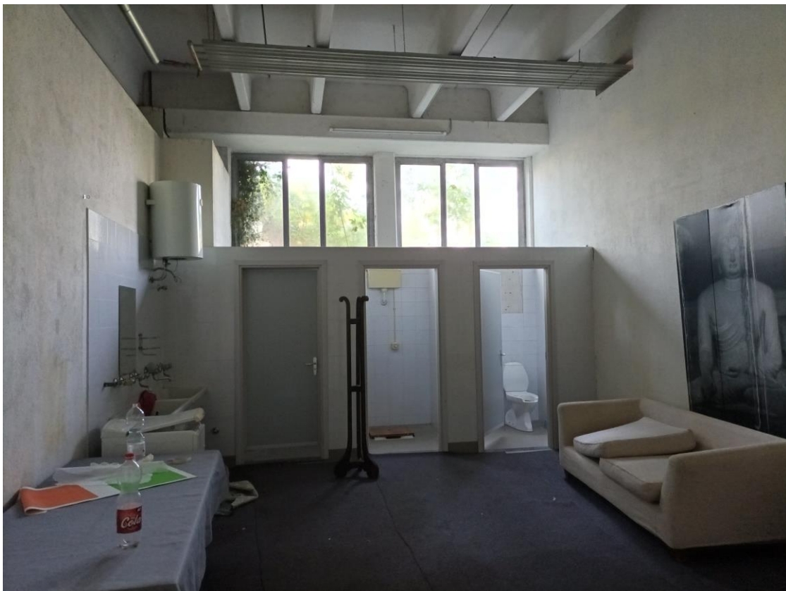
Veduta interna - Piano Seminterrato – Bagni e spogliatoi