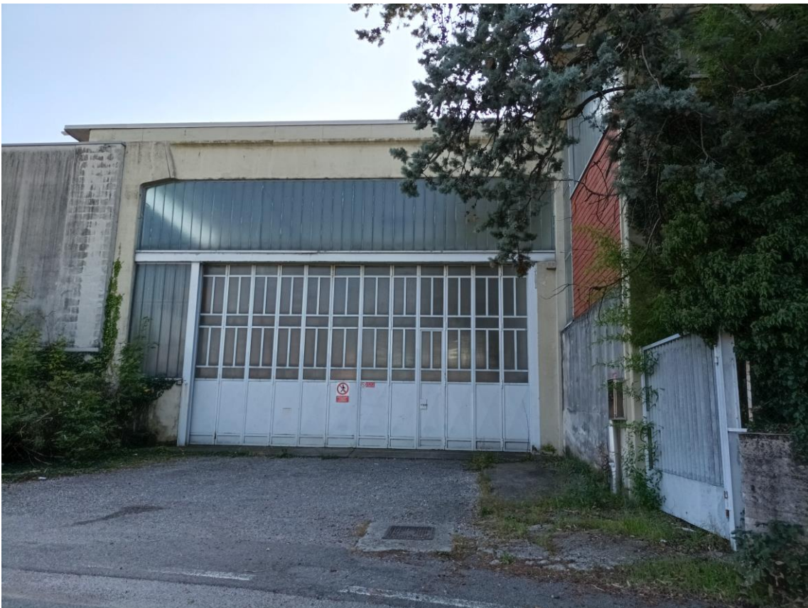
Veduta esterna – Ingresso carraio a Nord.