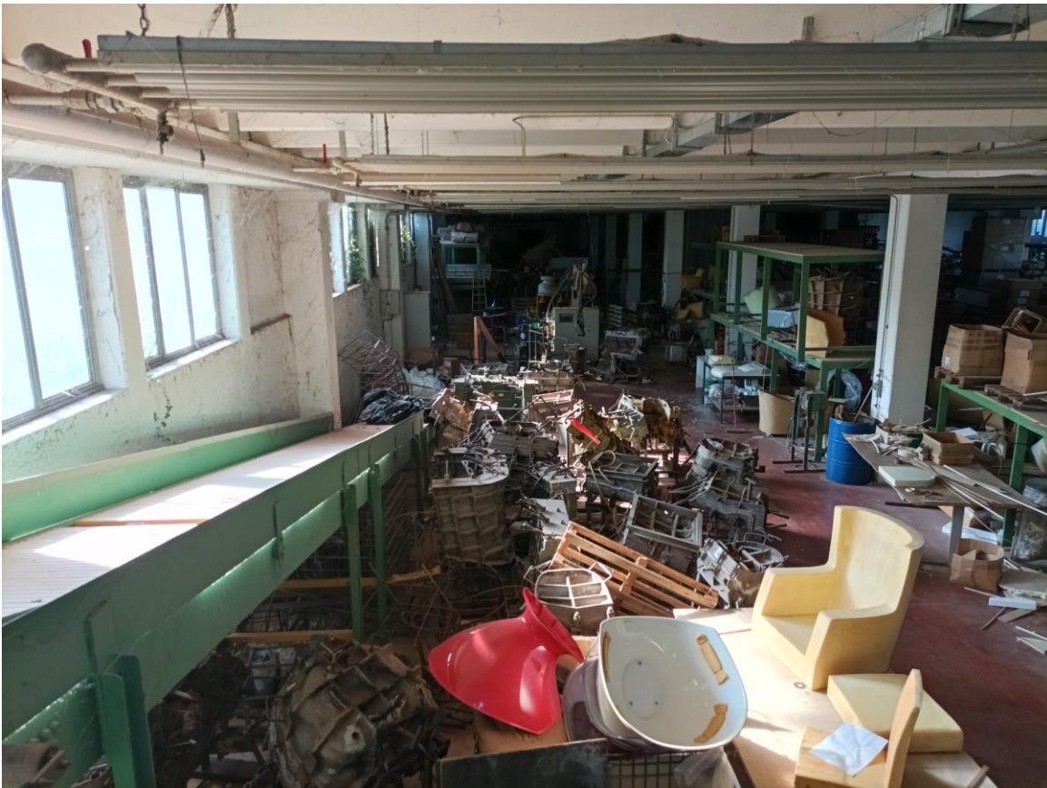
Veduta interna – Piano Seminterrato