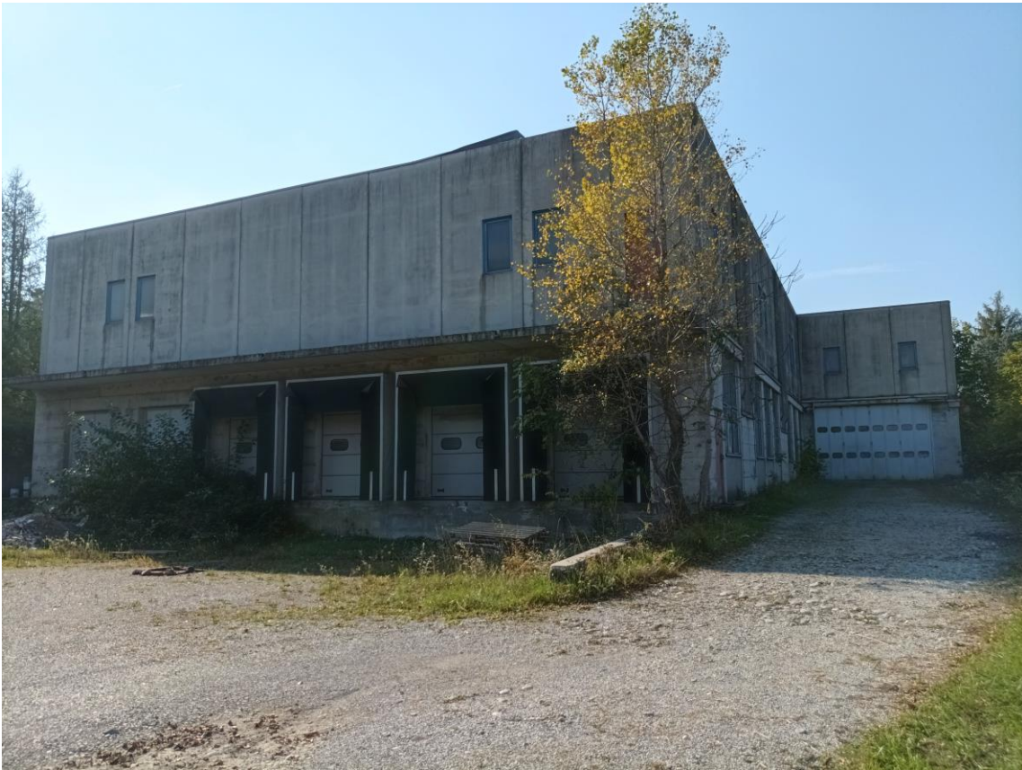
Veduta esterna – prospetto a Nord-Est.