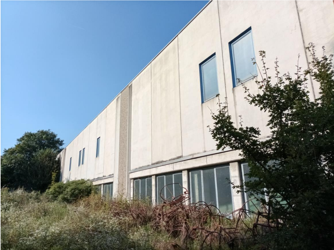
Veduta esterna – prospetto Sud.