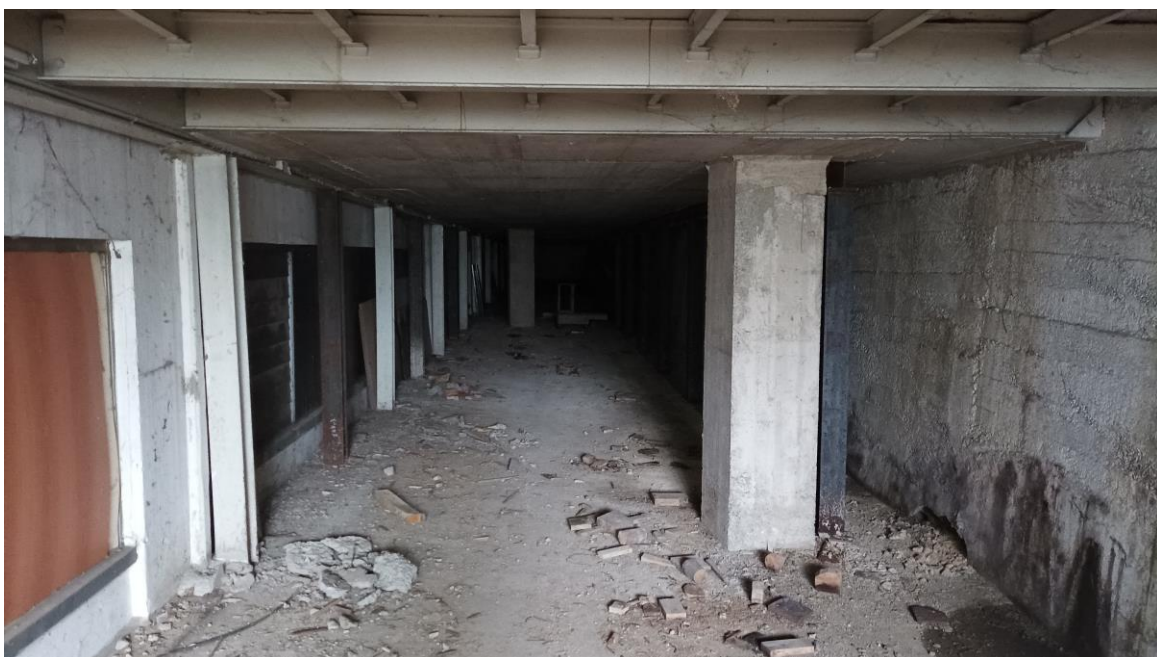
Veduta interna – Intercapedine Piano Seminterrato