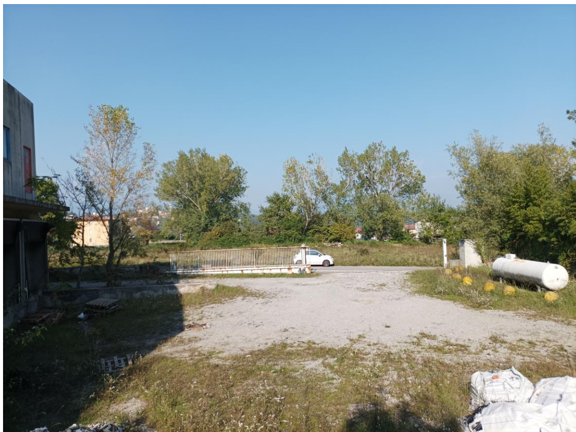
Veduta esterna - ingresso carraio e cortile.