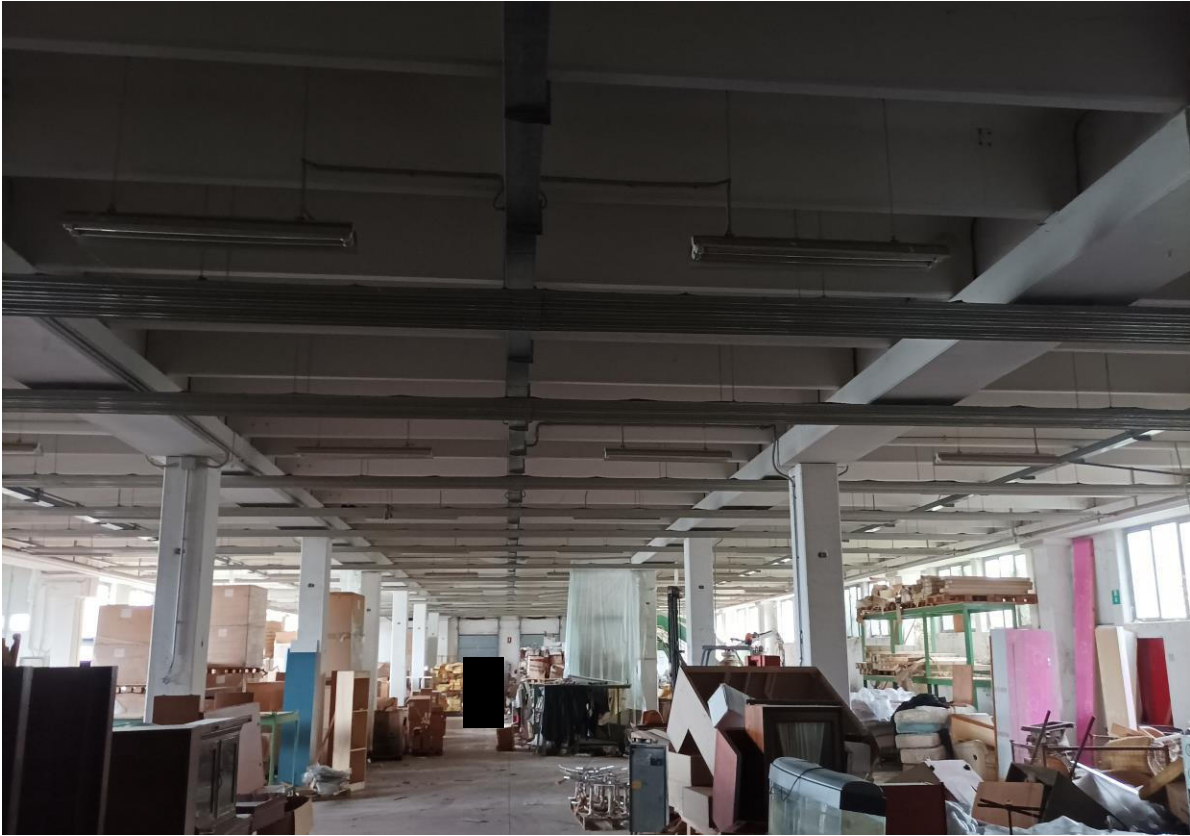
Veduta interna - Piano Seminterrato.