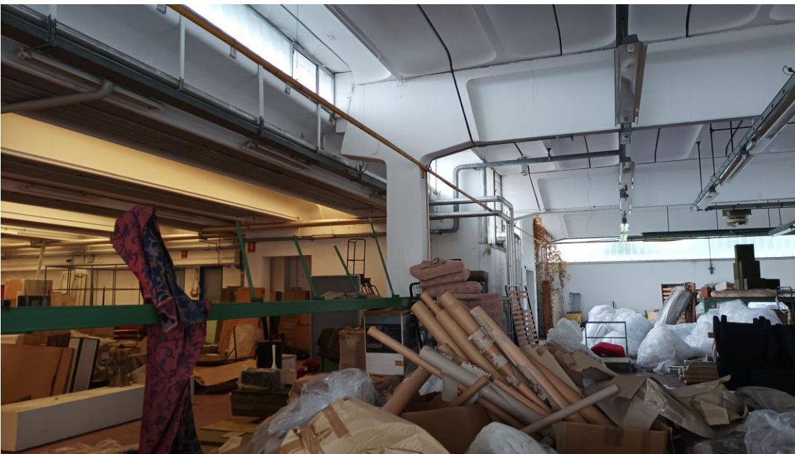
Veduta interna - Piano Terra, visuale verso zona scale e montacarichi.