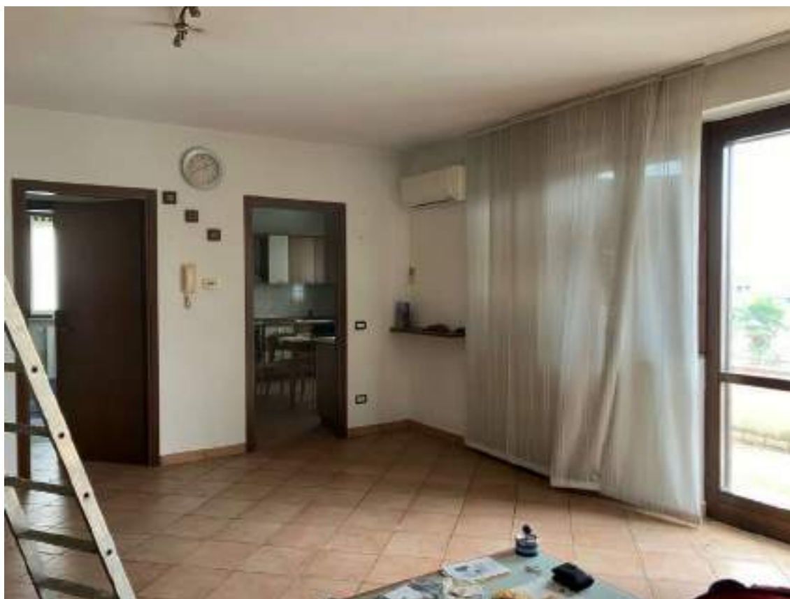
Foto n. 13 | Vista del soggiorno con la porta della cucina sulla destra.