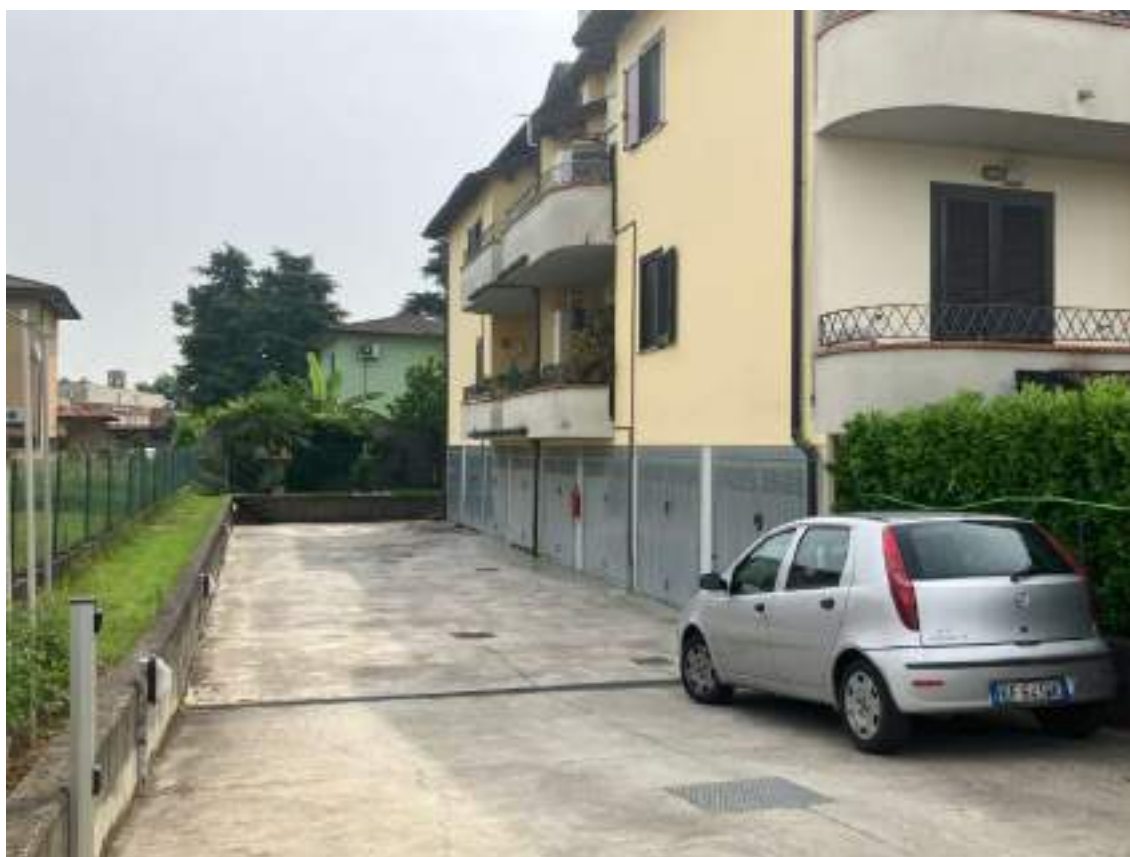
Foto n. 6 | Vista della facciata posteriore del condominio con l'accesso ai box.