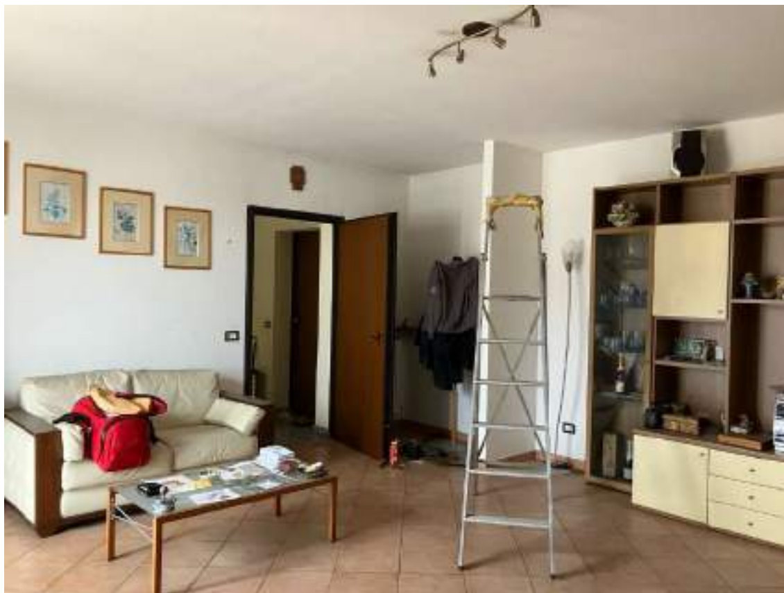
Foto n. 11 | Vista del soggiorno con la porta d'ingresso all'appartamento.