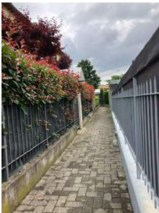
Foto n. 4 | Ingresso pedonale all'edificio dalla stradina interna sulla via Brusocchi.