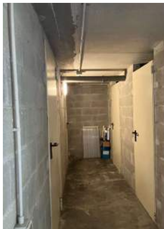
Foto n. 25-26 | Vista della scala di accesso al piano seminterrato e corridoio di disimpegno.