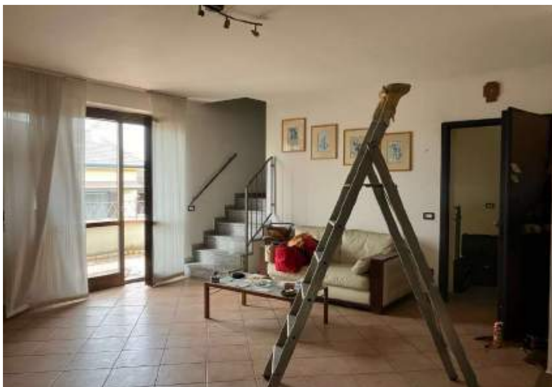
Foto n. 12 | Vista del soggiorno con la porta finestra del balcone e la scala al piano mansardato.