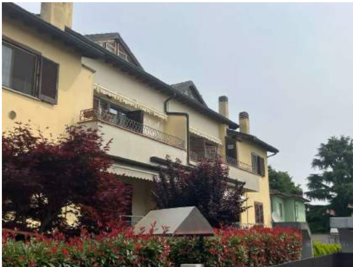
Foto n. 5 | Vista generale dell'edificio con l'appartamento al primo piano sulla destra.