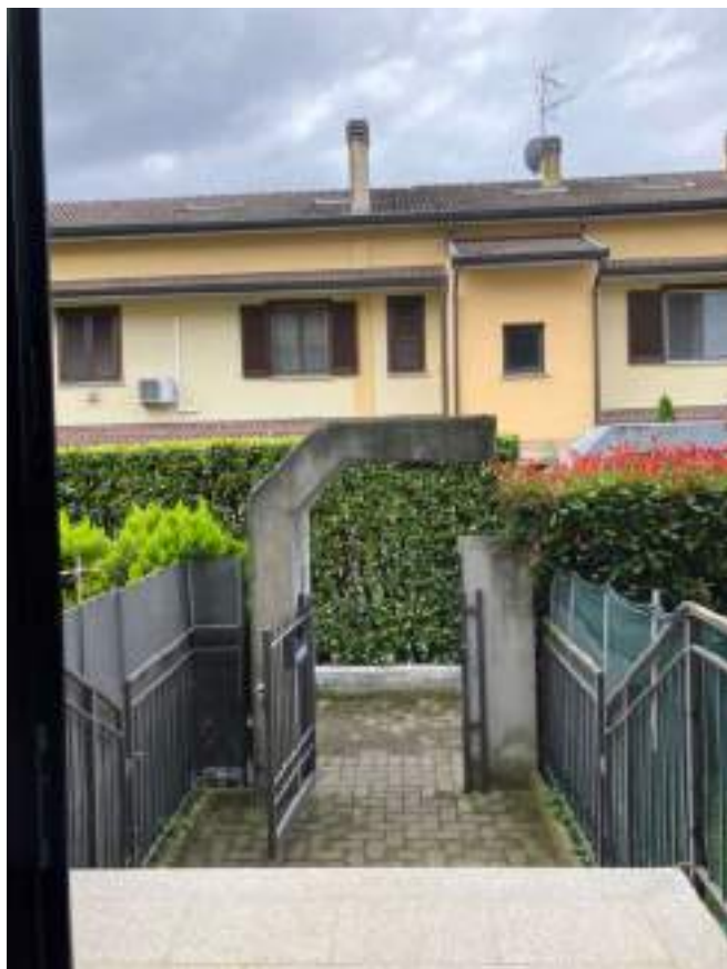
Foto n. 9 | Vista dell'ingresso al condominio dalla stradina interna.