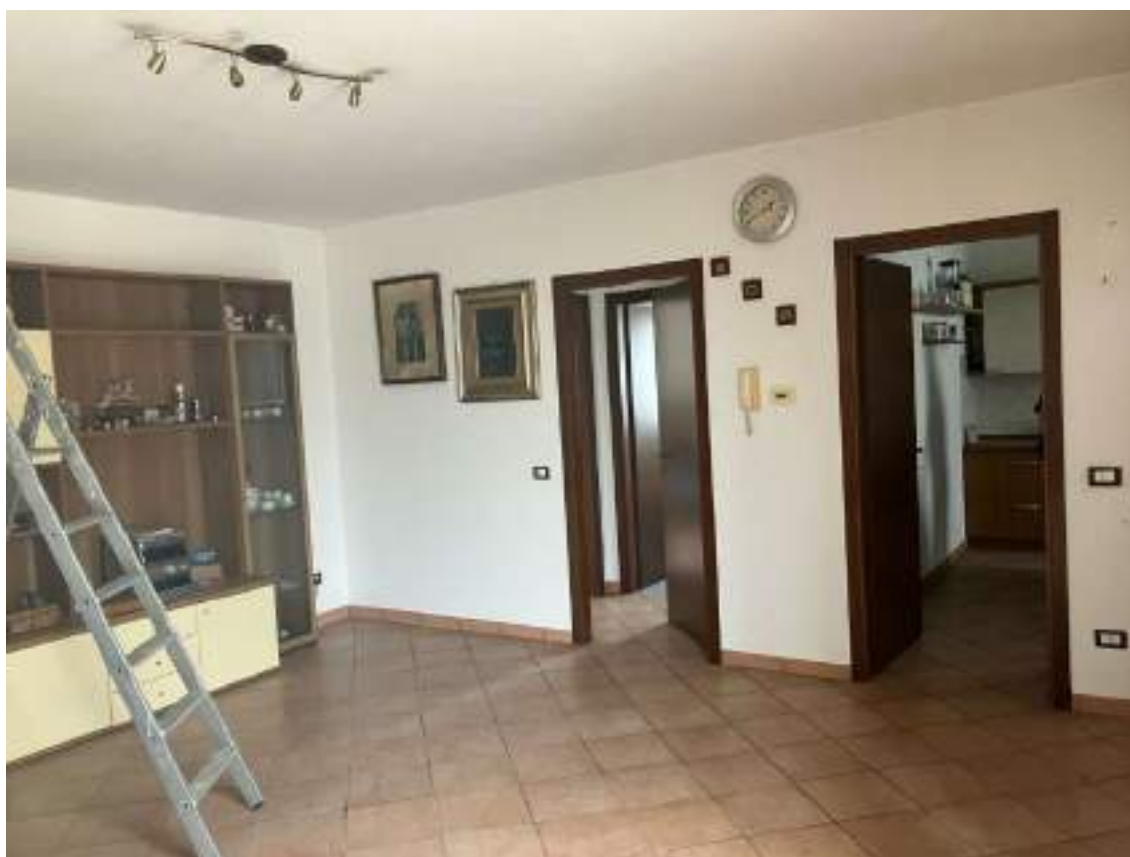
Foto n. 14 | Vista del soggiorno con la porta della zona notte a sinistra e della cucina a destra.