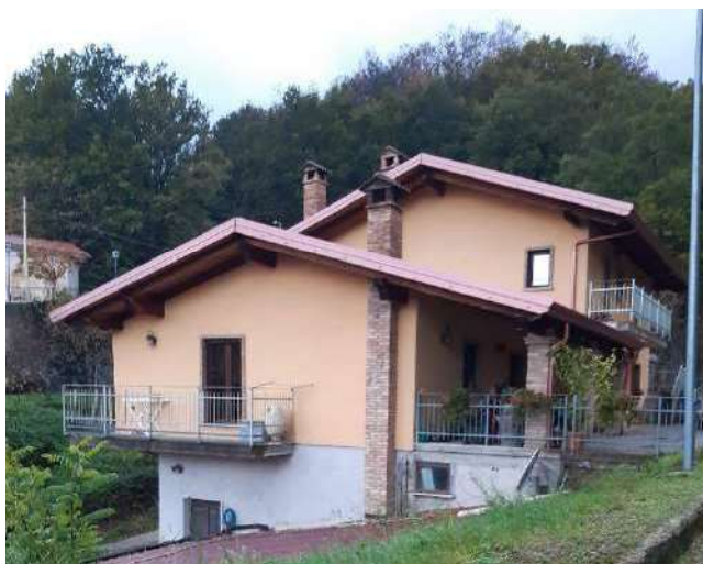
PIANO TERRA E PIANO PRIMO LATO EST