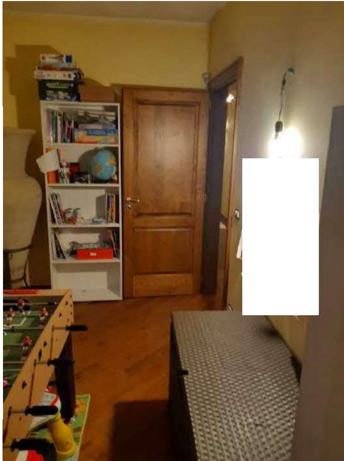
RIPOSTIGLIO POSTO IN FONDO AL DISIMPEGNO