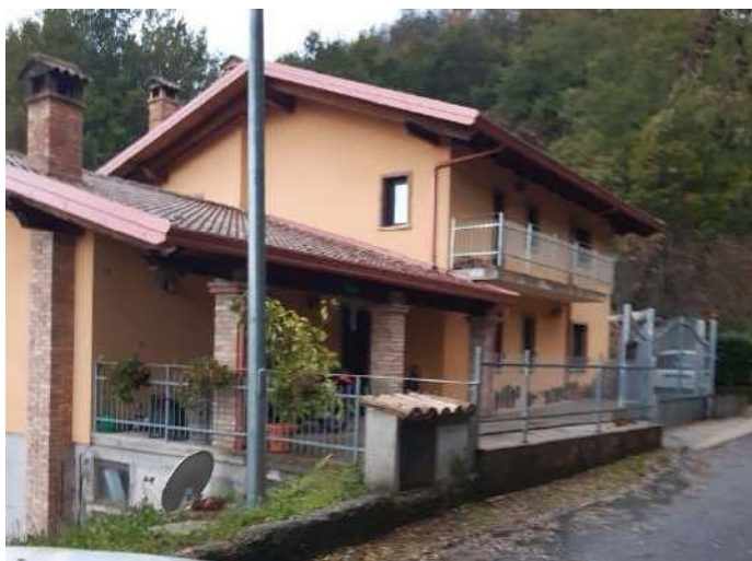
PIANO TERRA E PIANO PRIMO LATO NORD