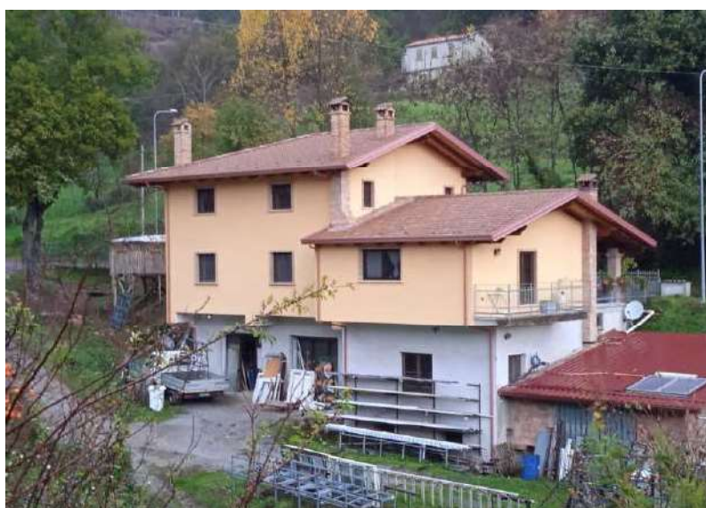
PIANO TERRA E PIANO PRIMO LATO SUD EST