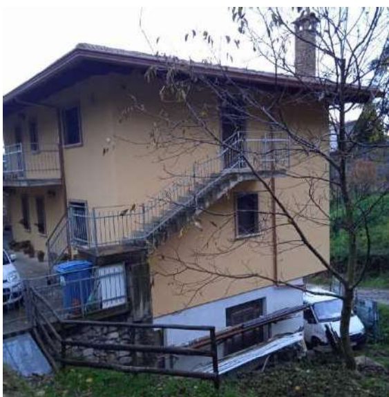
PIANO TERRA E PIANO PRIMO LATO OVEST