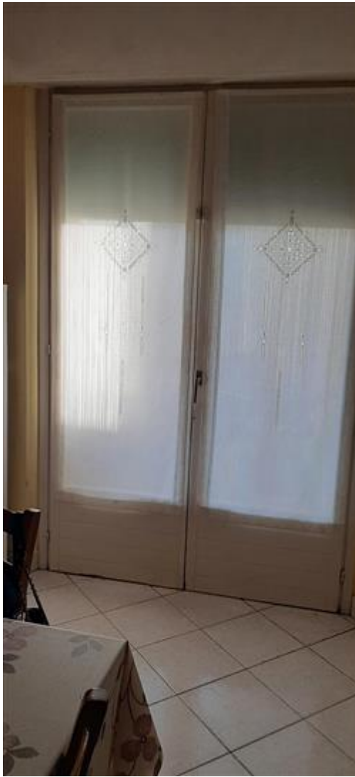
Porta-finestra del soggiorno