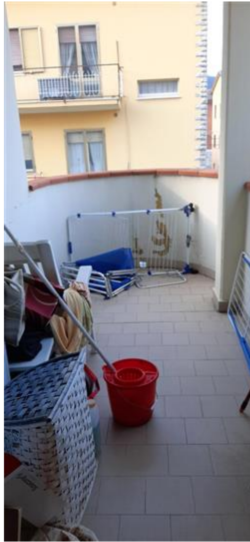
terrazzo camera matrimoniale