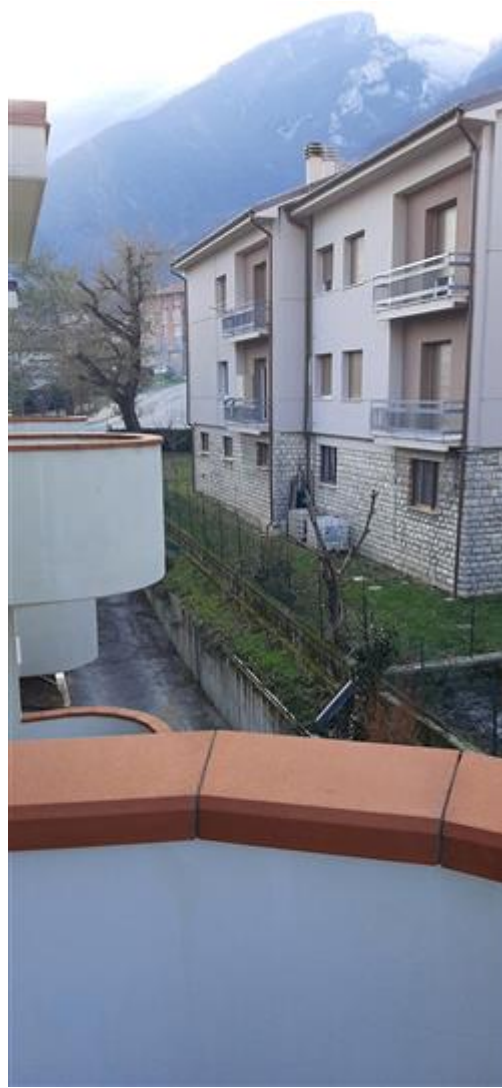
vista panoramica dal terrazzo posto sul retro