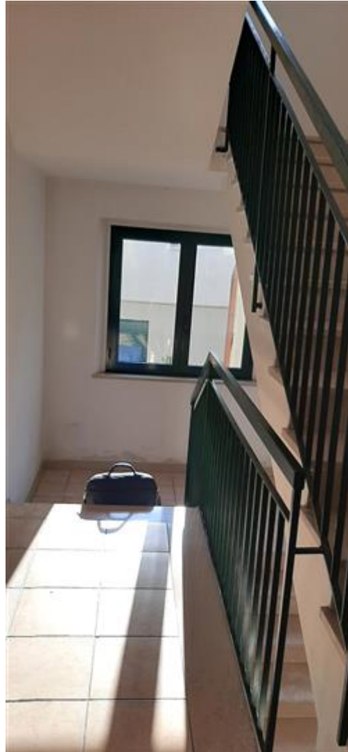
scala interna condominiale