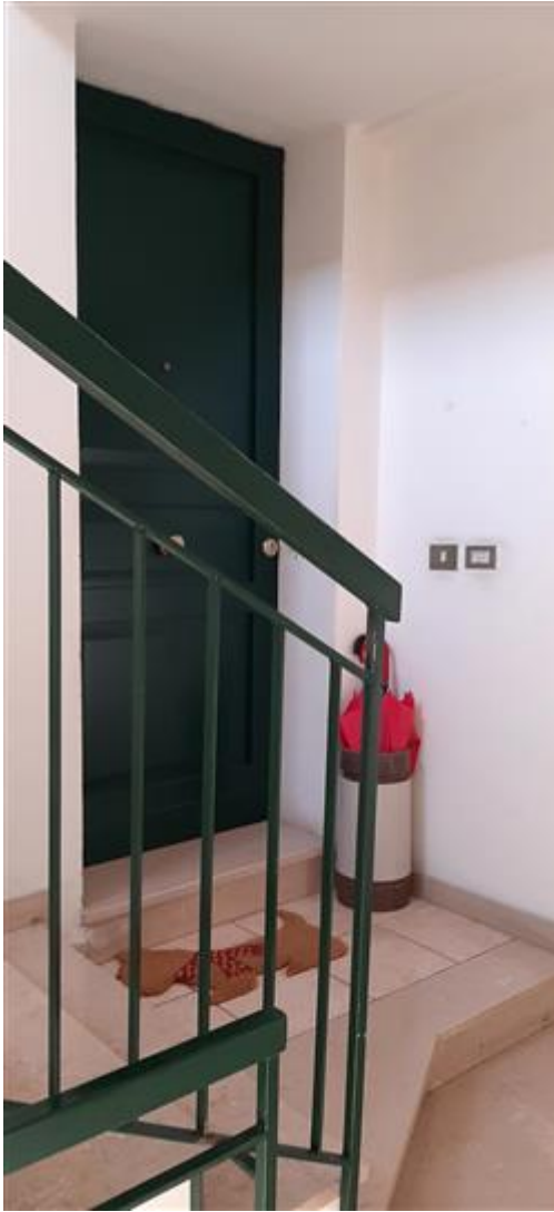
porta d'ingresso dell'alloggio