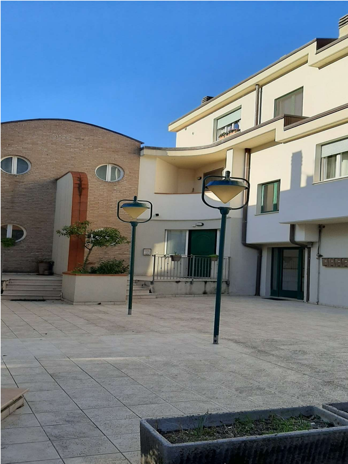
Scoperto condominiale e portone d'ingresso.