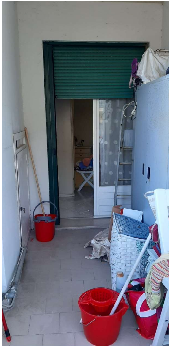
Terrazzo con ingresso dalla camera matrimoniale