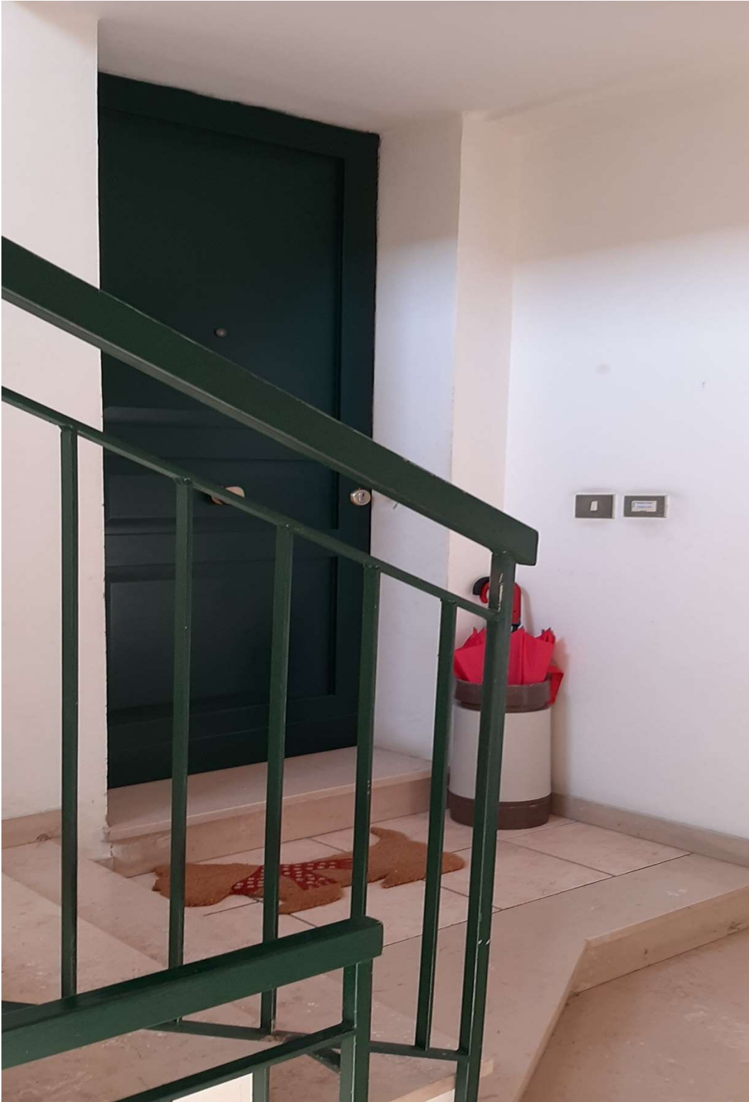
Porta d'ingresso esclusiva e interna