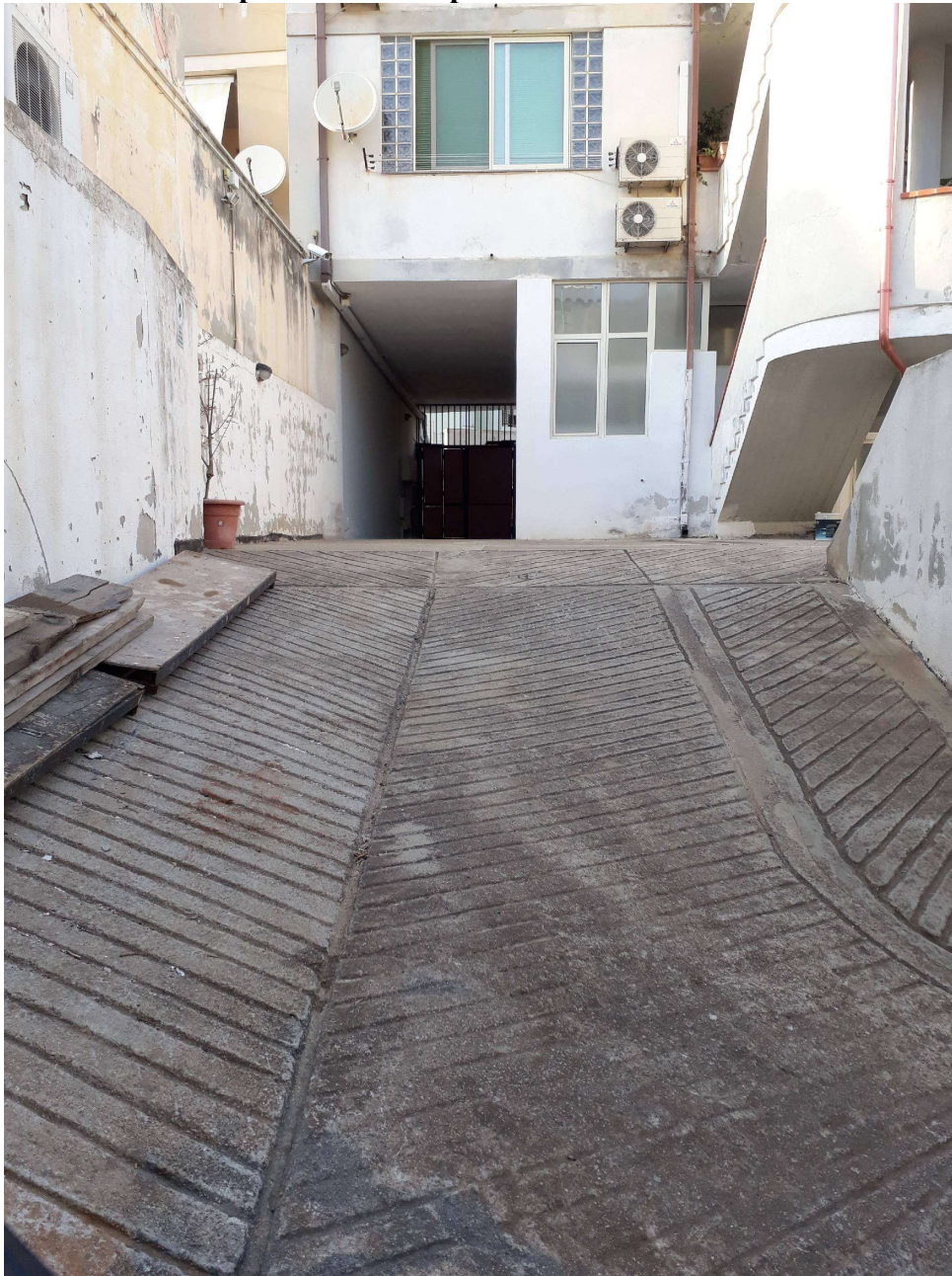
Foto 3: Particolare della rampa di accesso al piano seminterrato.