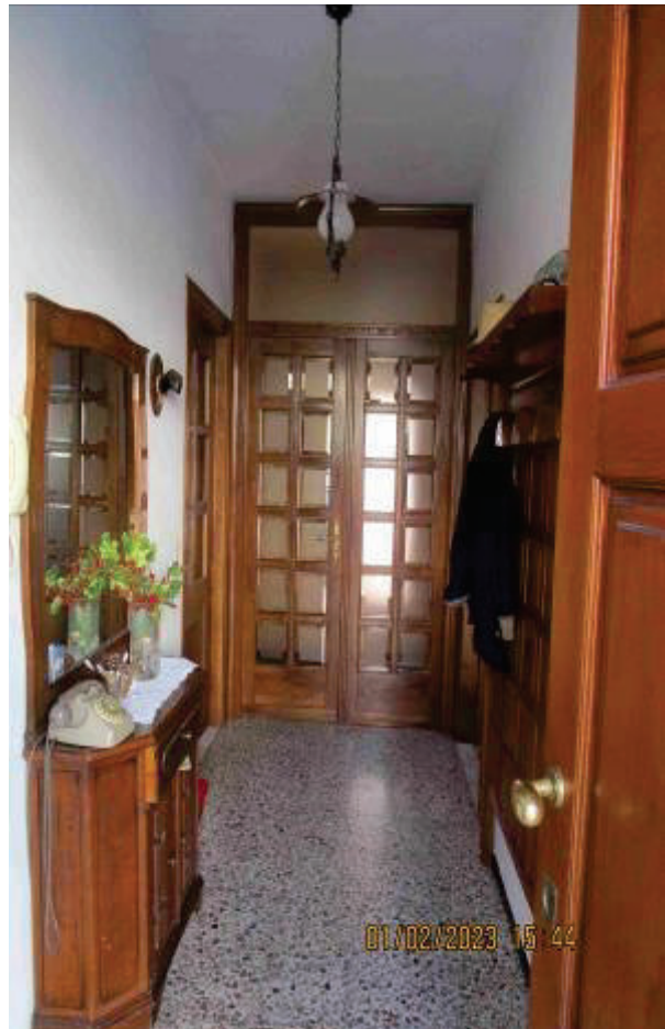
Ingresso su corridoio