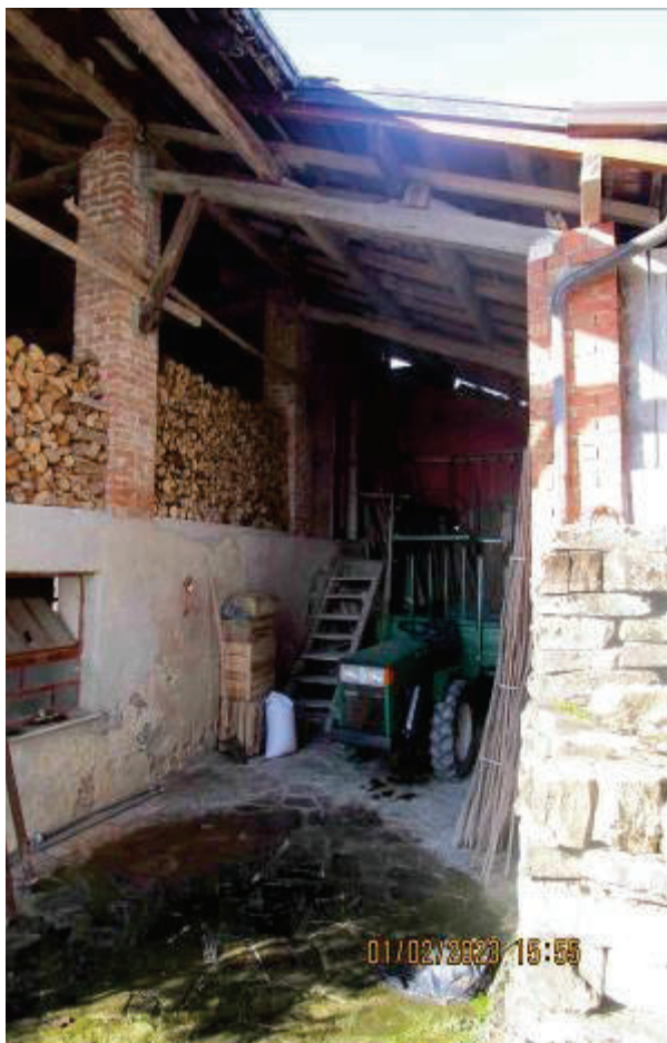
Deposito e cassero legnaia sub. 2