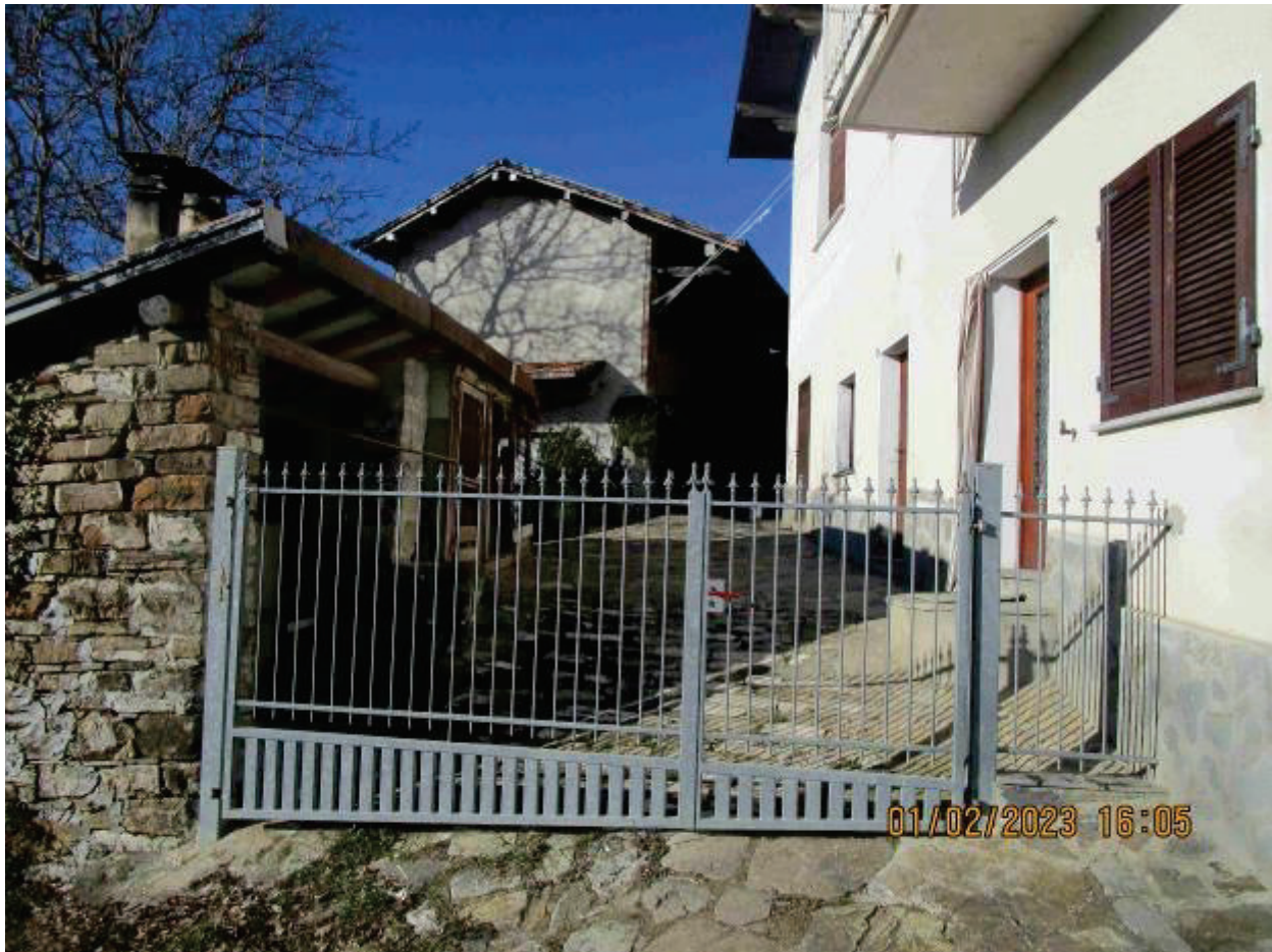
Secondo accesso al cortile