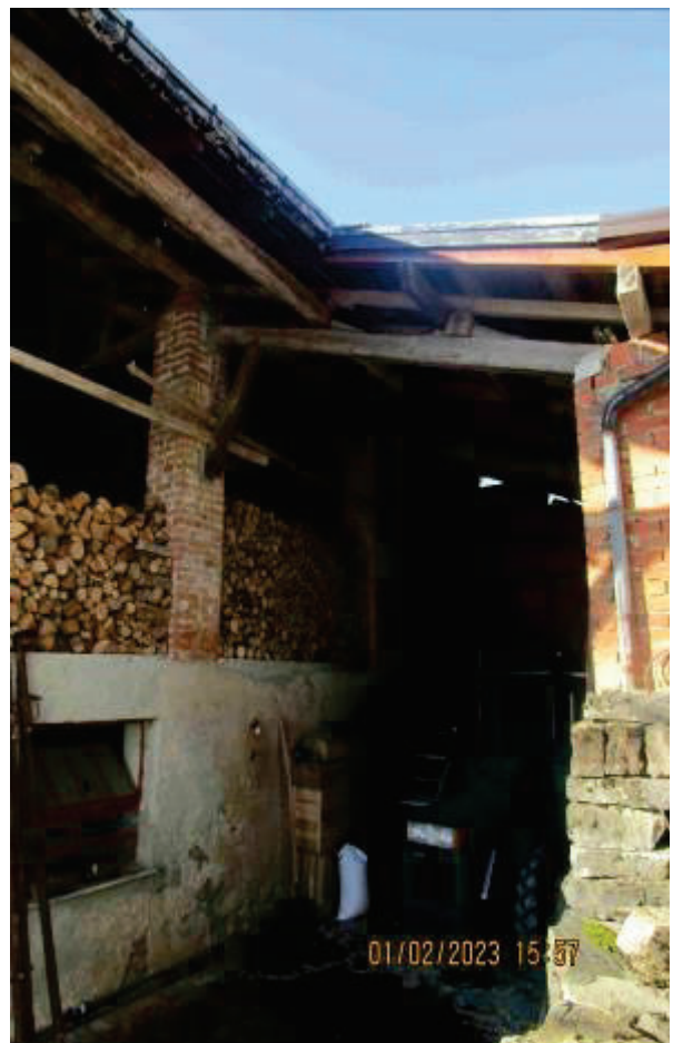
Cassero legnaia e tettoia sub. 2