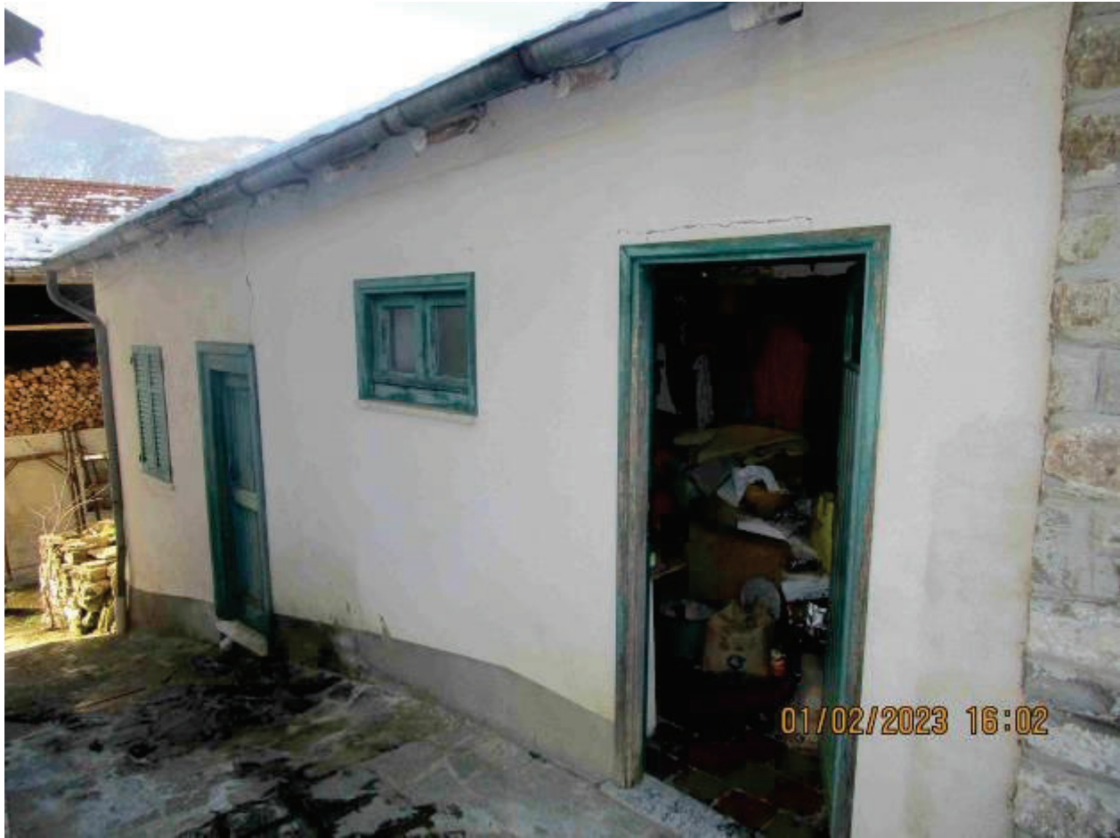
Locali accessori esterni