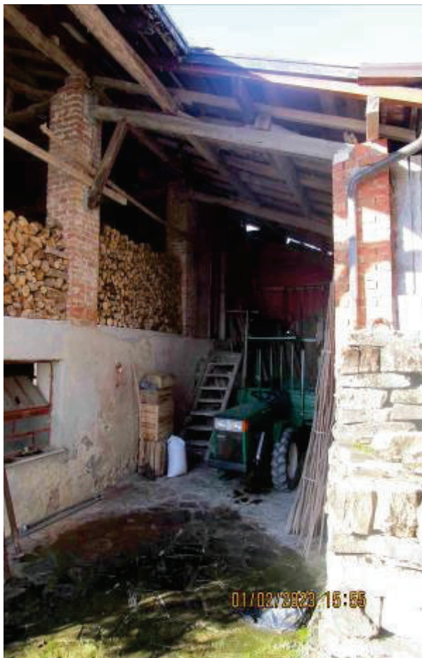
Cassero legnaia e tettoia