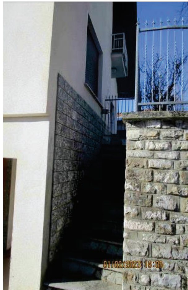
Scala di accesso da strada al cortile