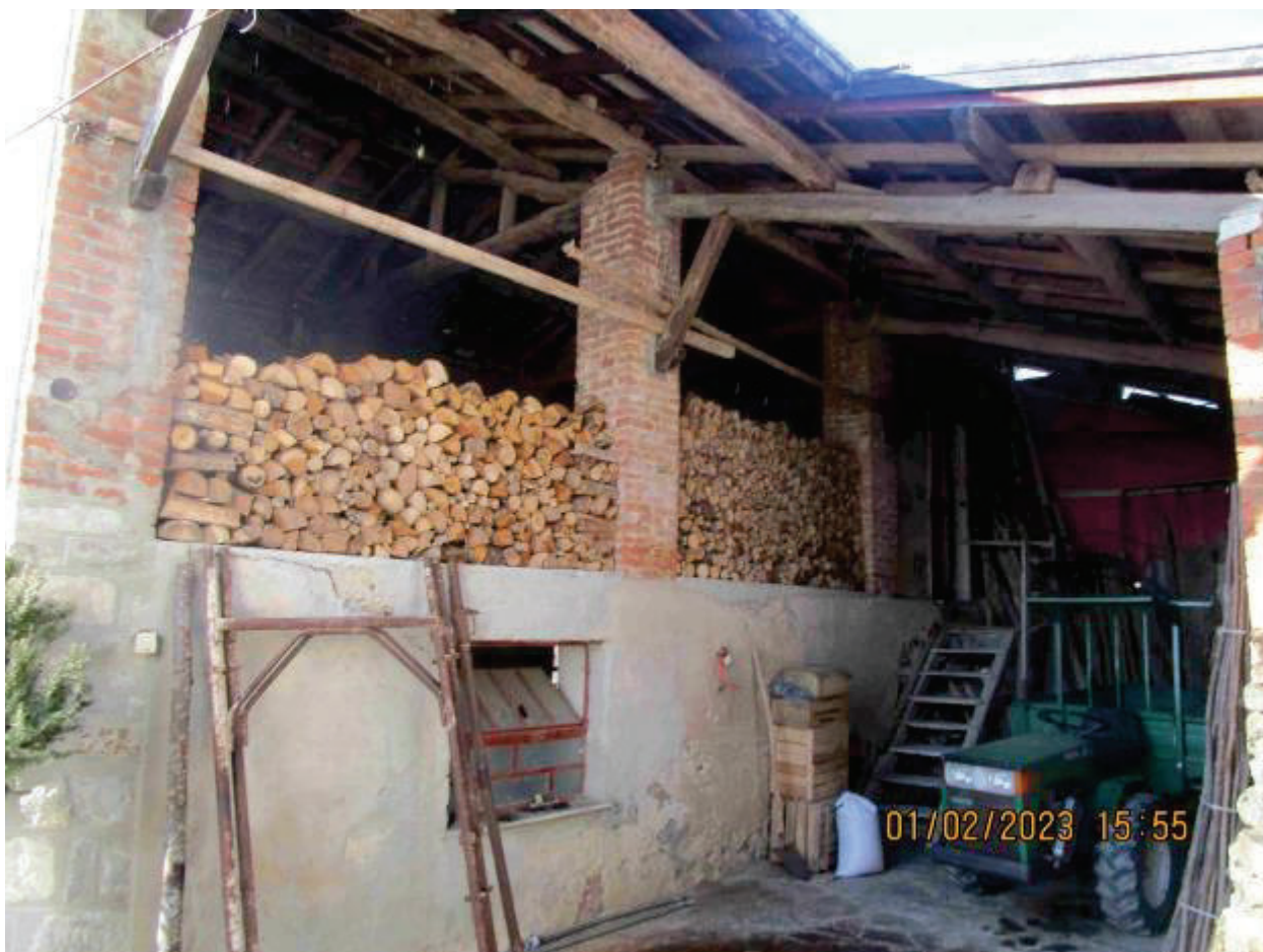
Cassero legnaia e tettoia