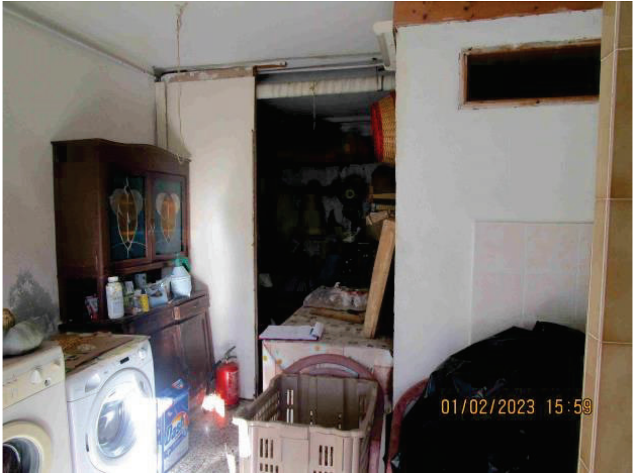
Locali accessori 1PS