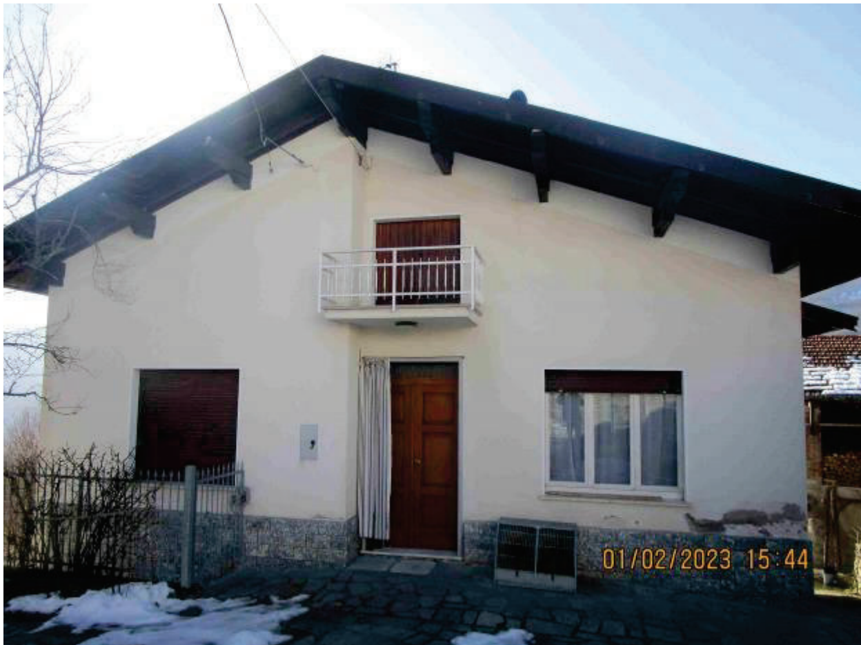
Prospetto principale abitazione lato Est