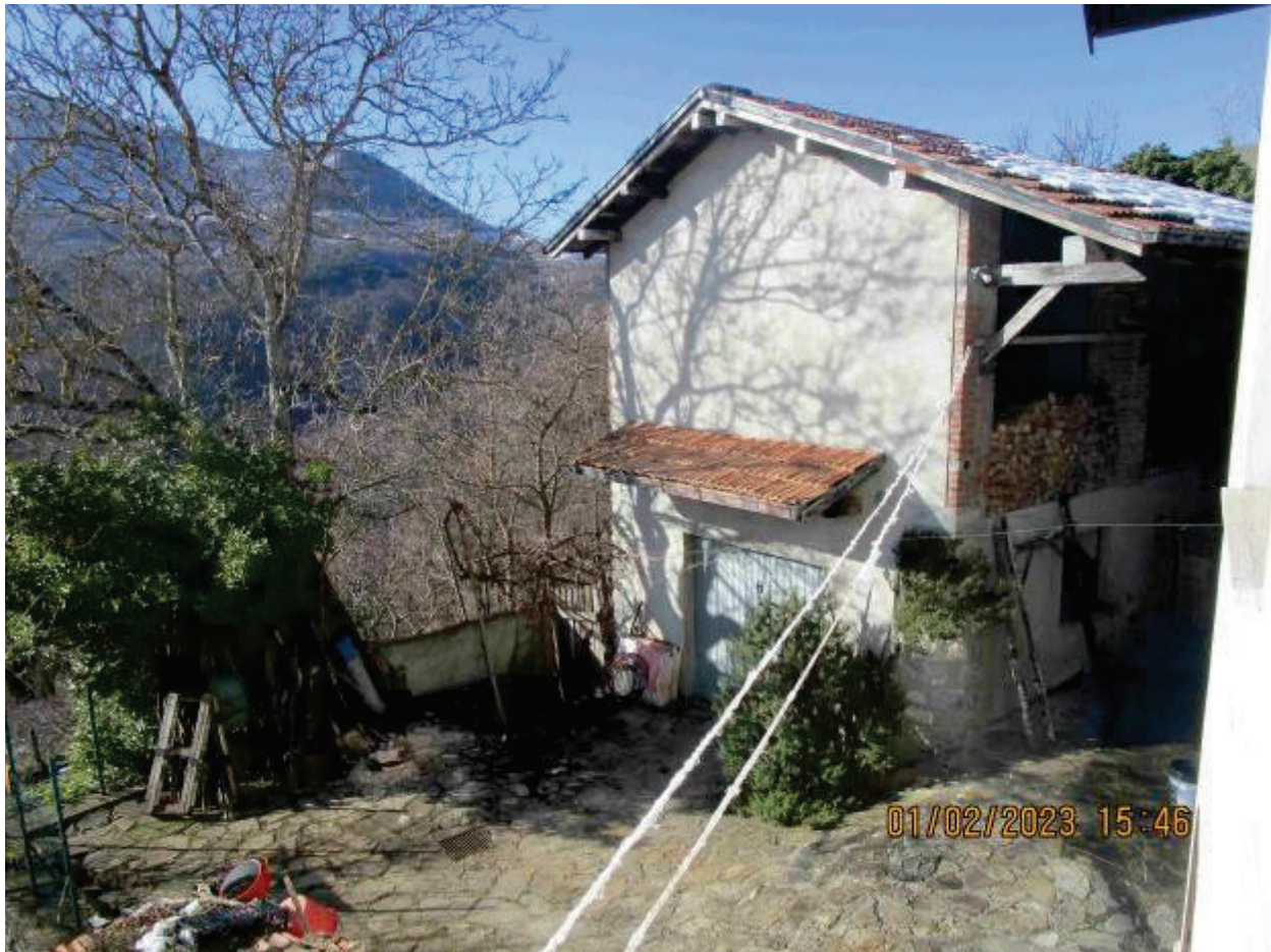
Deposito e cassero legnaia sub. 2