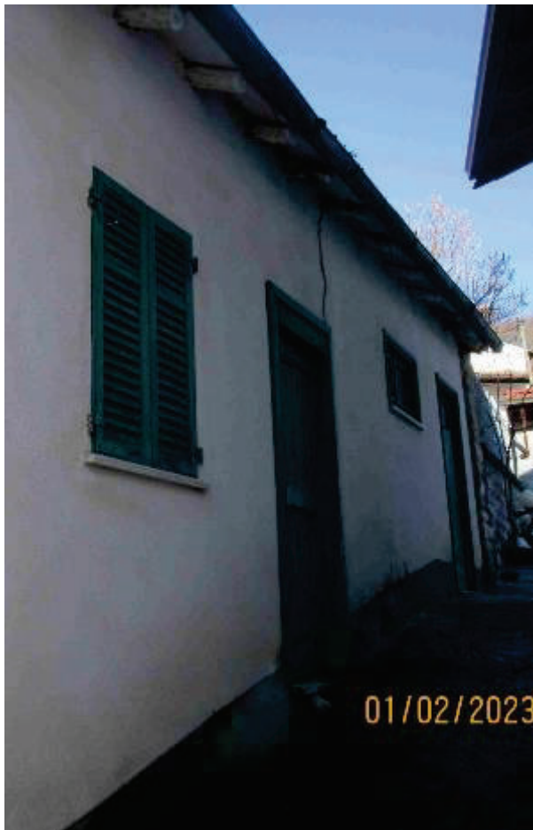
Locali accessori esterni