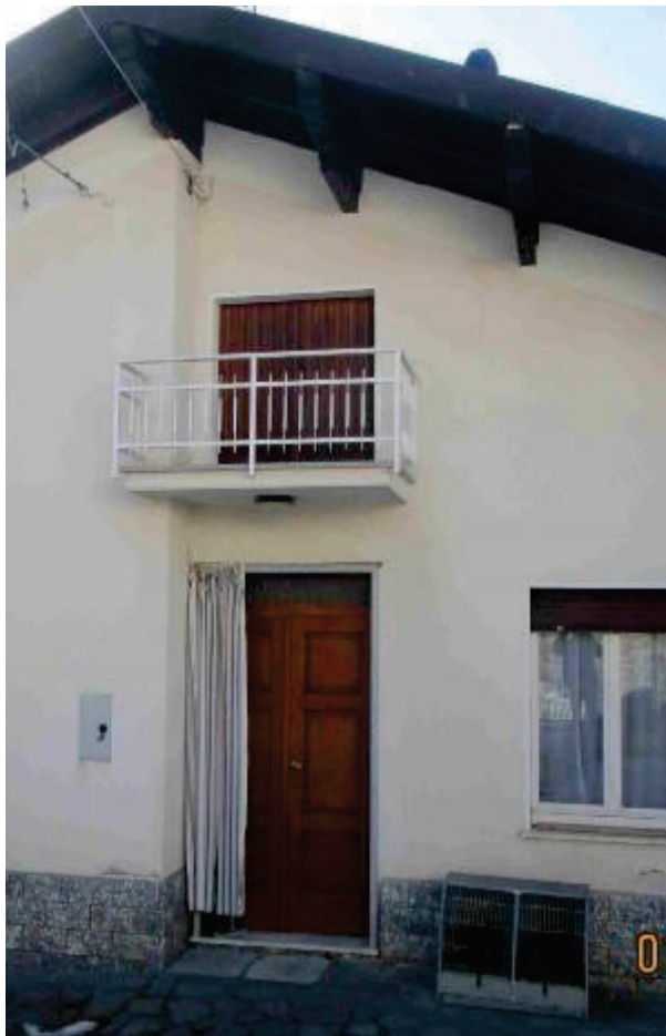
Accesso dal cortile