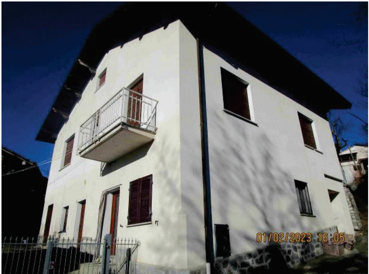
Prospetto secondario lato Ovest e Sud