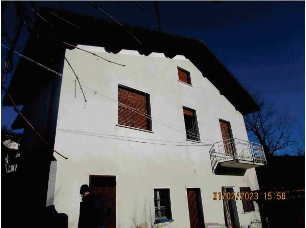
Prospetto secondario lato Ovest