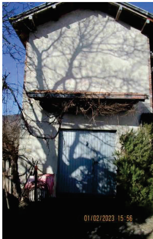
Deposito e cassero legnaia sub. 2