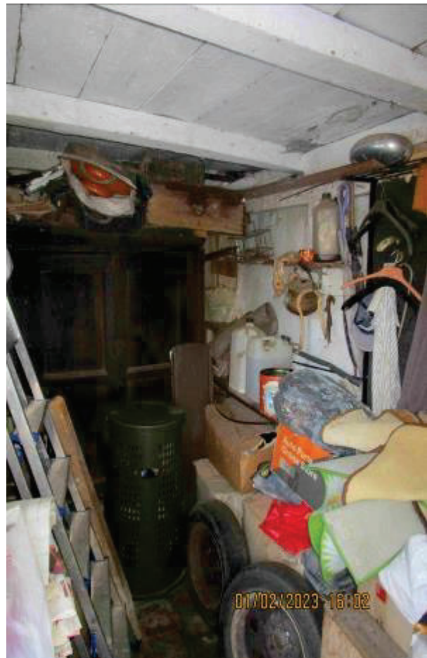
Locali accessori esterni