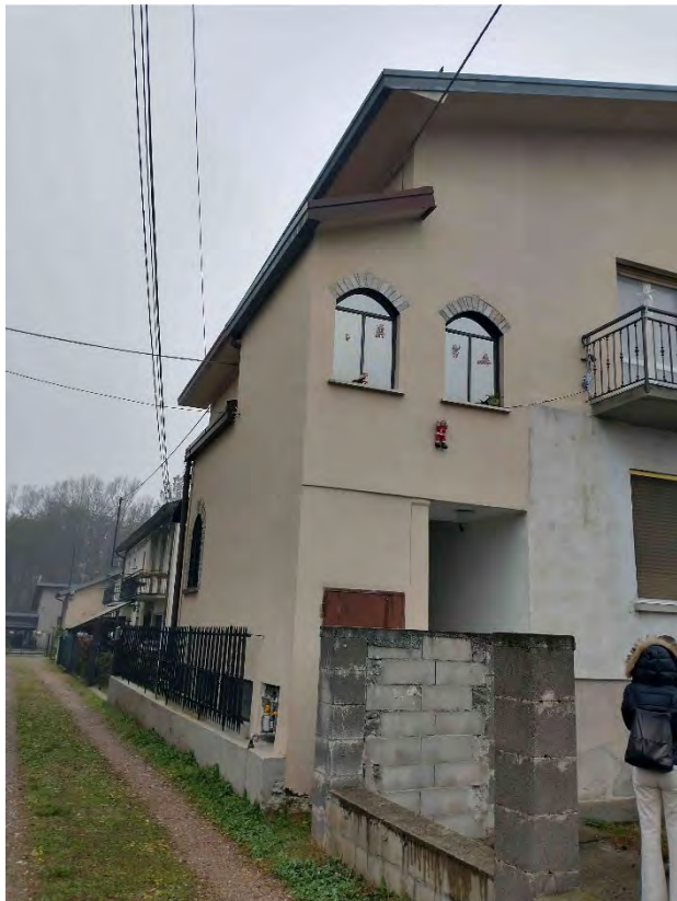
Vista esterna- lato Sud-Est