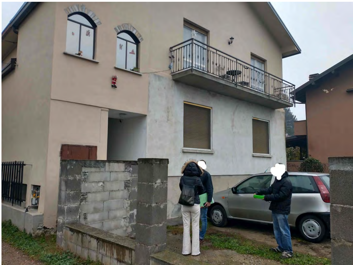
Vista esterna – facciata principale (ingresso e giardino)