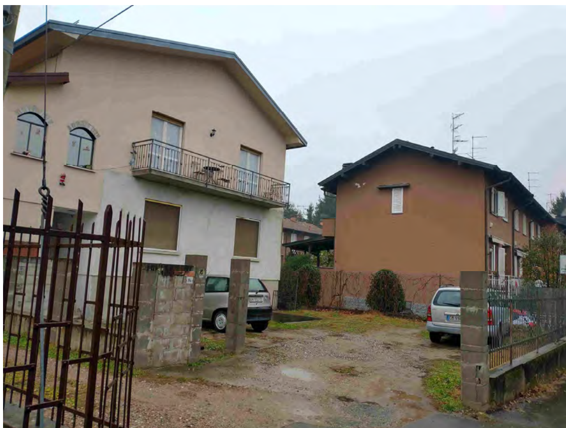
Vista esterna – accesso carroia e pedonale su giardino