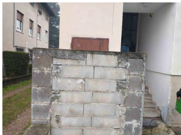
Dettaglio nicchia esterna