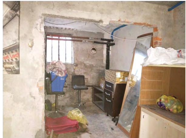
Locale caldaia P.S1