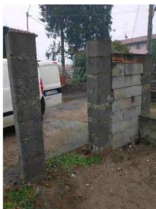
Dettaglio accesso pedonale