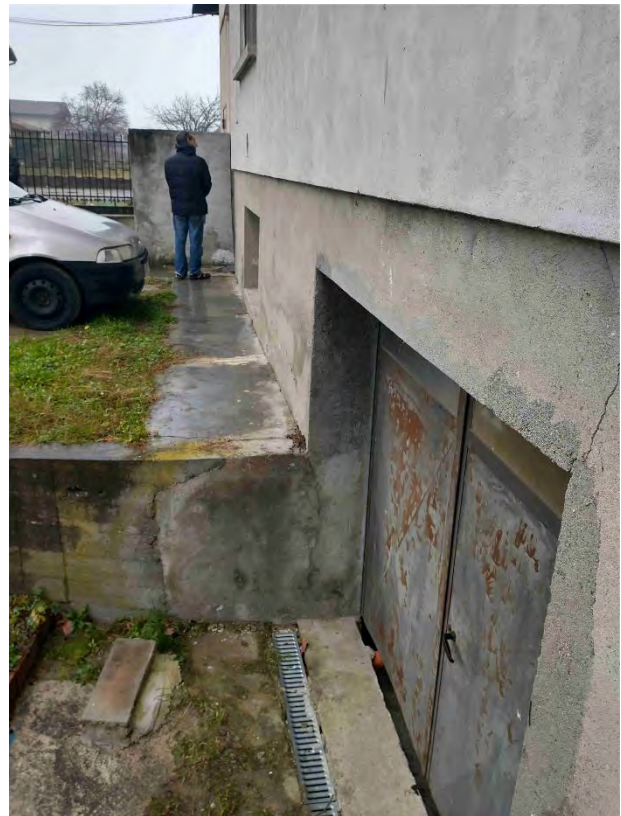
Esterno – accesso alla cantina P.S1