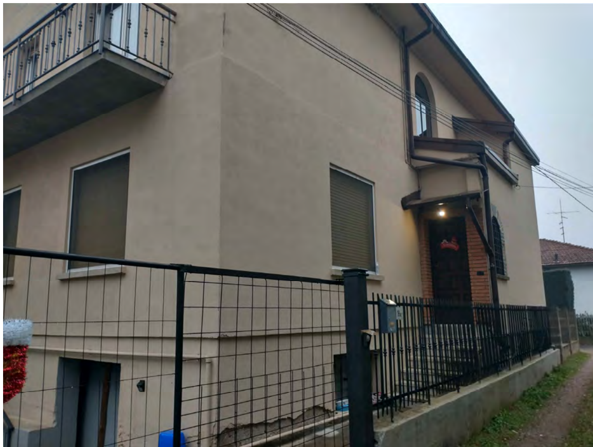
Vista esterna – lato Sud-Ovest (ingresso prop.Sig.Pascalis)