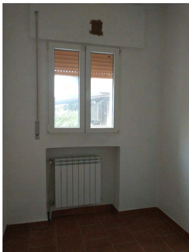
Locale ripostiglio (ex vano scala) P.1