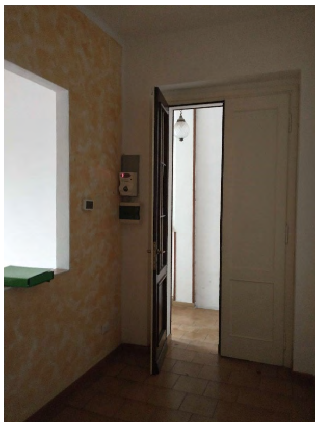
Ingresso – P.1