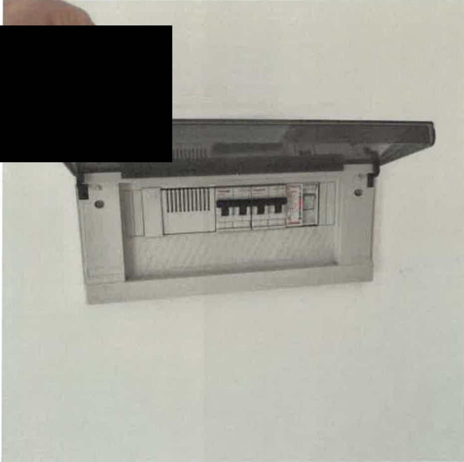
5: IMPIANTO ELETTRICO