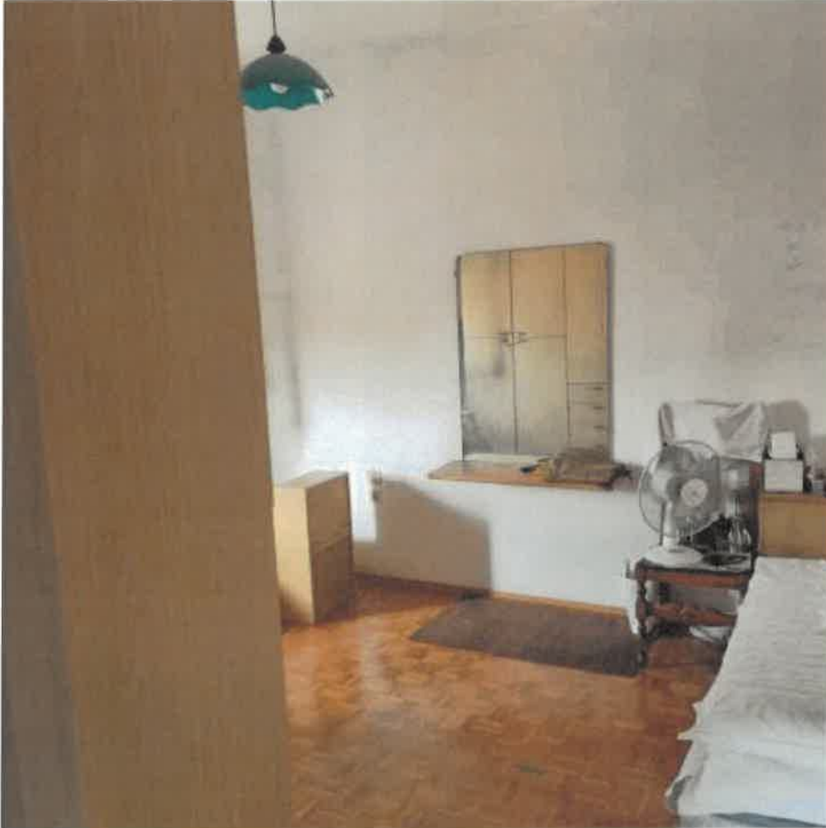
16: CAMERA 2