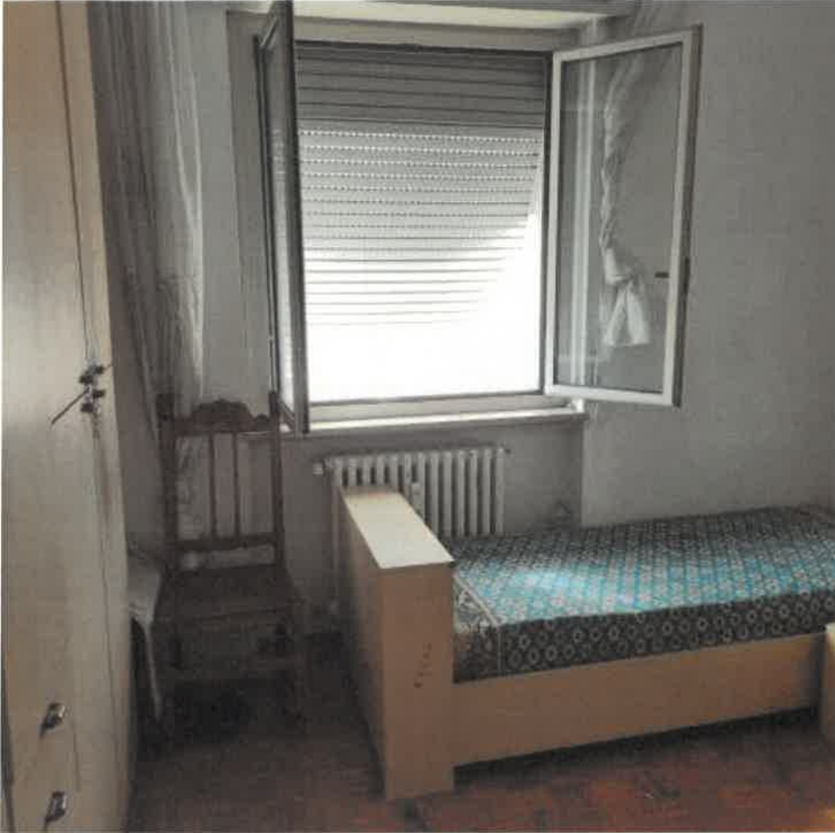
6: CAMERA 2