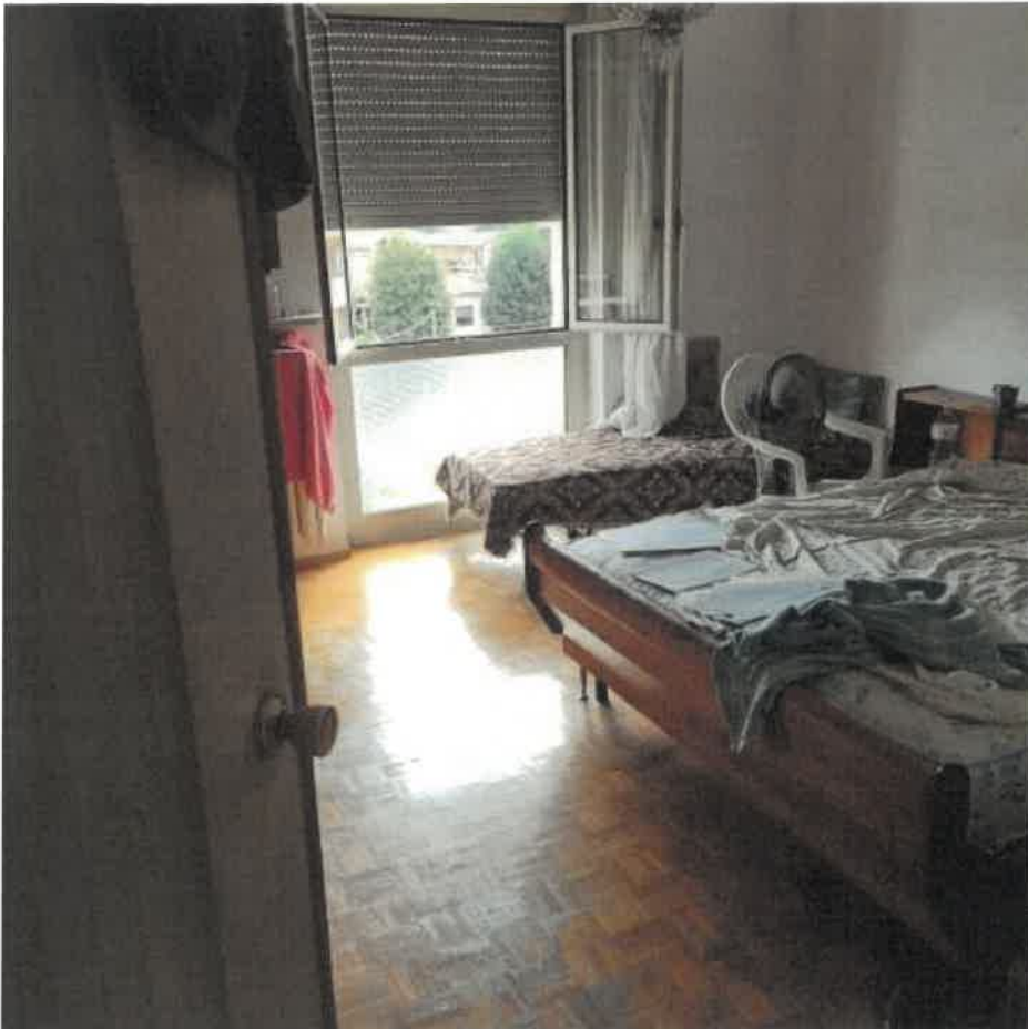
5: CAMERA 1