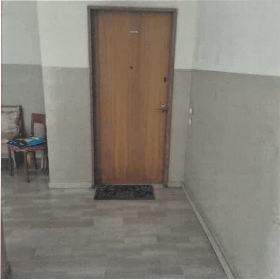
3: PORTA INGRESSO – LATO VANO SCALA