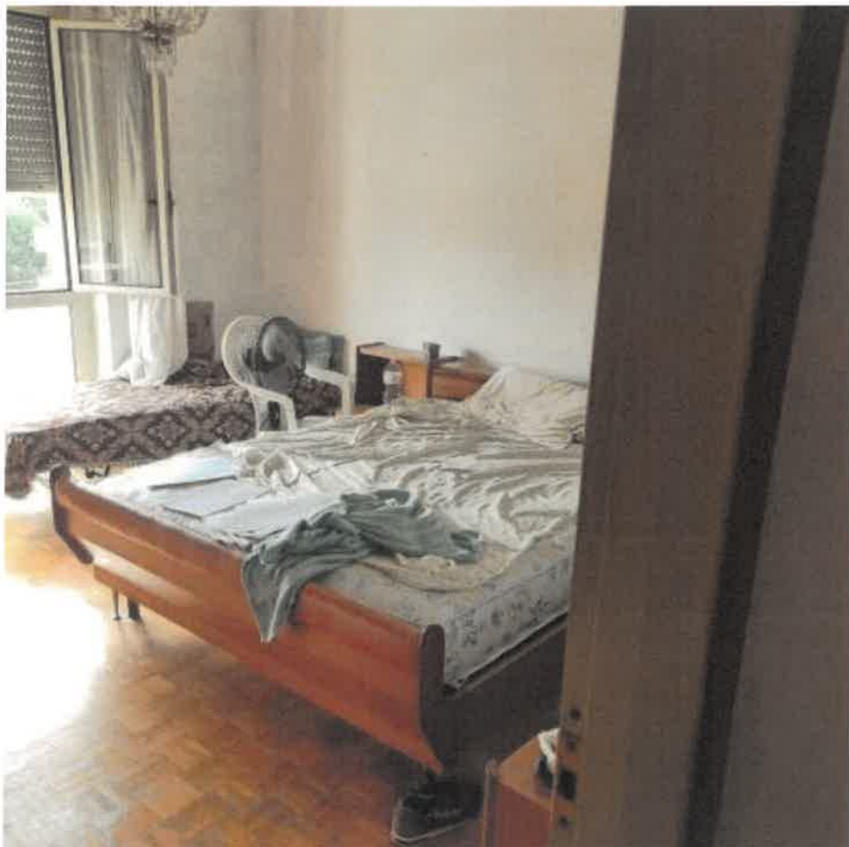
4: CAMERA 1