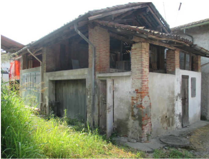
lato nord –ovest – box e bagno2