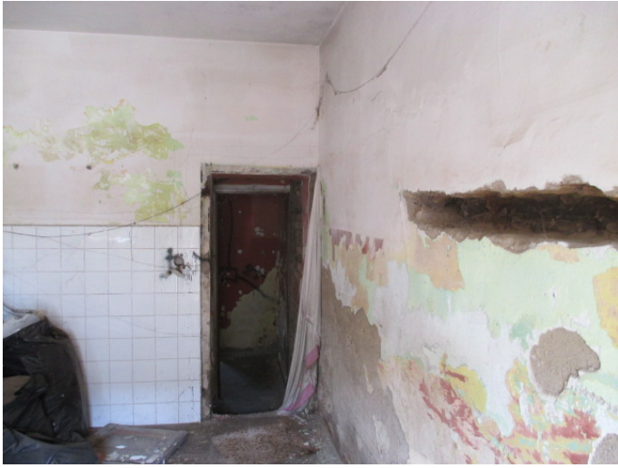
camera 1 - PT