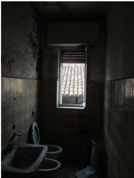
bagno 1 – P1