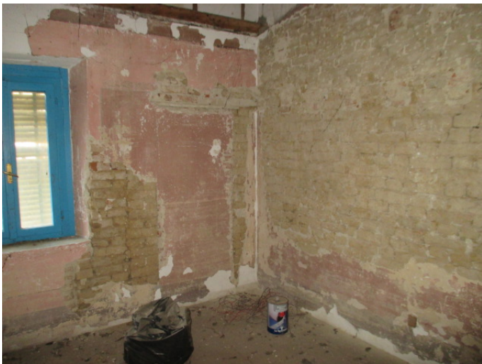
camera 3 - P1