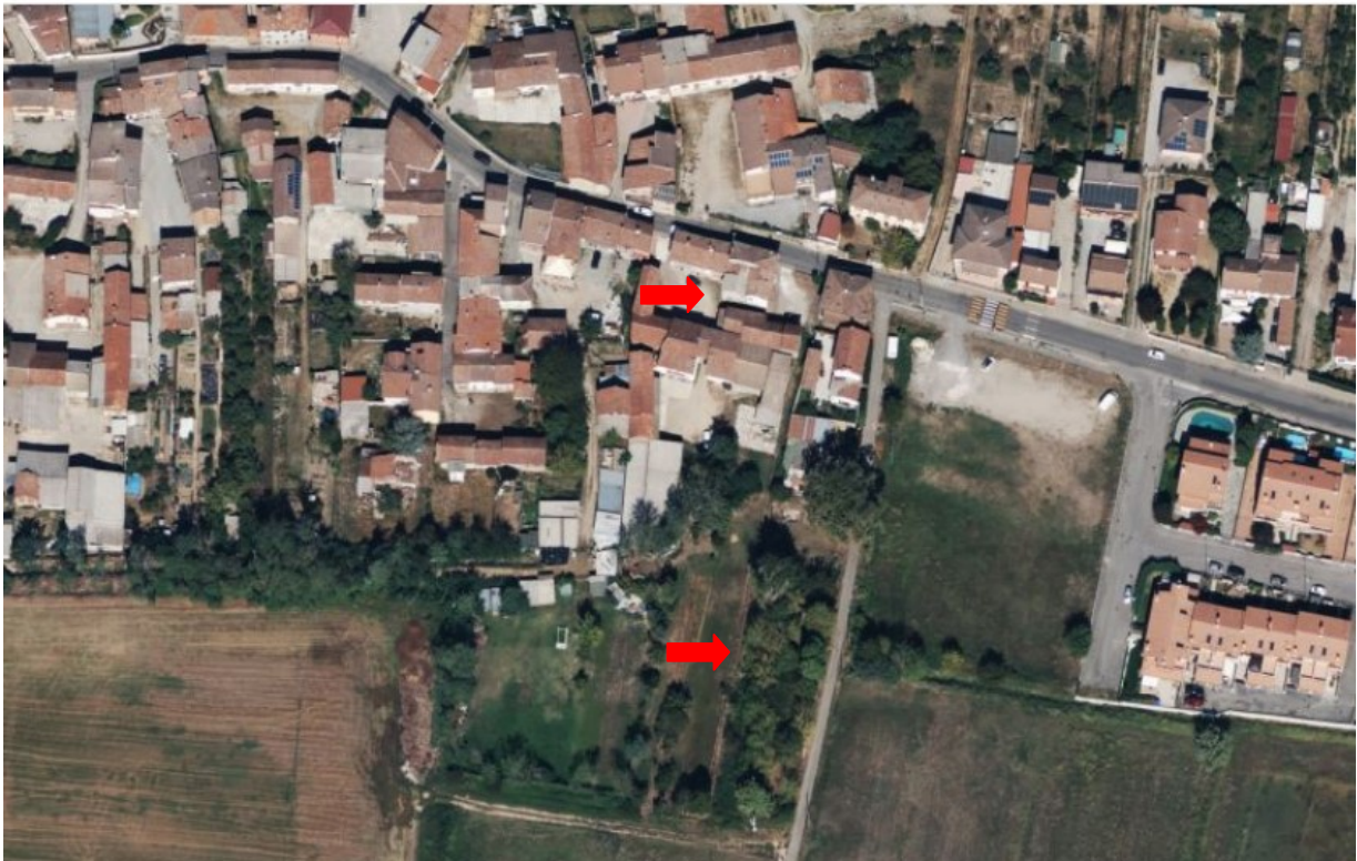
Vista dall'alto di tutti gli immobili