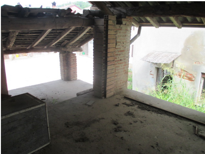
legnaia 1 e 2 - P1