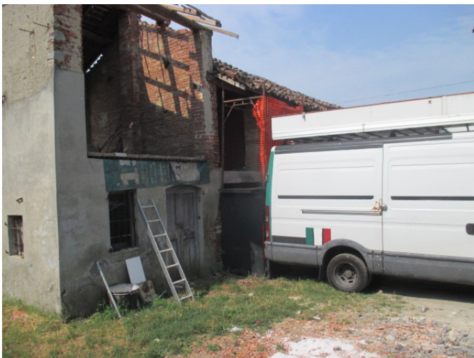
lato nord - ripostiglio