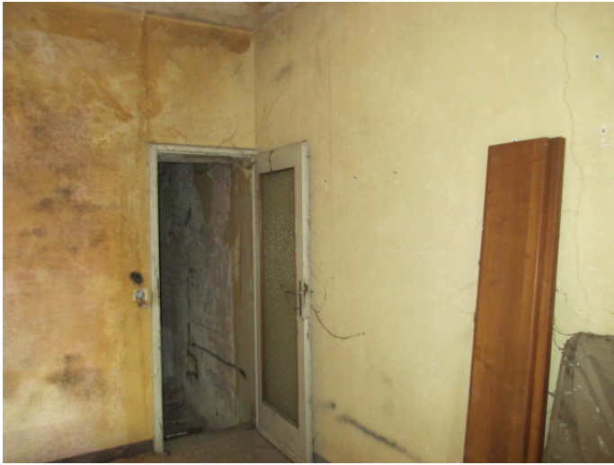
camera 2 – P1