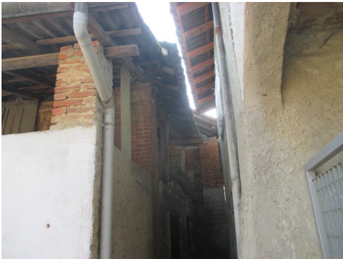
lato sud – box