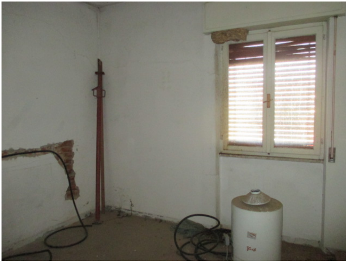
camera 4 – P1