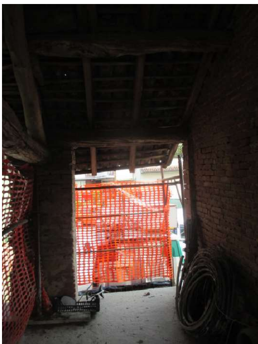
legnaia 3 P1