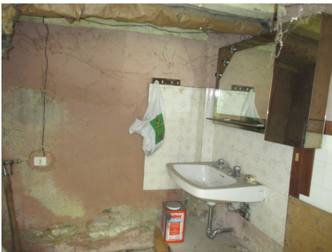
bagno 2 PT