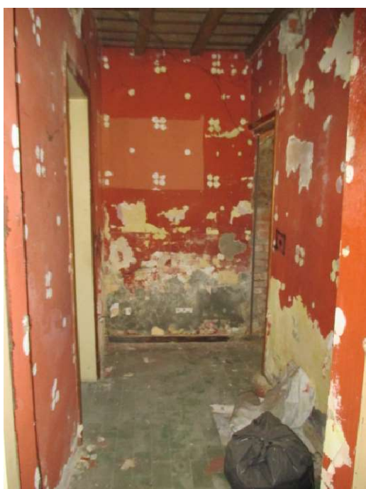
disimpegno - PT