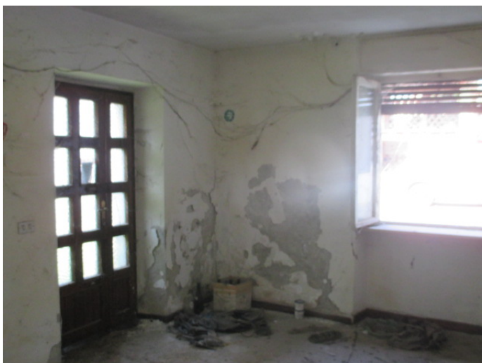
soggiorno - PT