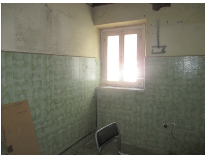
cucina - PT