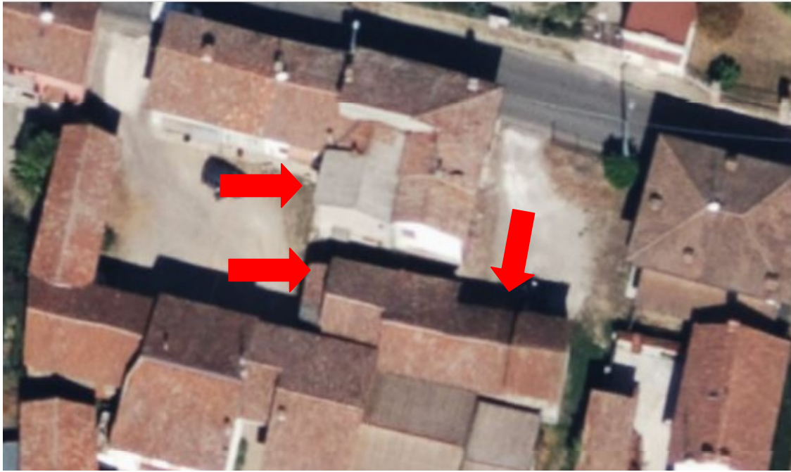
Vista dall'alto di abitazione, locali accessori e box