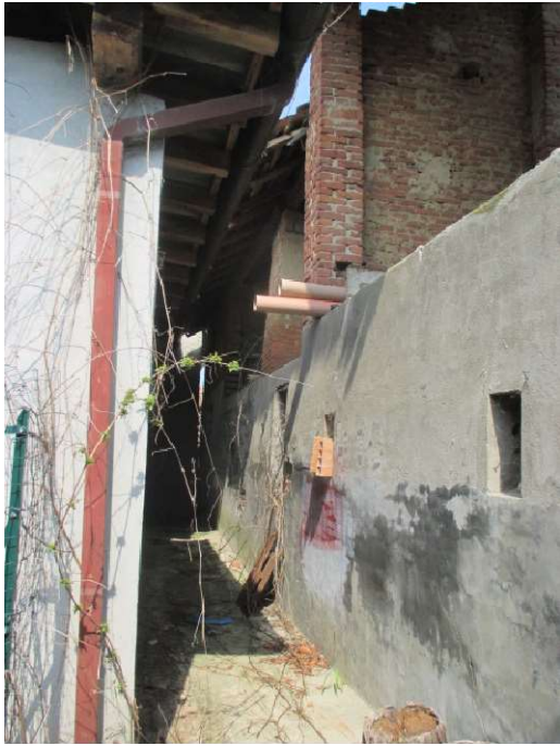
lato sud - ripostiglio