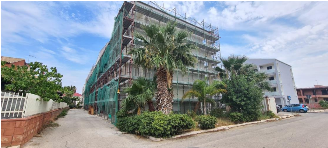
LATO NORD-EST ACCESSO BOX