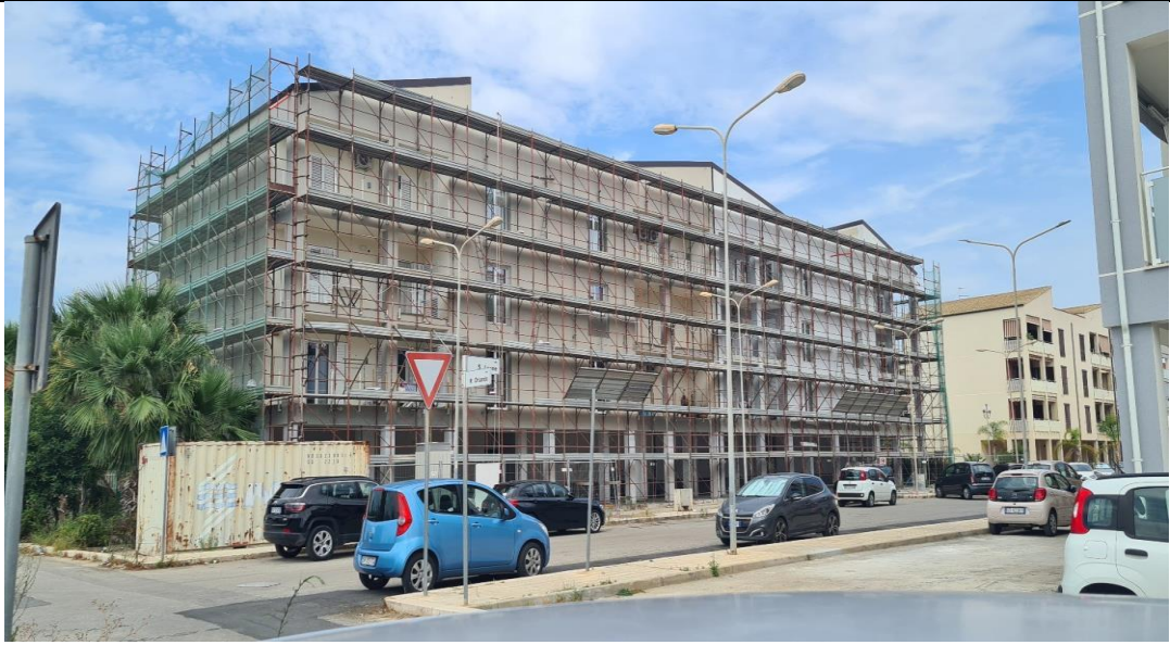
LATO SUD-OVEST INGRESSO APPARTAMENTO