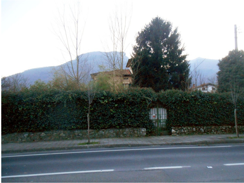
1 - Veduta dei beni oggetto di stima ripresa dalla via della Repubblica: lo sviluppo della vegetazione del giardino impedisce di vedere l'abitazione