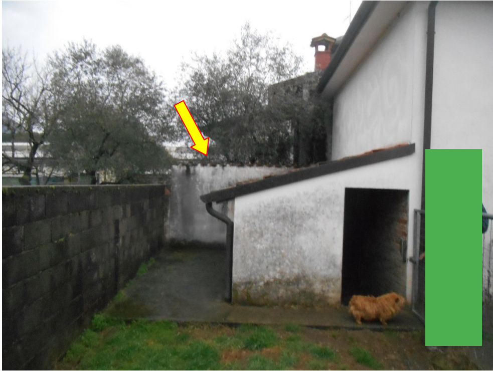
7 - veduta dei due "canili" che occupano la parte sud ovest del fabbricato mappale 622: in secondo piano, indicato dalla freccia gialla, il manufatto nel possesso di terzi da oltre venti anni che occupa circa 4 m 2 di superficie del mappale 622 e circa 3 m 2 di superficie del mappale 621