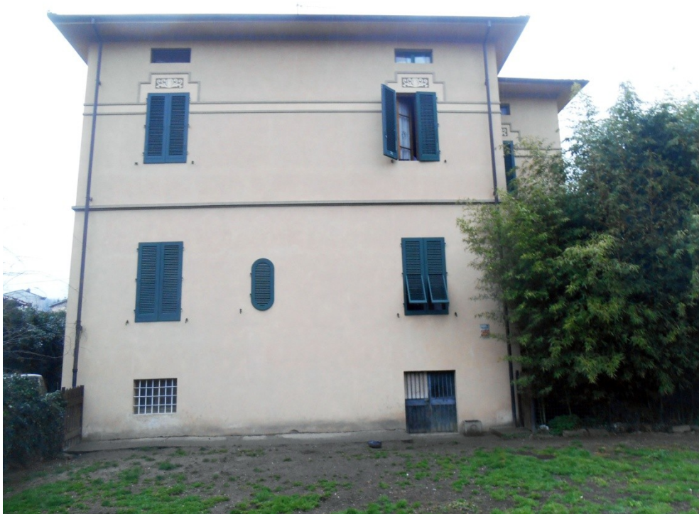
4 - Veduta della facciata posteriore, lato sud ovest, della villa mappale 621 ripresa dal giardino: in primo piano, il terreno mappale 908