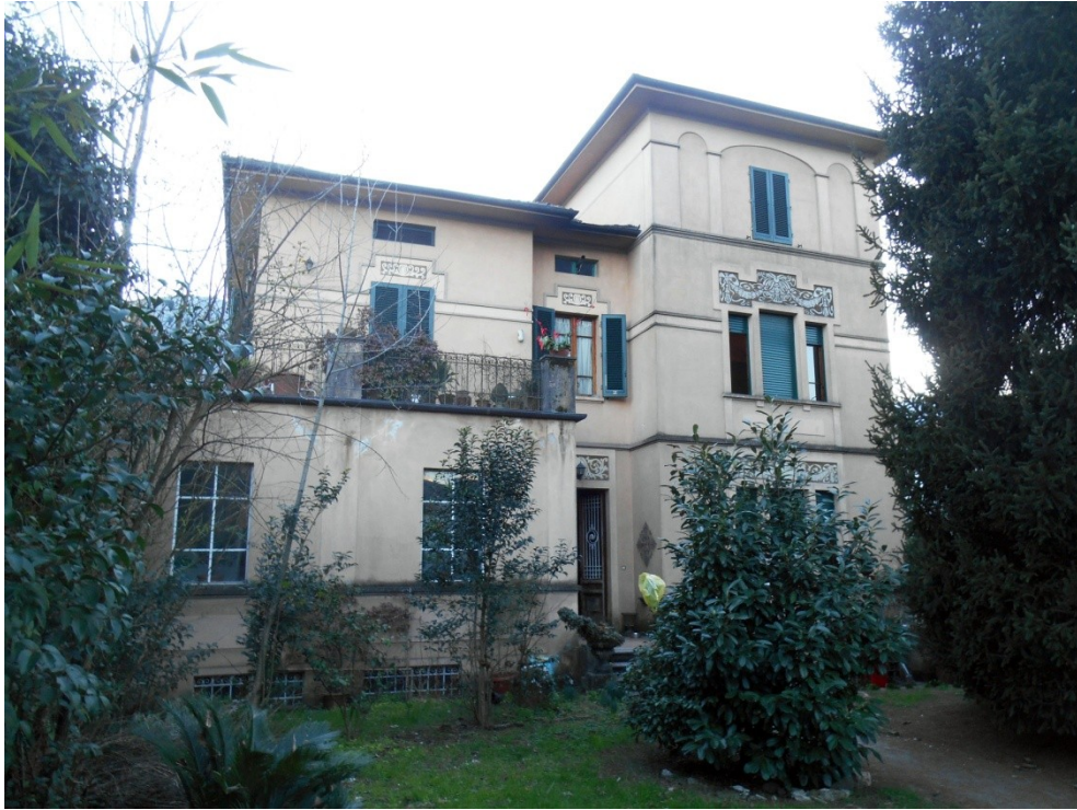
3 - Veduta della facciata principale, lato nord est, della villa mappale 621 ripresa dal giardino