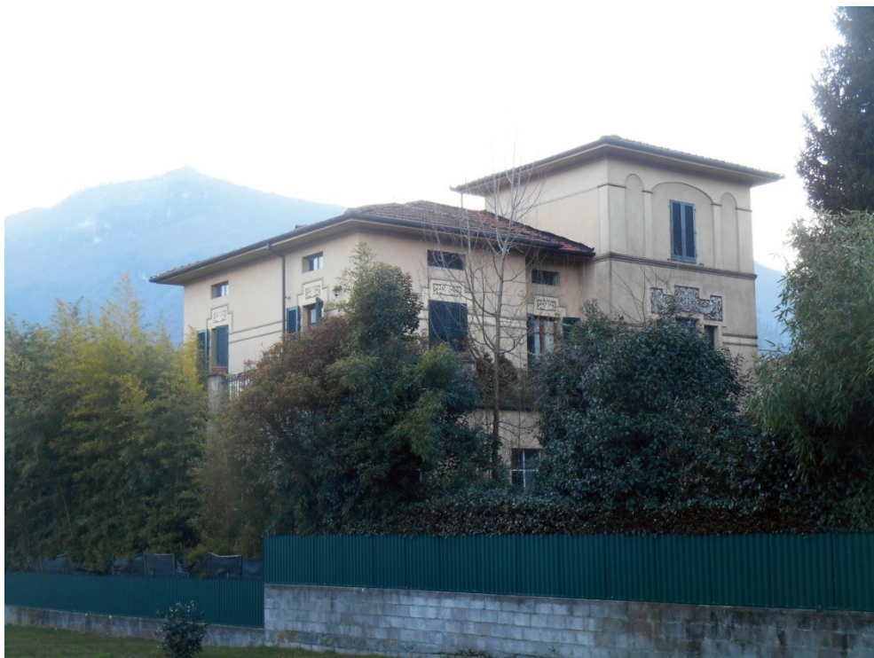
2 - Veduta dei beni oggetto di stima ripresa dalla via della Repubblica, più a sud dell'immagine precedente