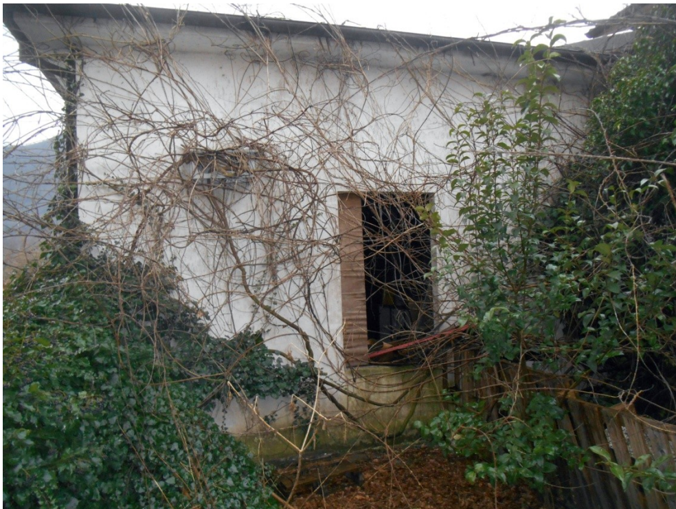
6 - veduta della facciata nord est del fabbricato pertinenziale mappale 622, dove si trovava il portone di accesso all'autorimessa oggi trasformato in finestra