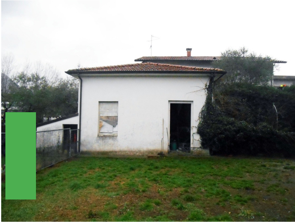
5 - veduta del fabbricato pertinenziale mappale 622, lato sud est: in primo piano il terreno mappale 908