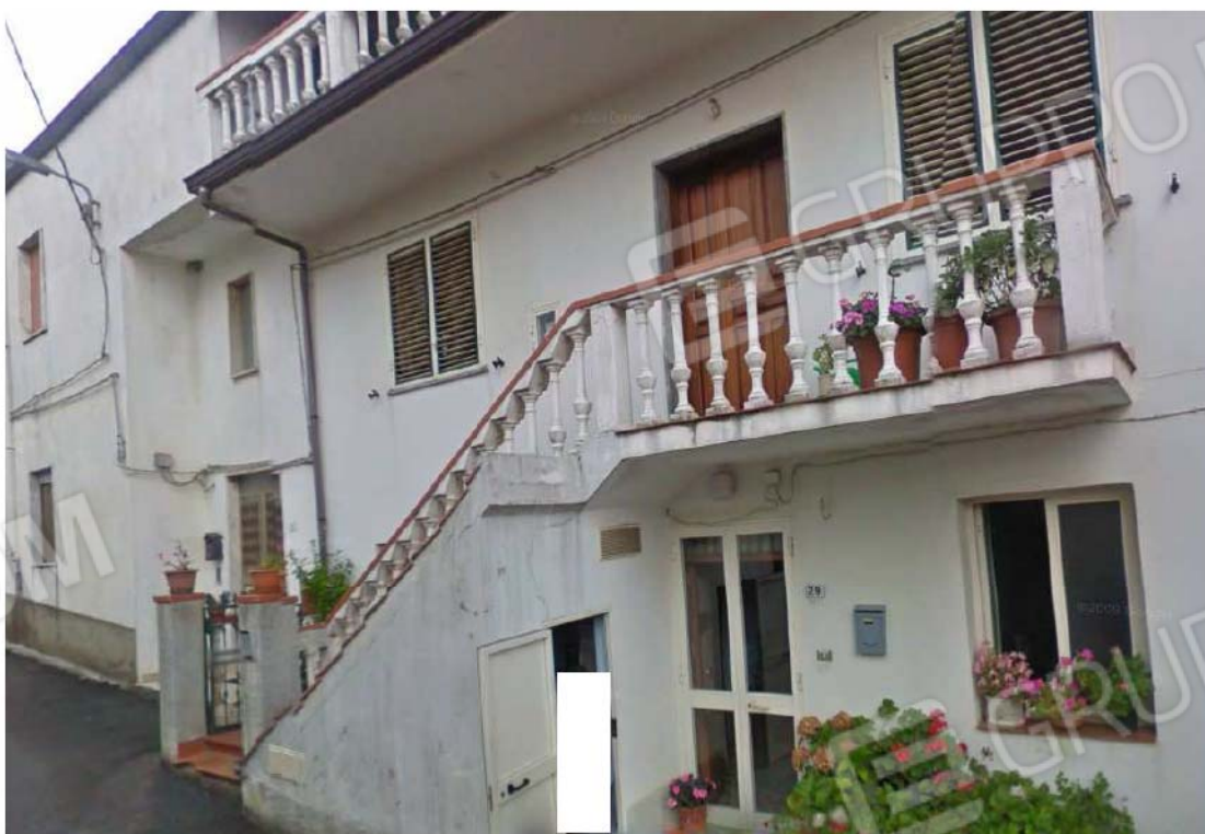
FOTO N° 2 – VISTA FACCIATA PROSPICIENTE IL VIALE GRANDINETTI – INGRESSO PIANO TERRA E PIANO PRIMO