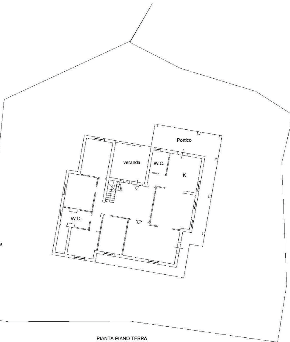
PIANTA PIANO TERRA H=2,75