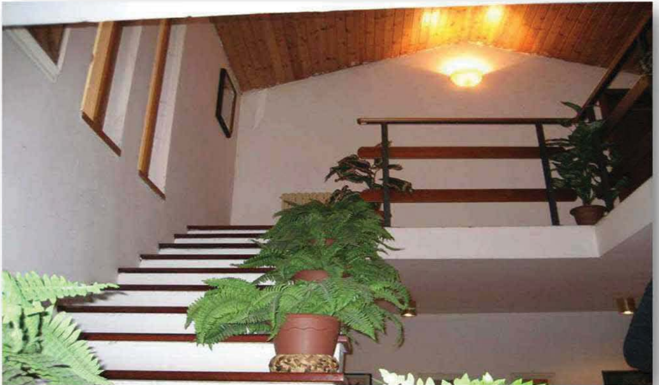
Foto 18 Scale