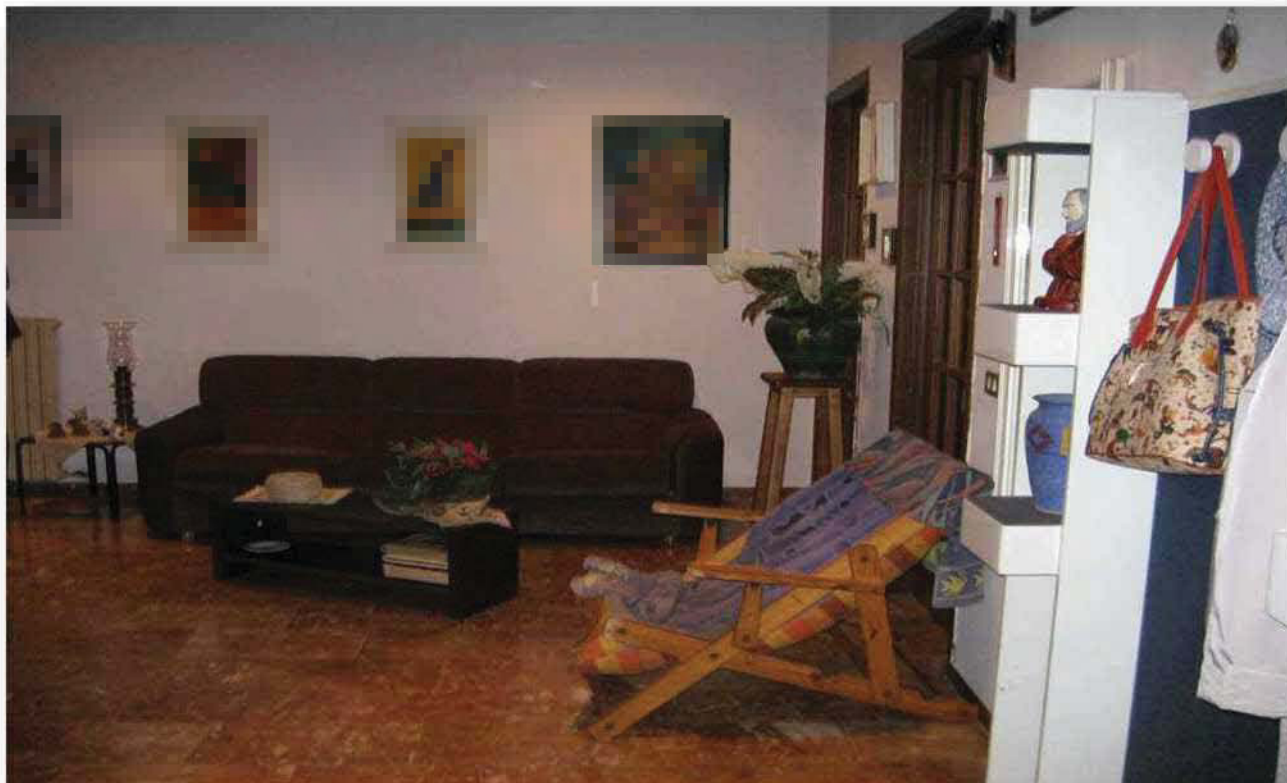
Foto 9 Salone