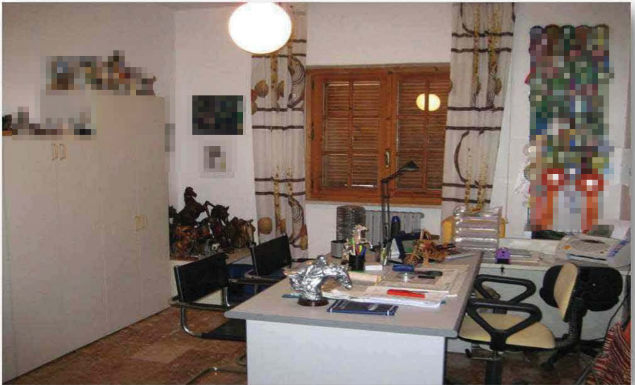
Foto 22 Camera piano sottotetto