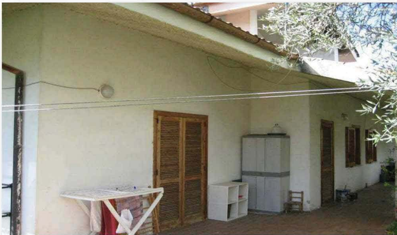
Foto 3 Vista posteriore immobile