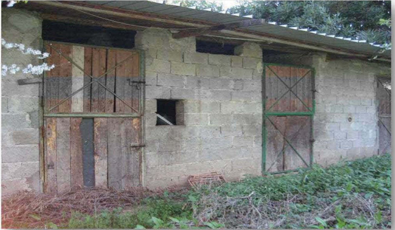
Foto 32 Manufatto sito sul terreno