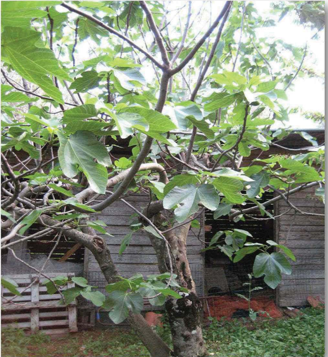
Foto 33 Manufatto sito sul terreno