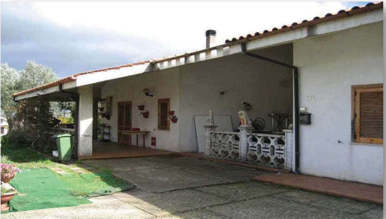
Foto 2 Vista anteriore