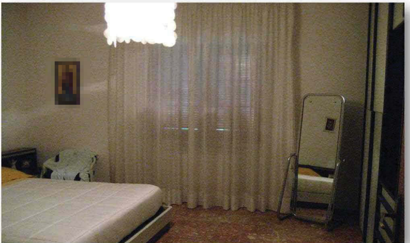
Foto 14 Camera da letto piano terra