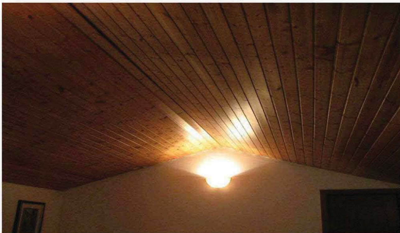
Foto 27 Particolare copertura tetto