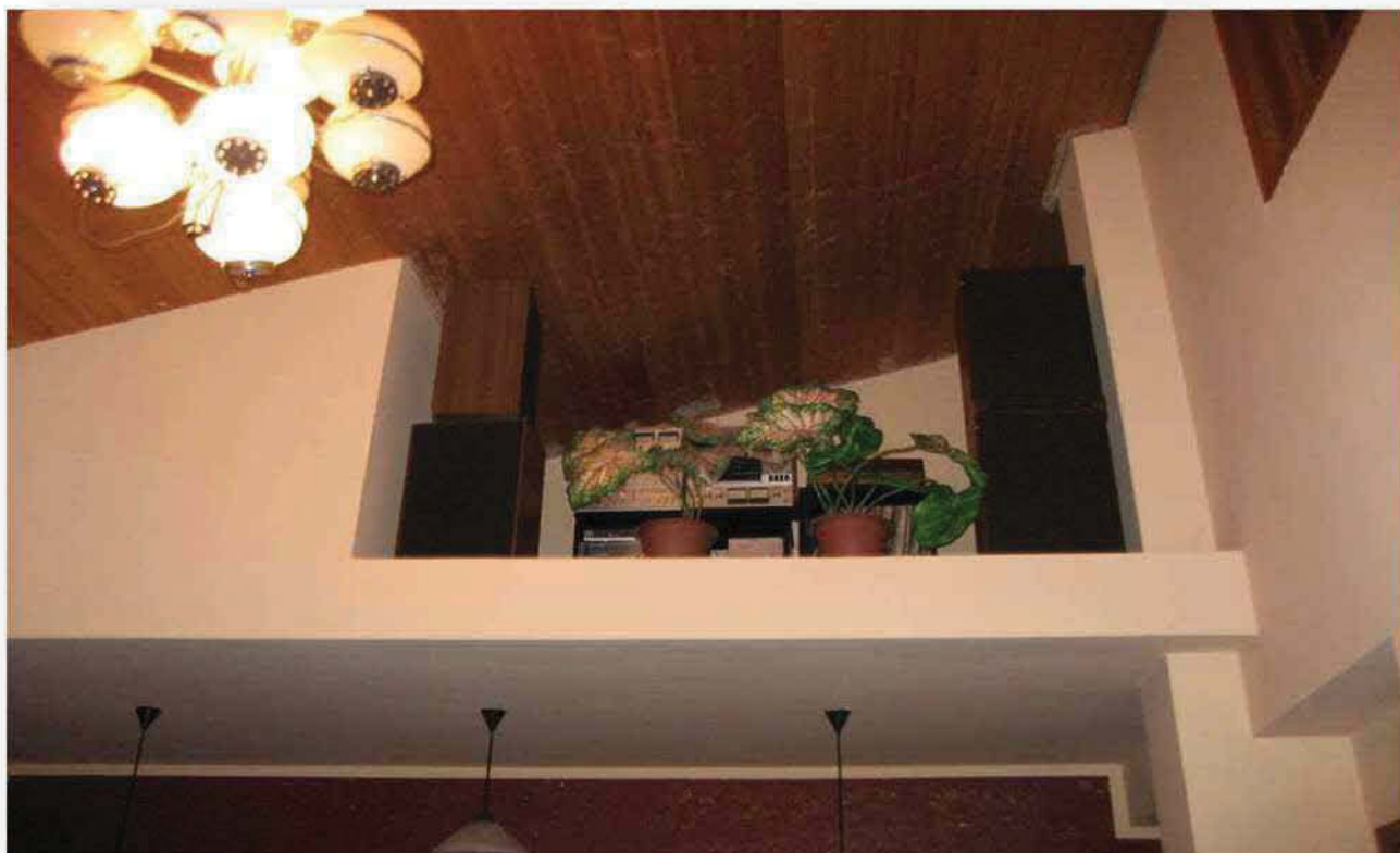
Foto 10 Particolare controsoffitto