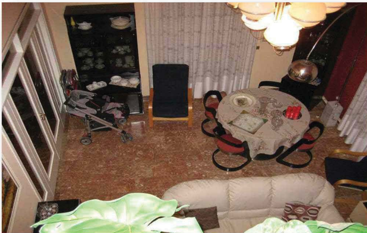
Foto 26 Vista dall'alto sul salone-sala da pranzo