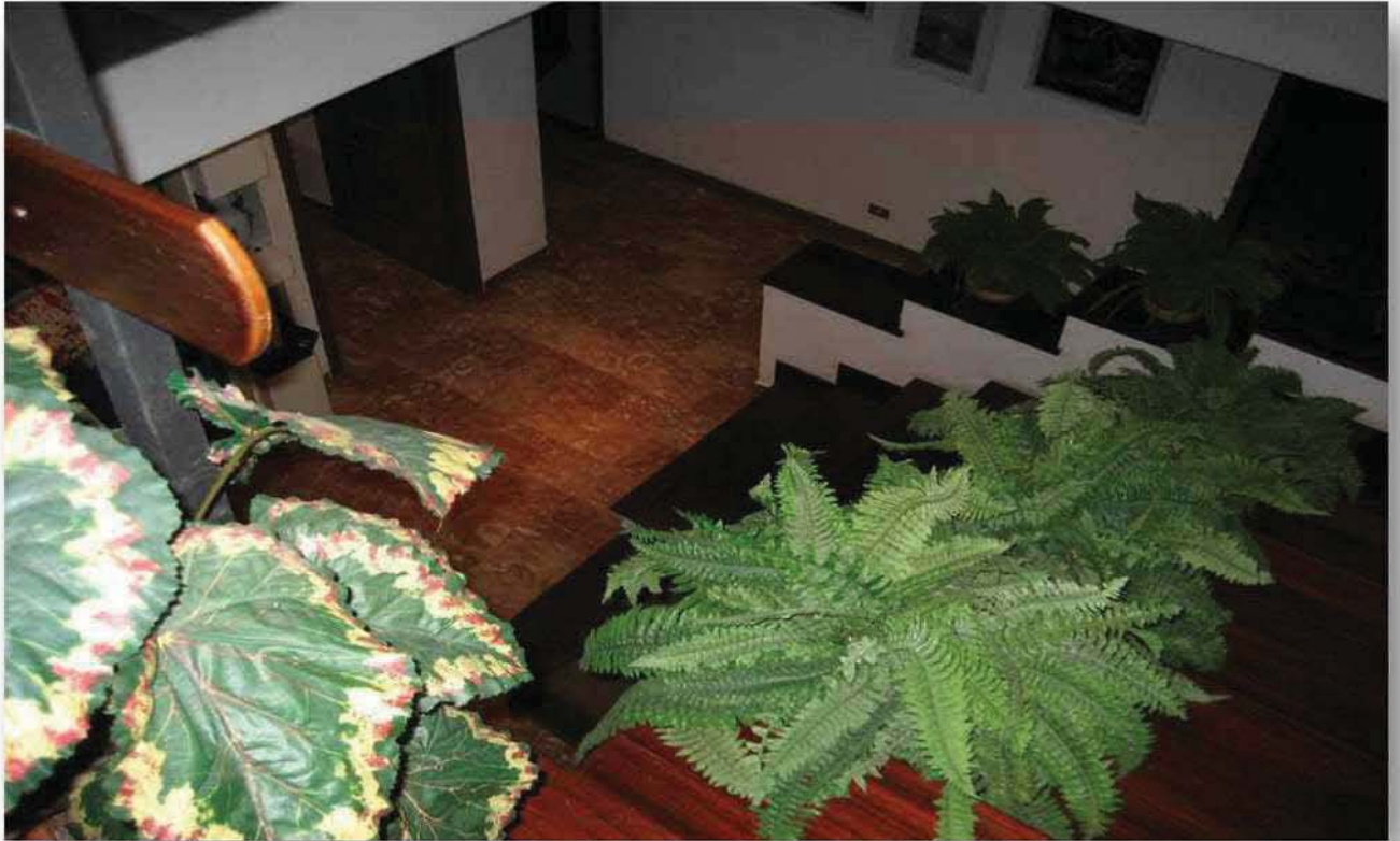
Foto 19 Vista dal piano sottotetto