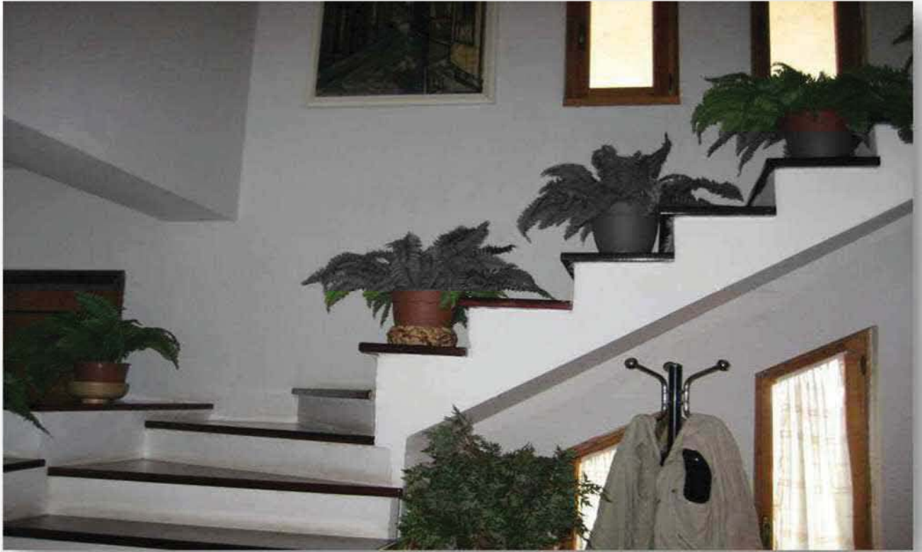
Foto 17 Scale