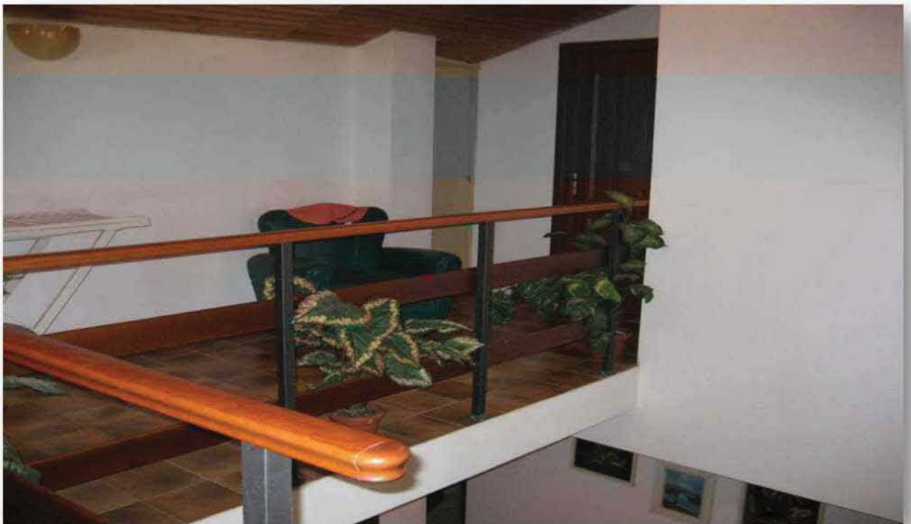
Foto 20 Corridoio piano sottotetto