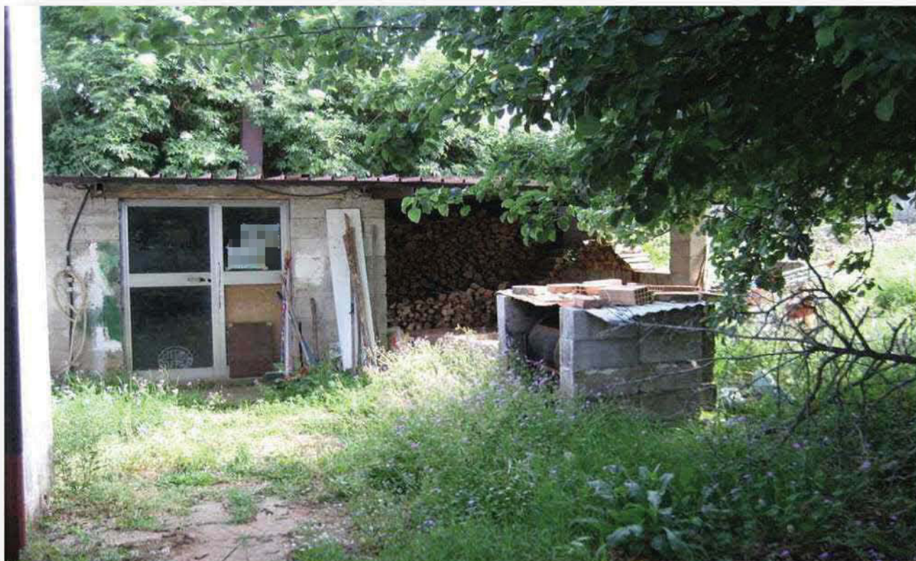
Foto 30 Manufatti adiacenti all'immobile