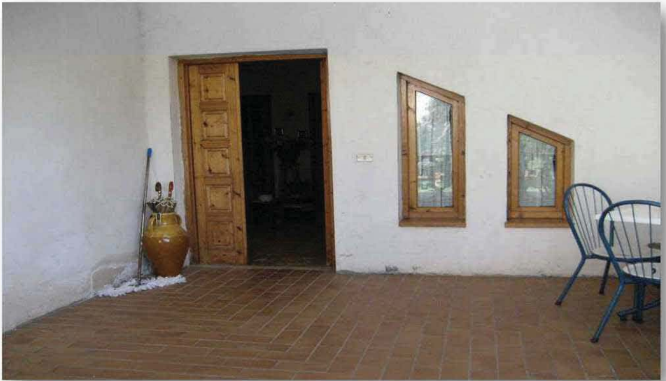
Foto 5 Ingresso immobile