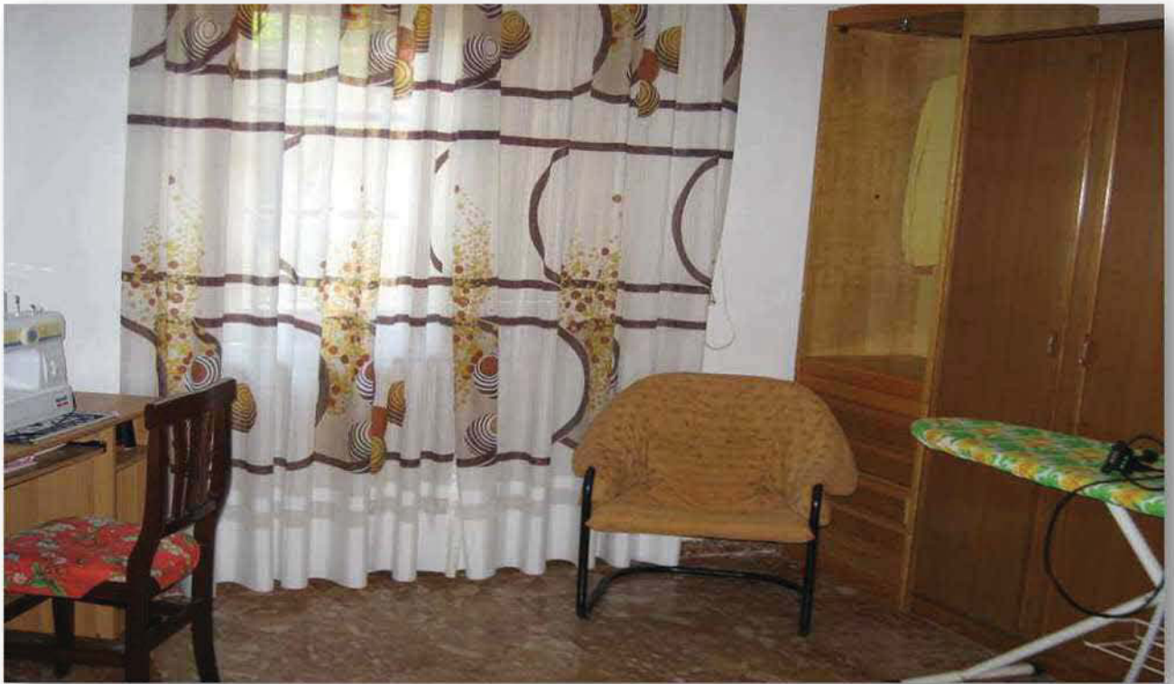
Foto 15 Camera da letto piano terra