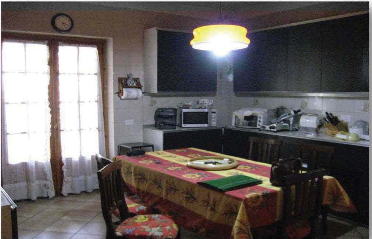
Foto 6 Cucina