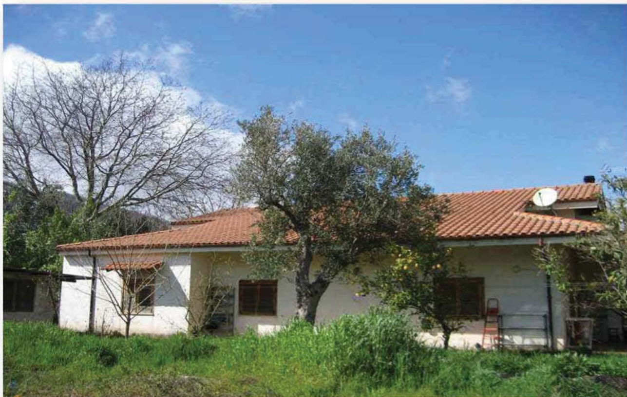
Foto 4 Vista posteriore immobile