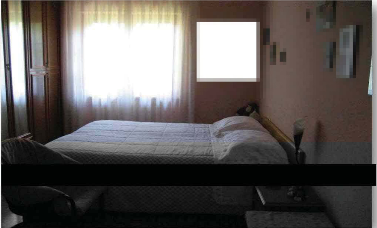
Foto 13 Camera da letto piano terra