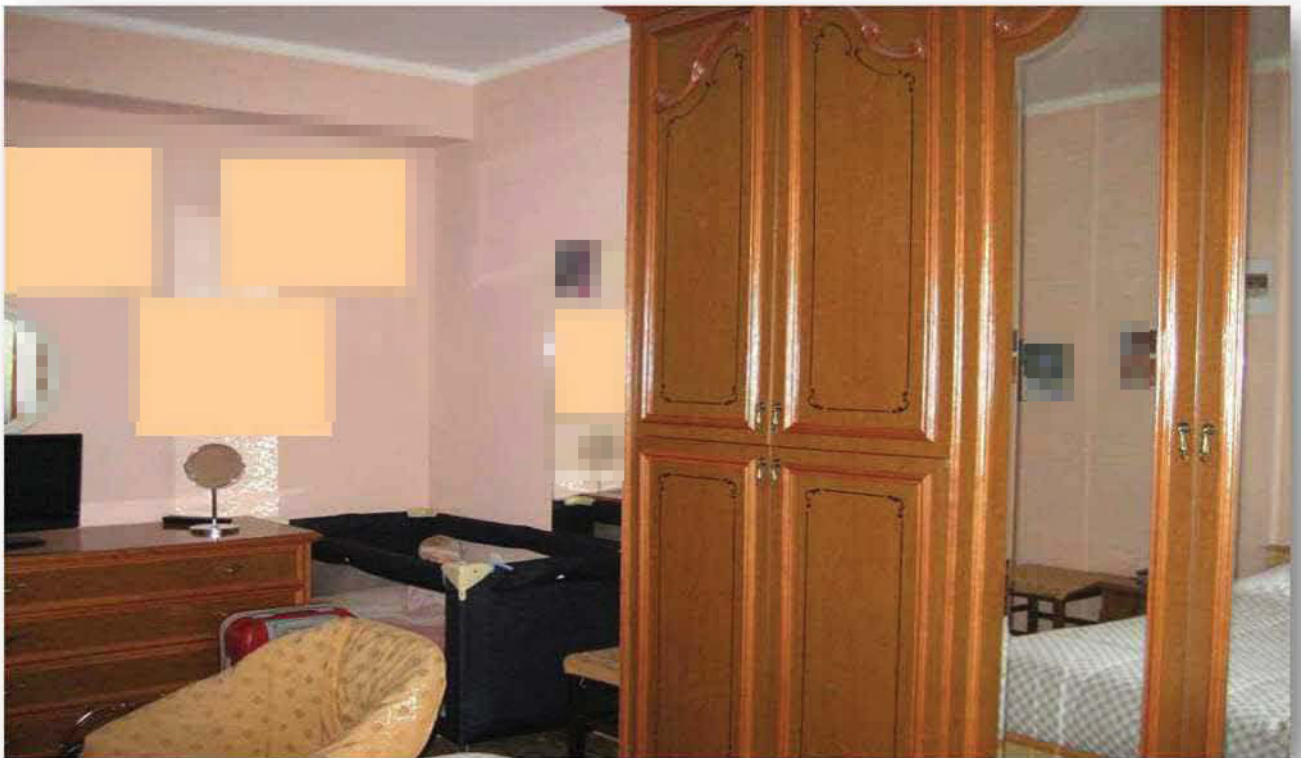
Foto 16 Camera da letto piano terra