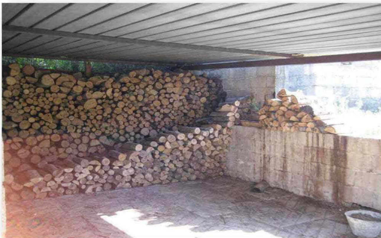
Foto 31 Manufatto sito sul terreno