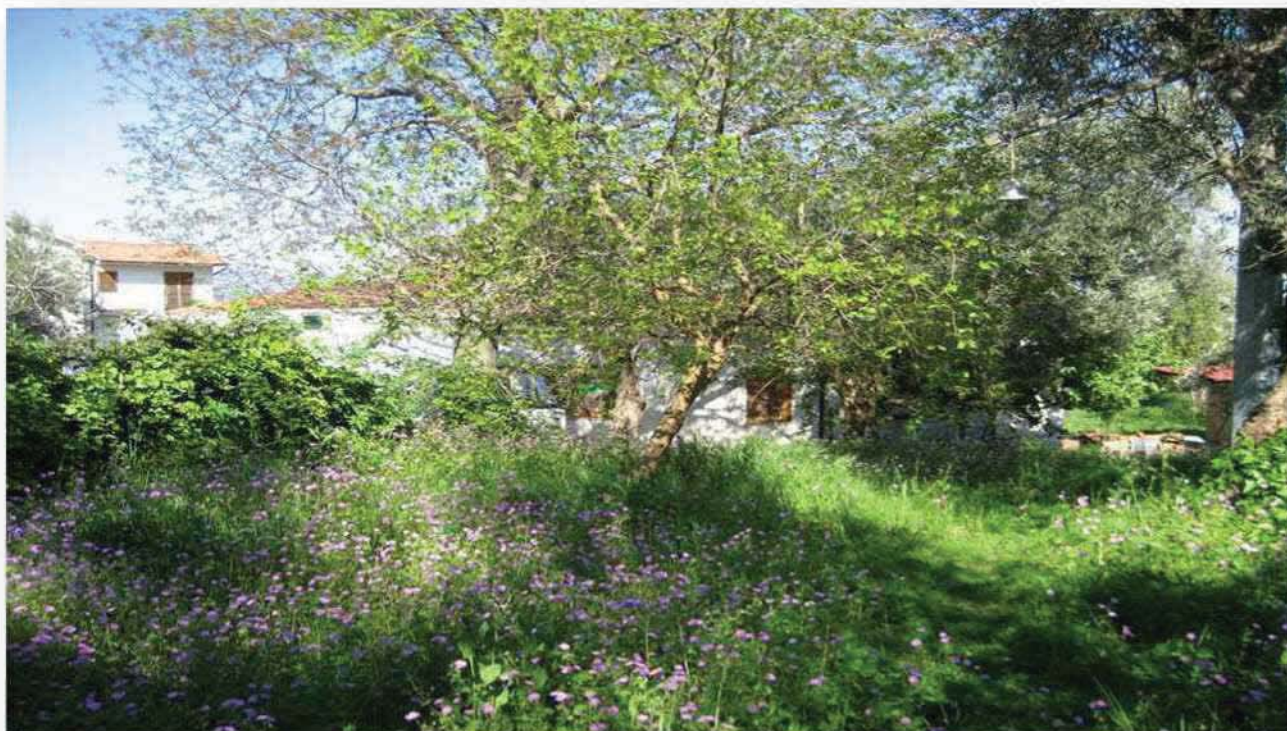
Foto 28 Corte