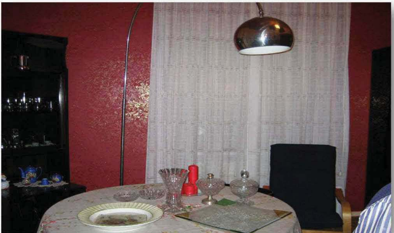
Foto 12 Sala da pranzo