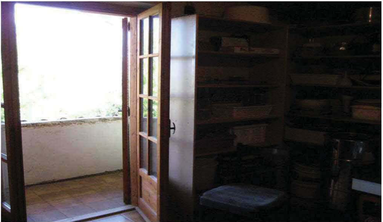
Foto 23 Balcone e Camera piano sottotetto