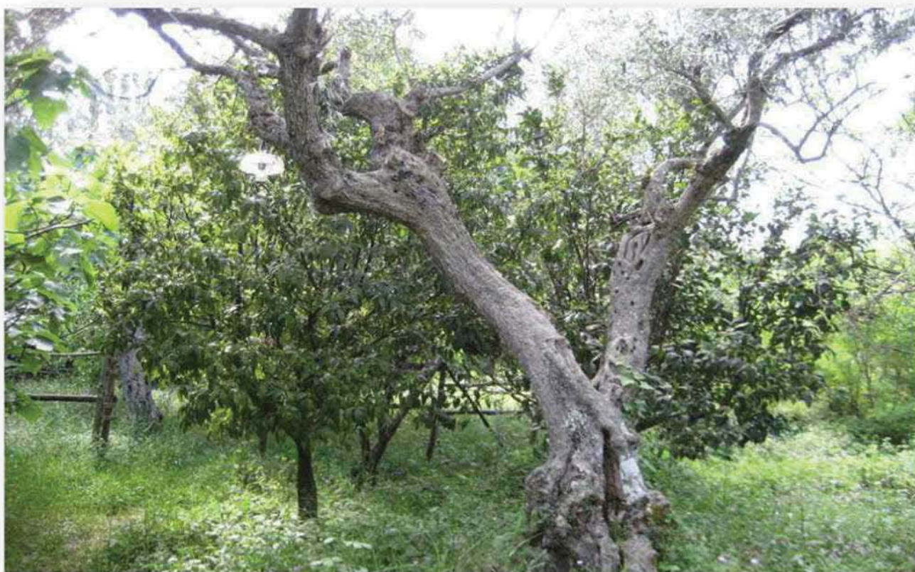
Foto 29 Alberi presenti sul terreno