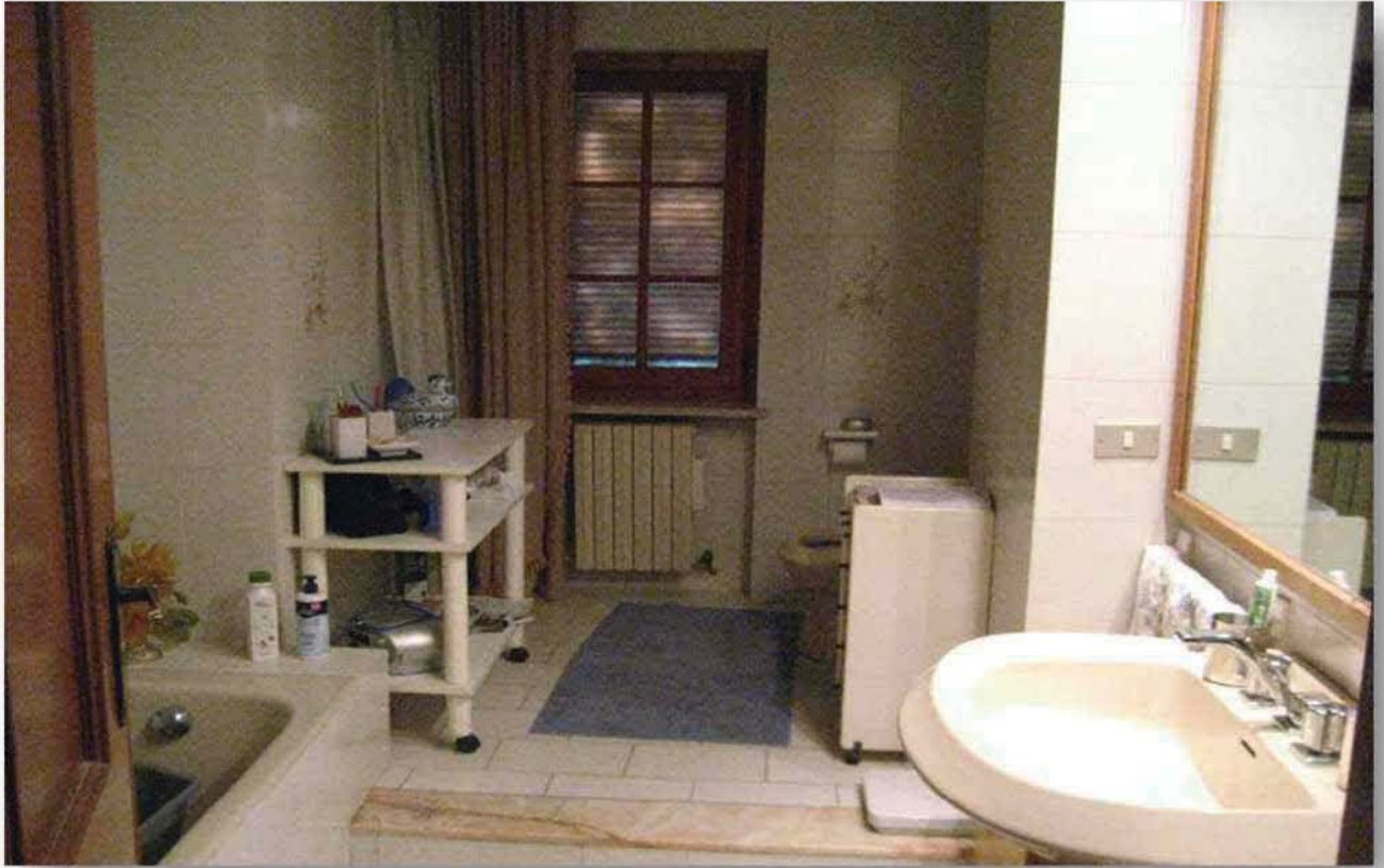
Foto 21 Bagno