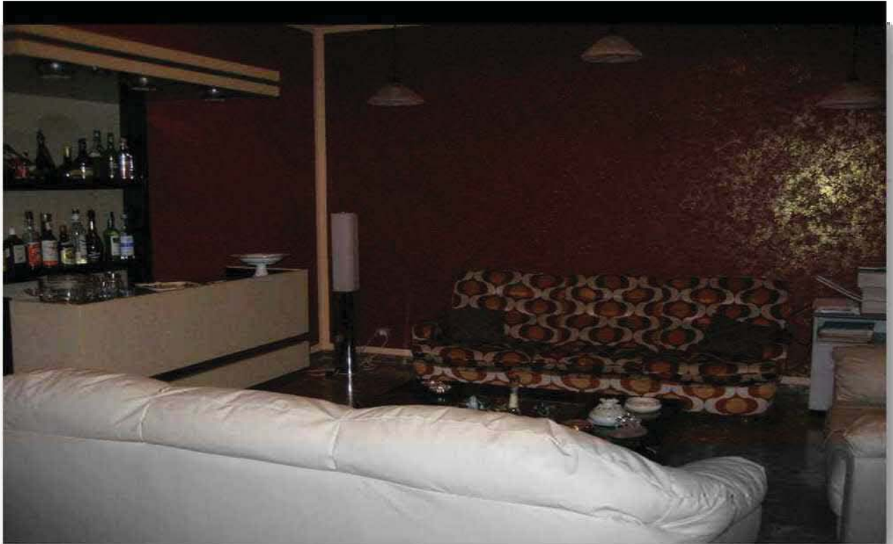
Foto 11 Salone