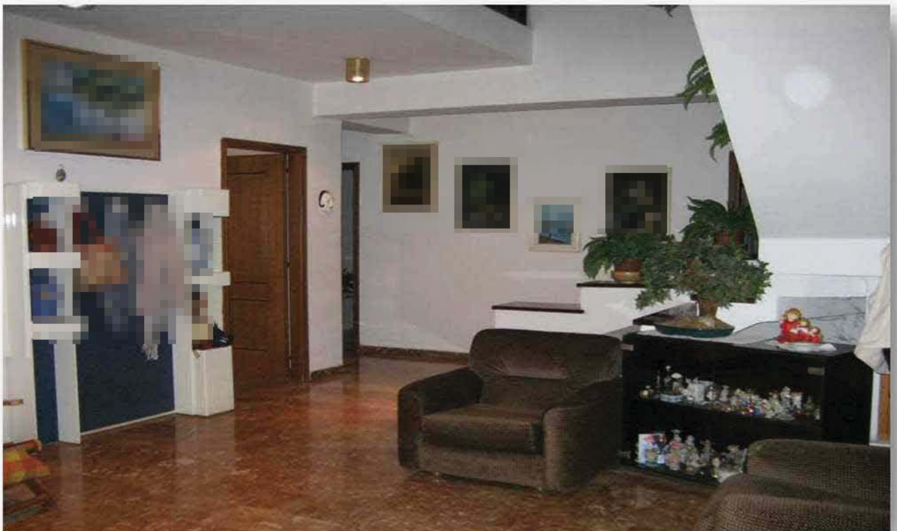
Foto 8 Atrio-Salone