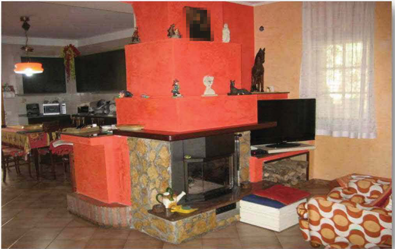
Foto 7 Termocamino