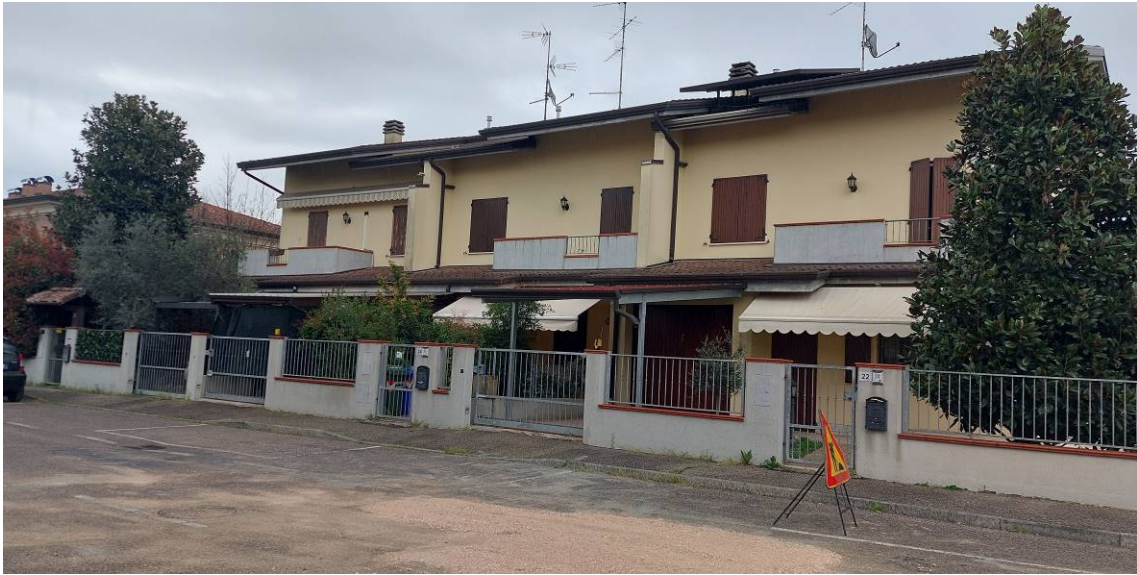
N. 1 SUD-OVEST