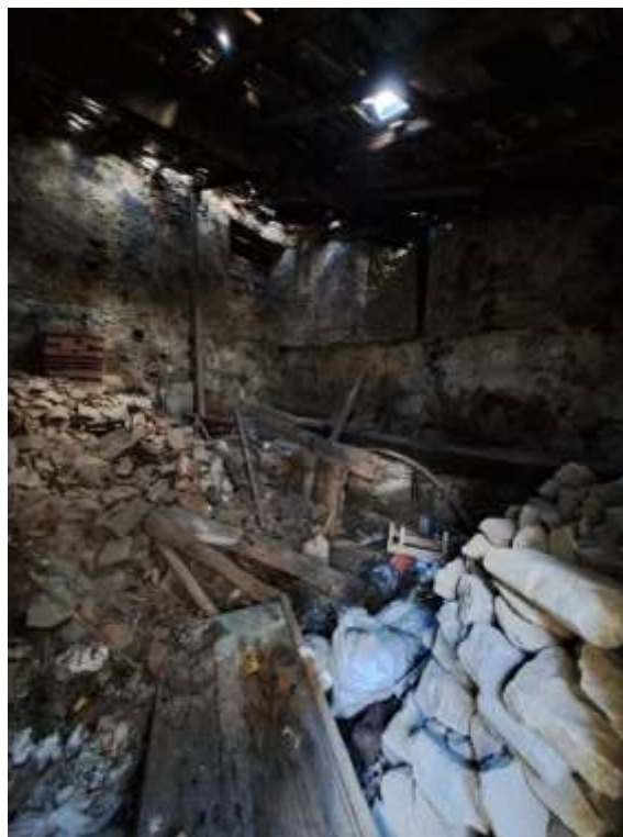
Foto n. 8 - Vista interna stesso immobile