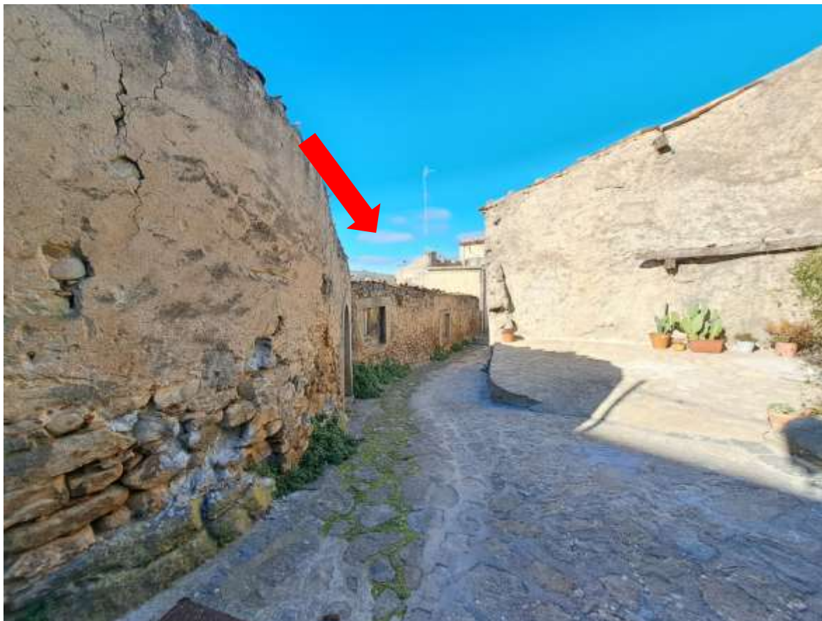
Foto n. 6 - Via Spirito Santo con indicazione degli immobili