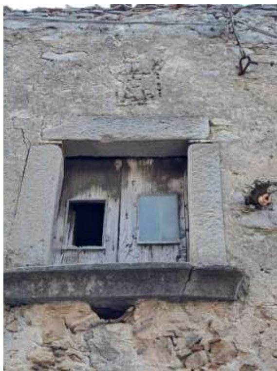
Foto n. 19 - Dettaglio della finestra al primo piano, esistente sul prospetto di Via Giovan Guerino.