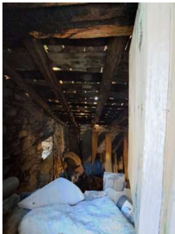
Foto n. 24 – Vista interna dello stesso immobile da Vicolo Firenze.