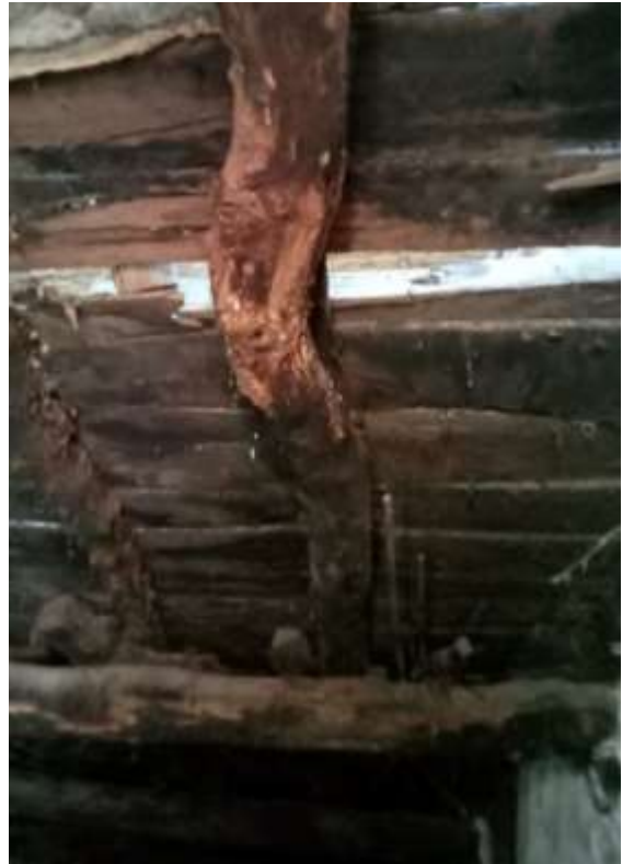
Foto n. 26 - Orditura del solaio di interpiano del vano di accesso al piano terra, lato Via Giovan Guerino.