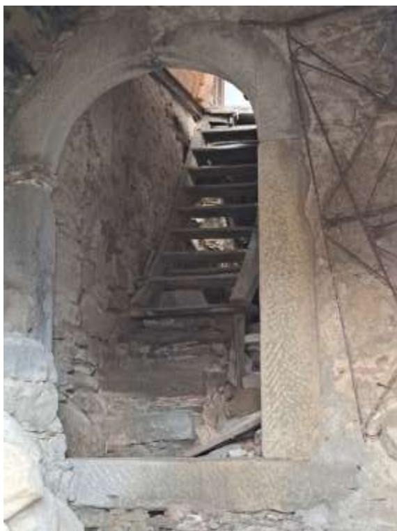
Foto n. 18 - Vista interna dello stesso immobile, accedendo da Via Camposanto, con dettaglio della scala di collegamento interna.