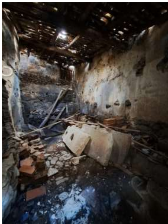
Foto n. 10 - Vista interna stesso immobile