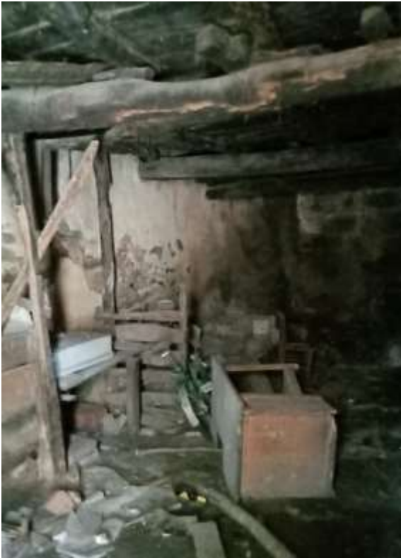
Foto n. 25 – Vista del vano interno all'accesso da Via Giovan Guerino.