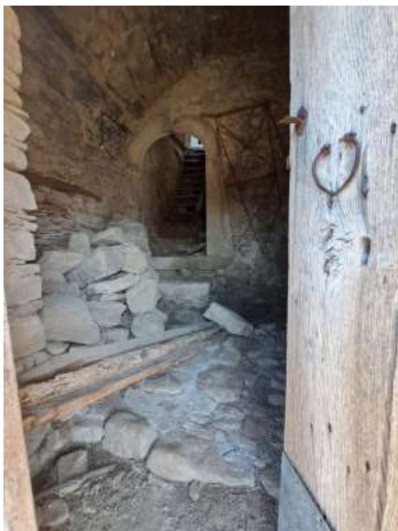
Foto n. 16 - Vano di accesso all'immobile dalla Via Camposanto e vista dell'ambiente interno.