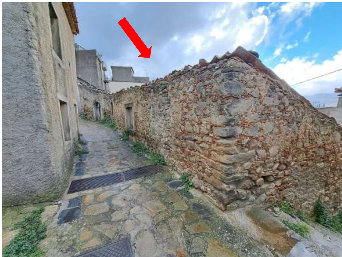
Foto n. 3 - Angolo Vico A.F. e Via Spirito Santo