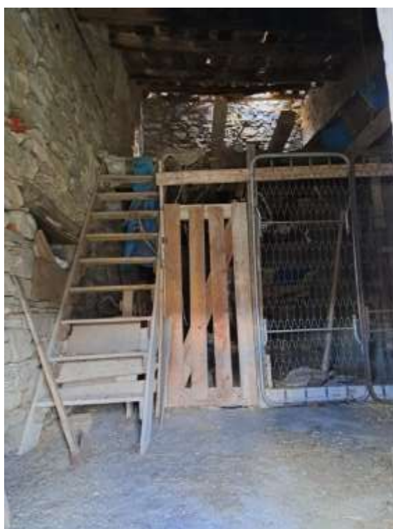
Foto n. 13 - Vista interna stesso immobile