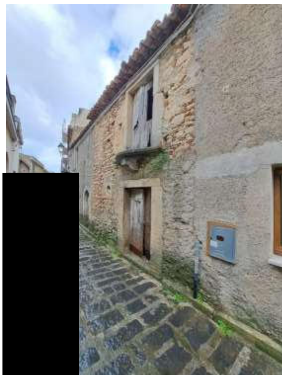
Foto n. 22 - Altra vista del prospetto dello stesso immobile.