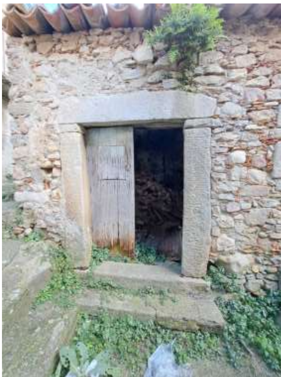
Foto n. 7 - Porta di ingresso immobile part.IIa 423 sub 3