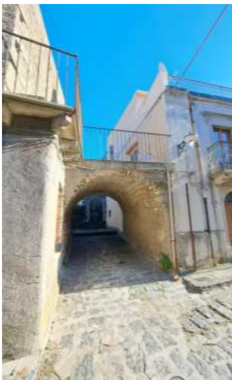
Foto n.4 - Vico A.F. visto da Via Giovan Guerino.