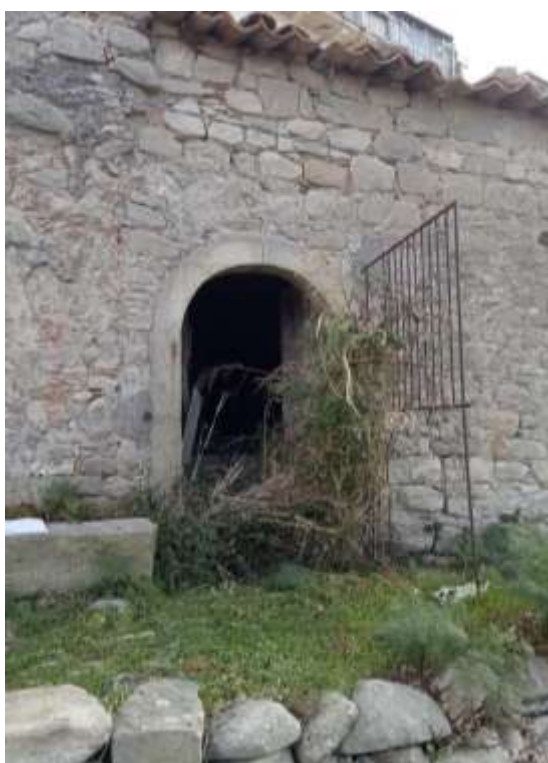
Foto n. 12 - Vano di accesso all'immobile