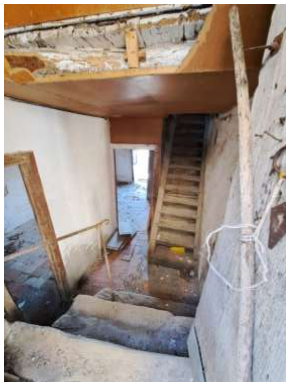
Foto n. 17 - Parziale vista interna dello stesso immobile, all'accesso da Via Giovan Guerino.