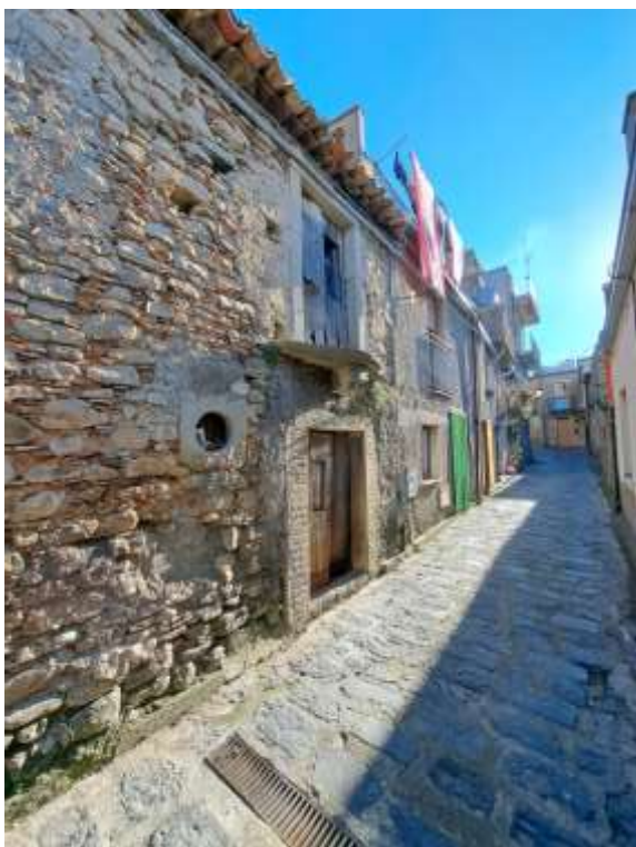
Foto n. 21 - Prospetto immobile su Via Giovan Guerino n. 24.