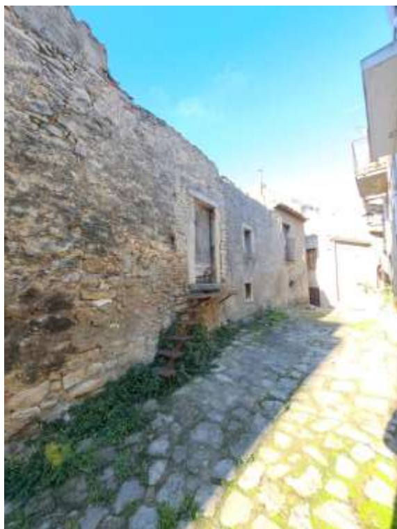
Foto n. 23 – Vista del prospetto dell’immobile su Vicolo Firenze (erroneamente indicato Via Ciappazza nella documentazione in possesso).