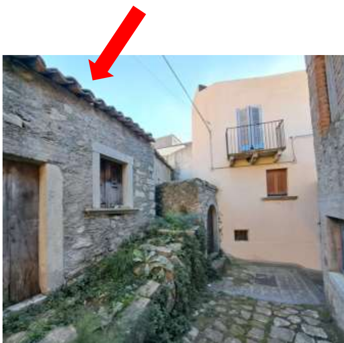
Foto n.5 – Vico A.F. con indicazione dell'immobile part.IIa 423 sub 4