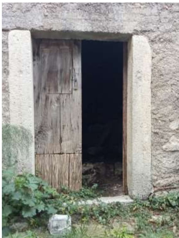
Foto n. 9 - Porta di ingresso immobile part.IIa 423 sub 4