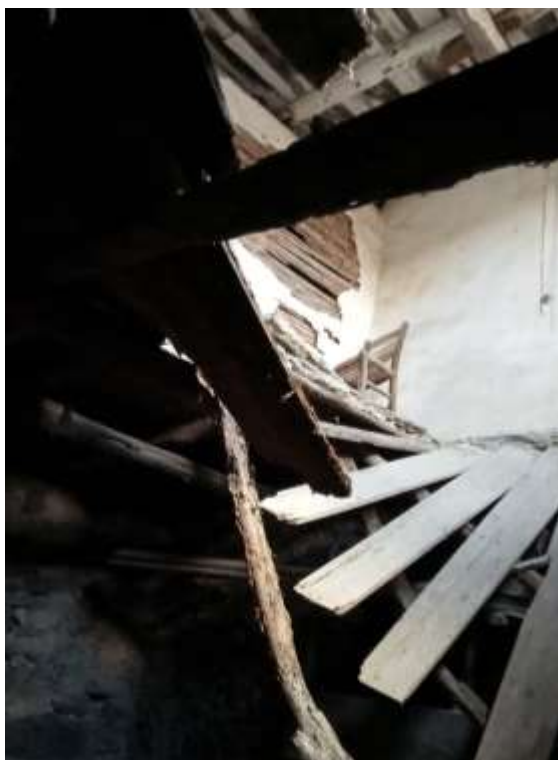
Foto n. 20 - Vista dell'interno con solaio di interpiano parzialmente crollato e vista della condizione di alcuni tramezzi interni.