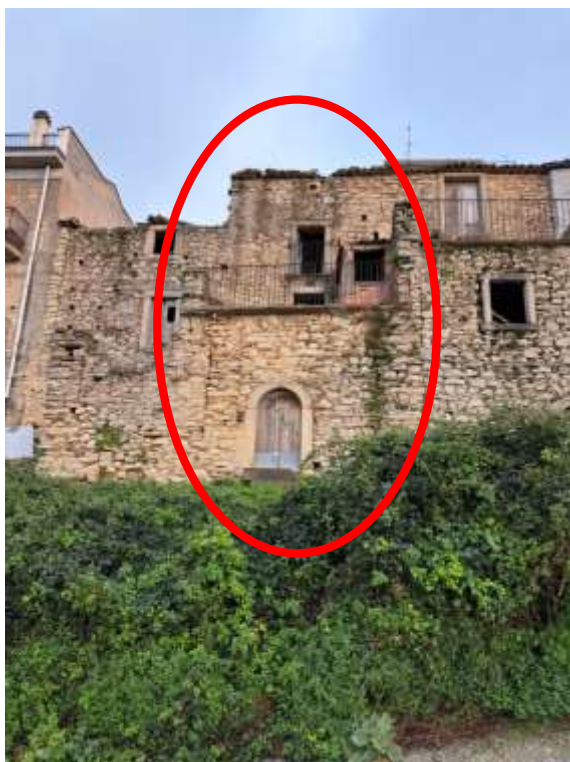
Foto n. 14 - Prospetto immobile su Via Camposanto.