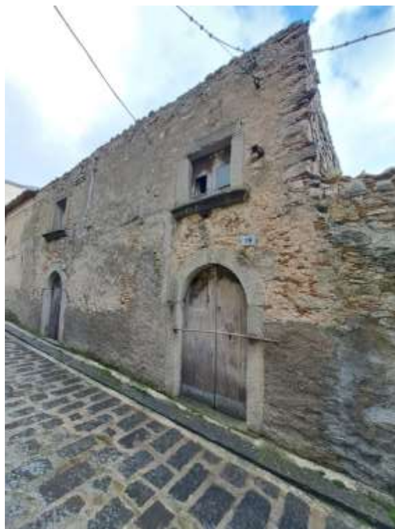
Foto n. 15 - Prospetto immobile su Via Giovan Guerino n. 19.