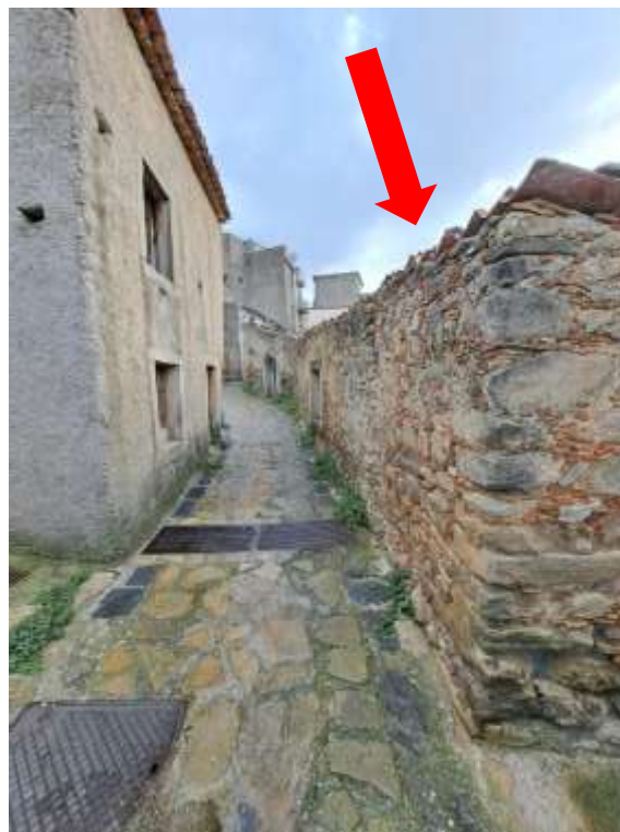
Foto n.2 - Via Spirito Santo