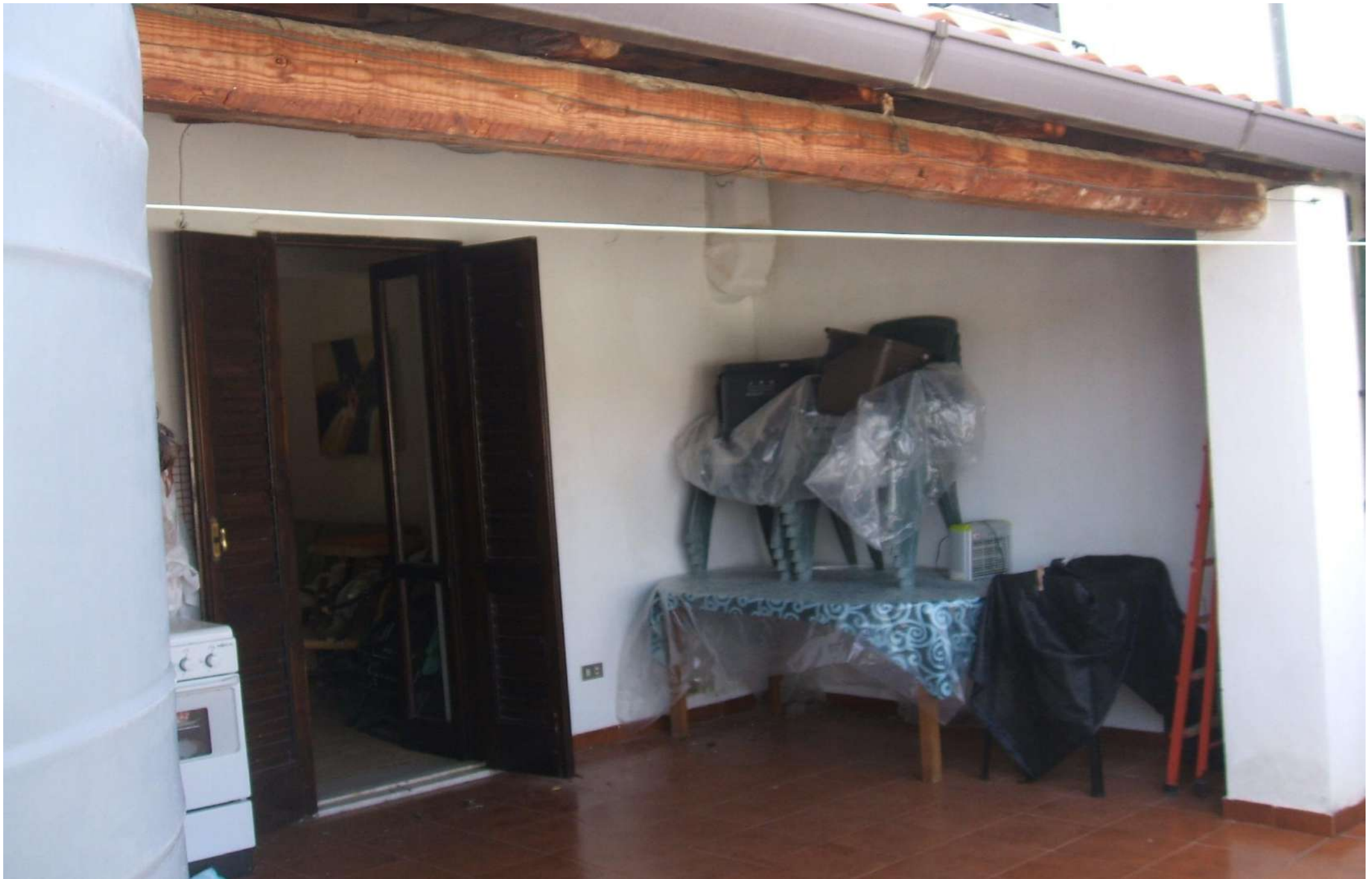
Corte esterna lato nord –zona coperta-