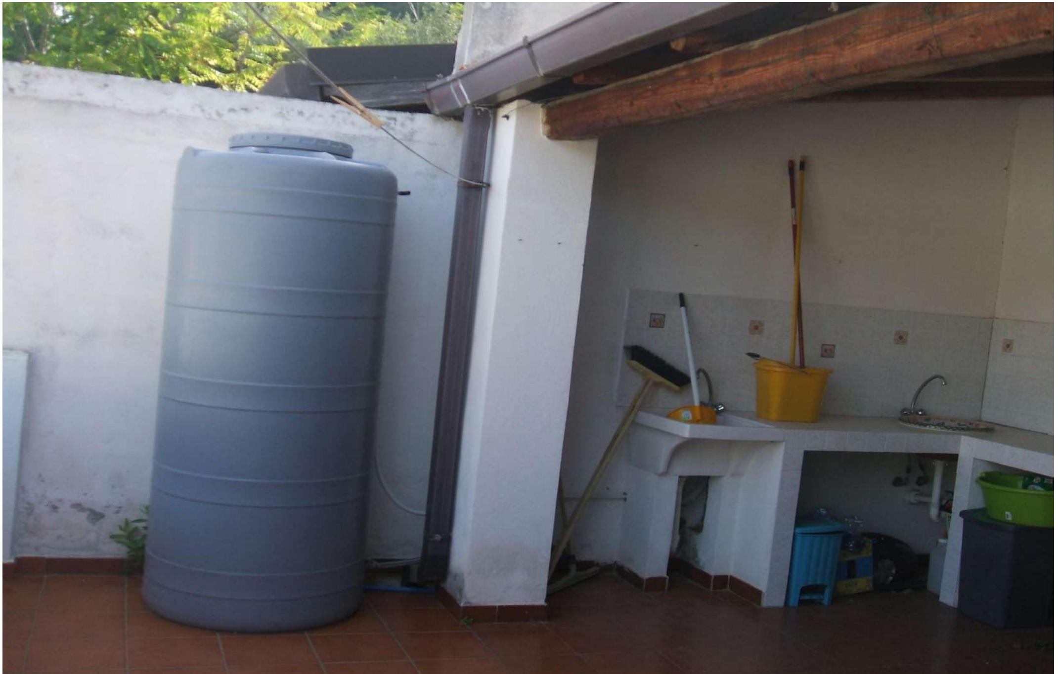
Corte esterna lato nord