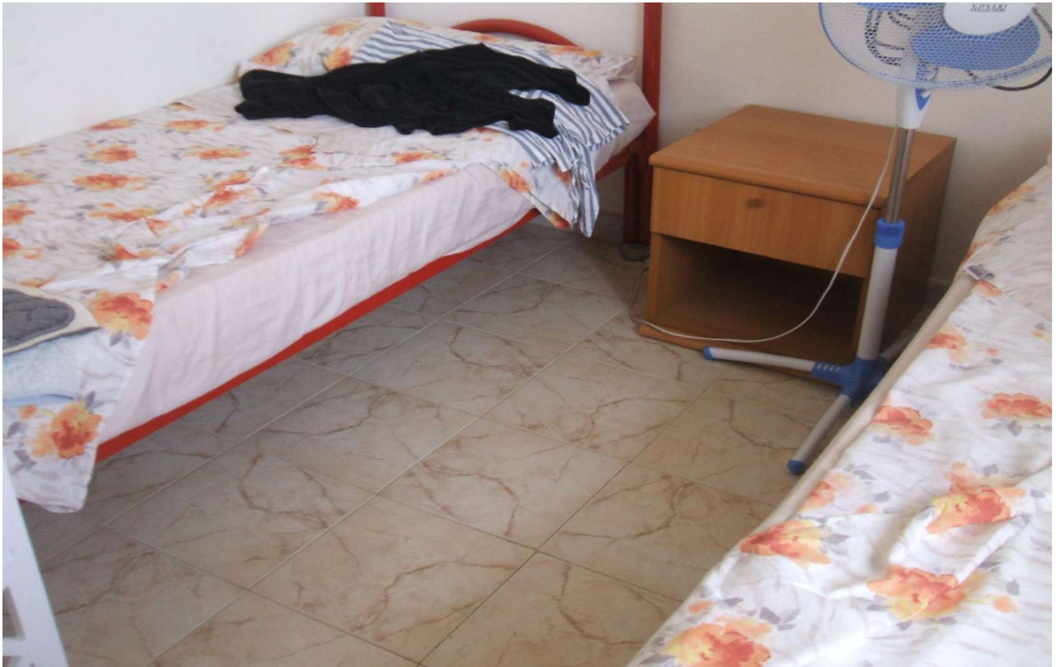
Vista vano ripostiglio I°p.-adibito a stanza da letto.