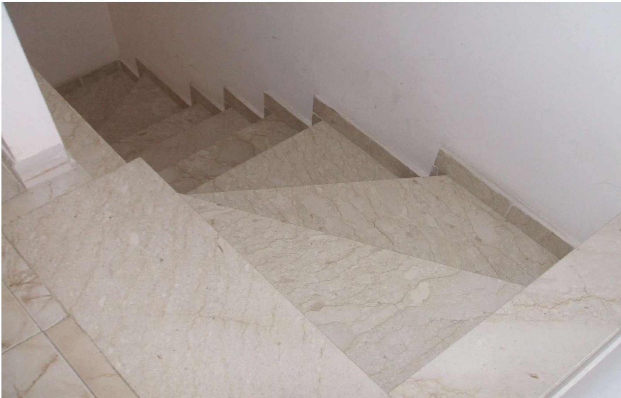
Scala- rampa di arrivo al I°p.