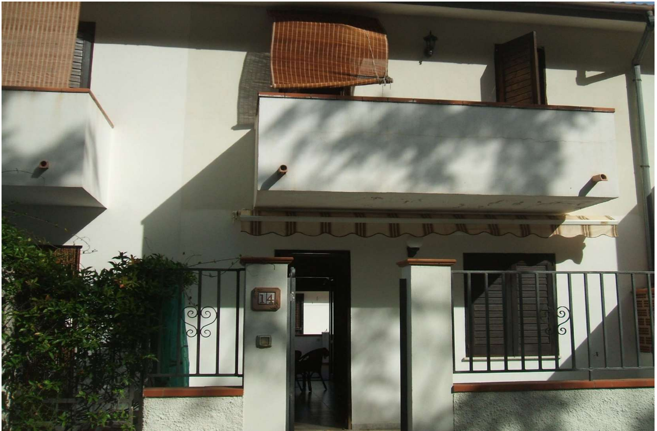
Prospetto sud –vista accesso all'appartamento.