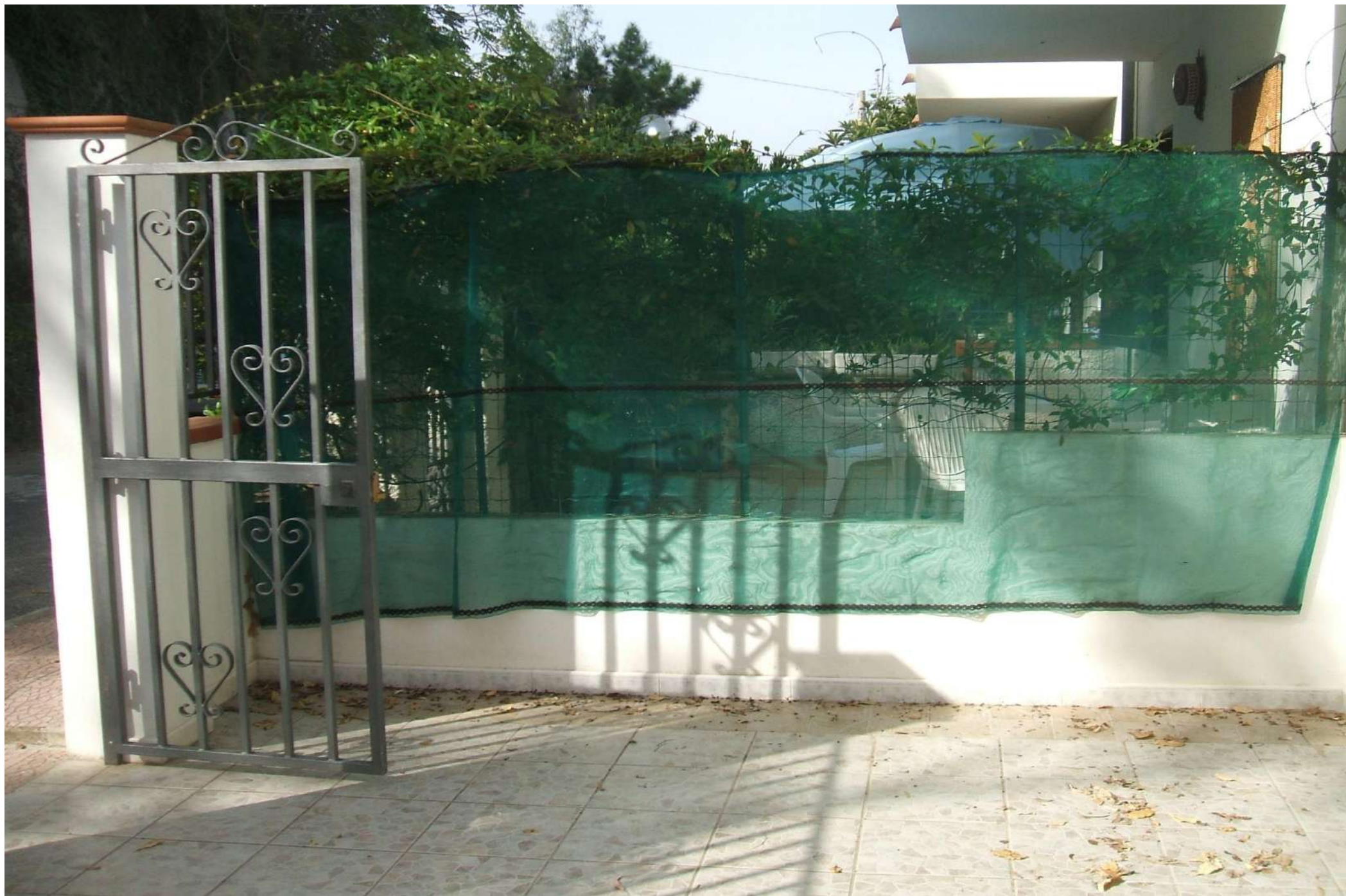
Vista corte esterna di accesso all'alloggio –lato sud.