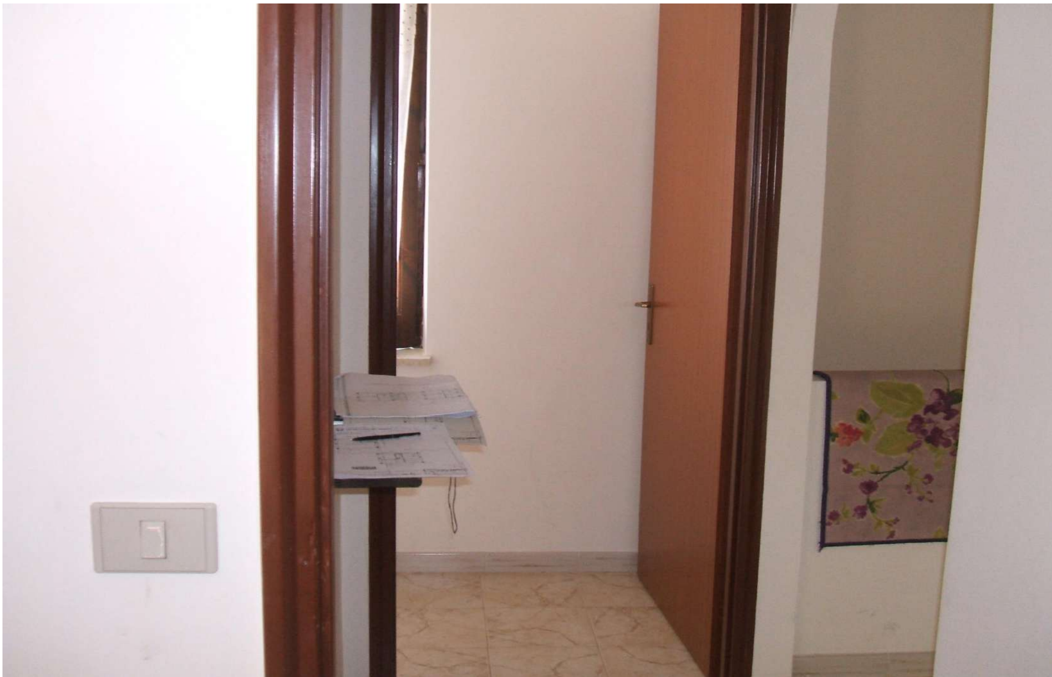
Accesso al vano ripostiglio 1°p.