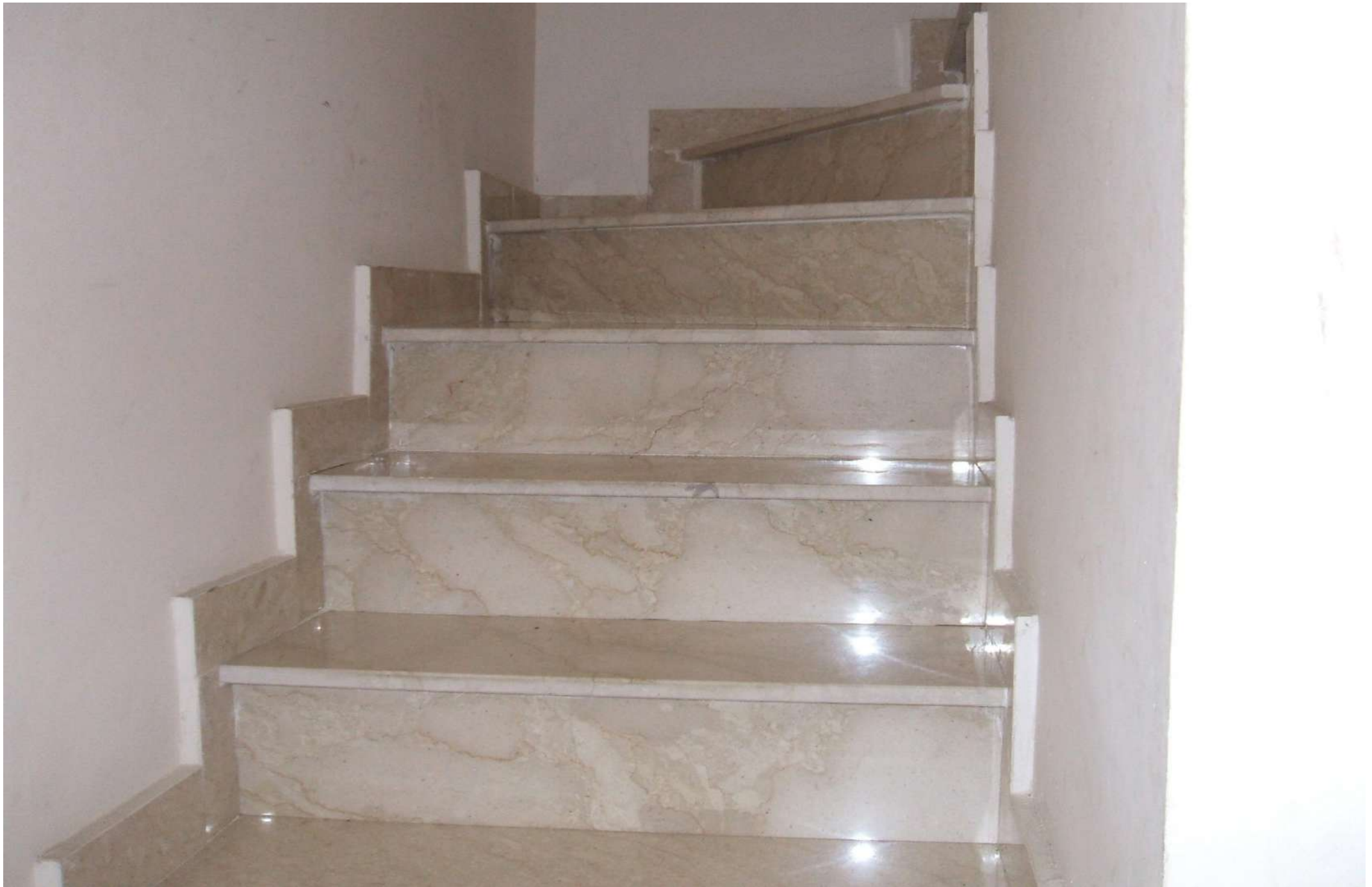
Scala che conduce al I°p.