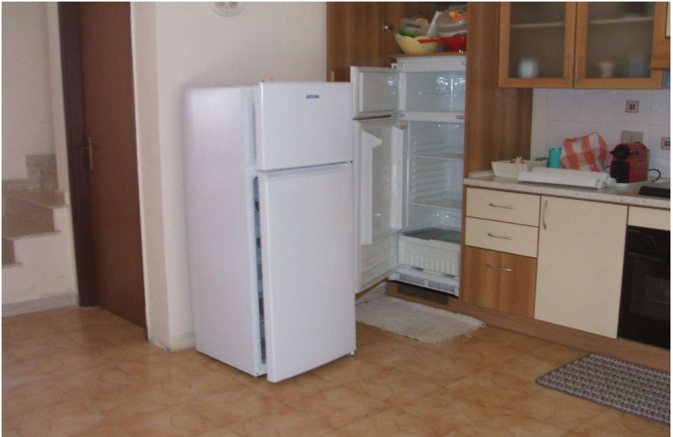
Vista zona cucina dell'ambiente unico al p.t.