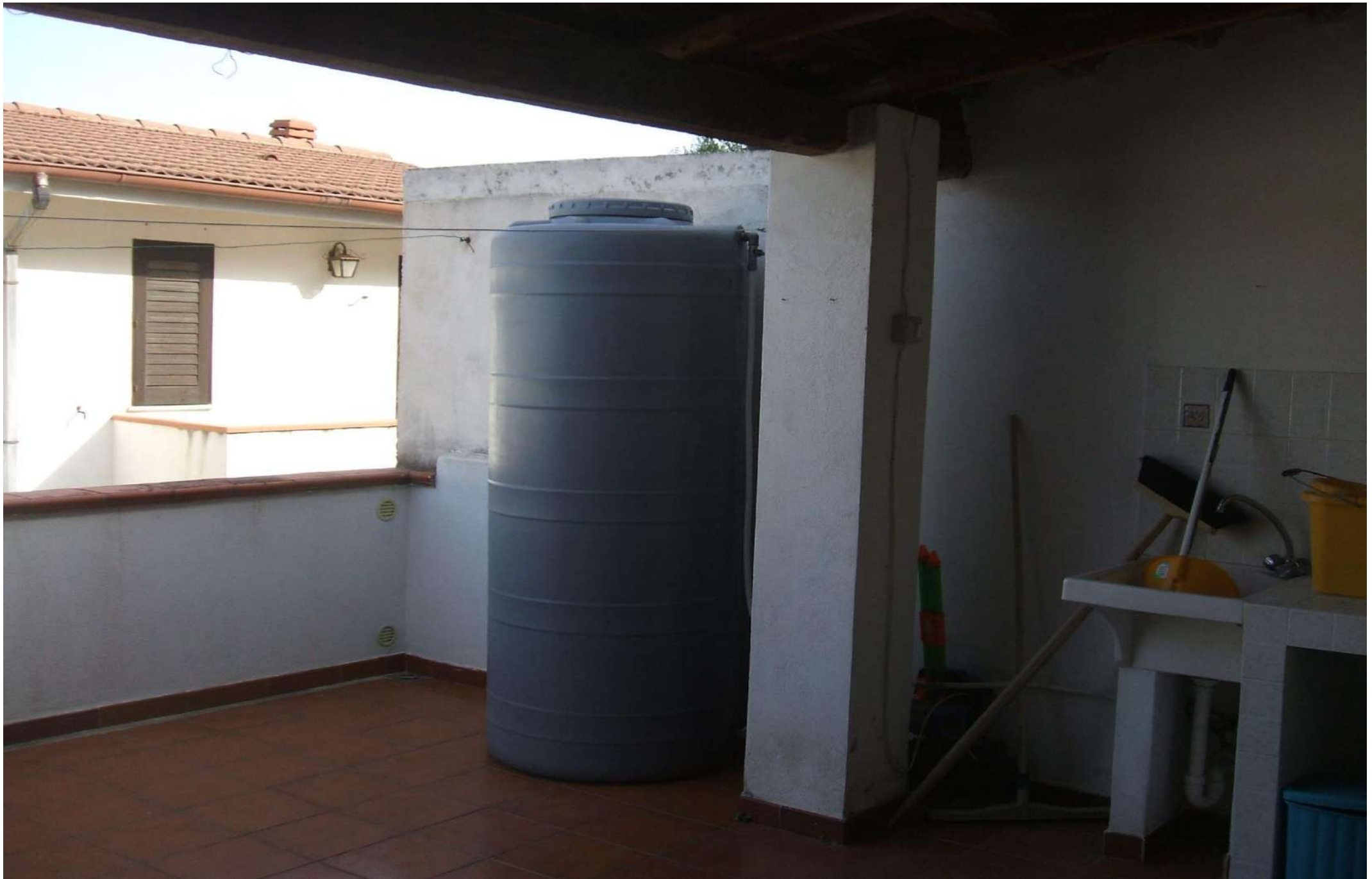
Corte esterna lato nord.