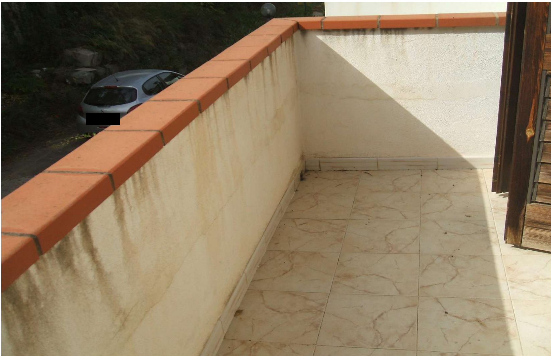
Balcone – I°p. lato sud.