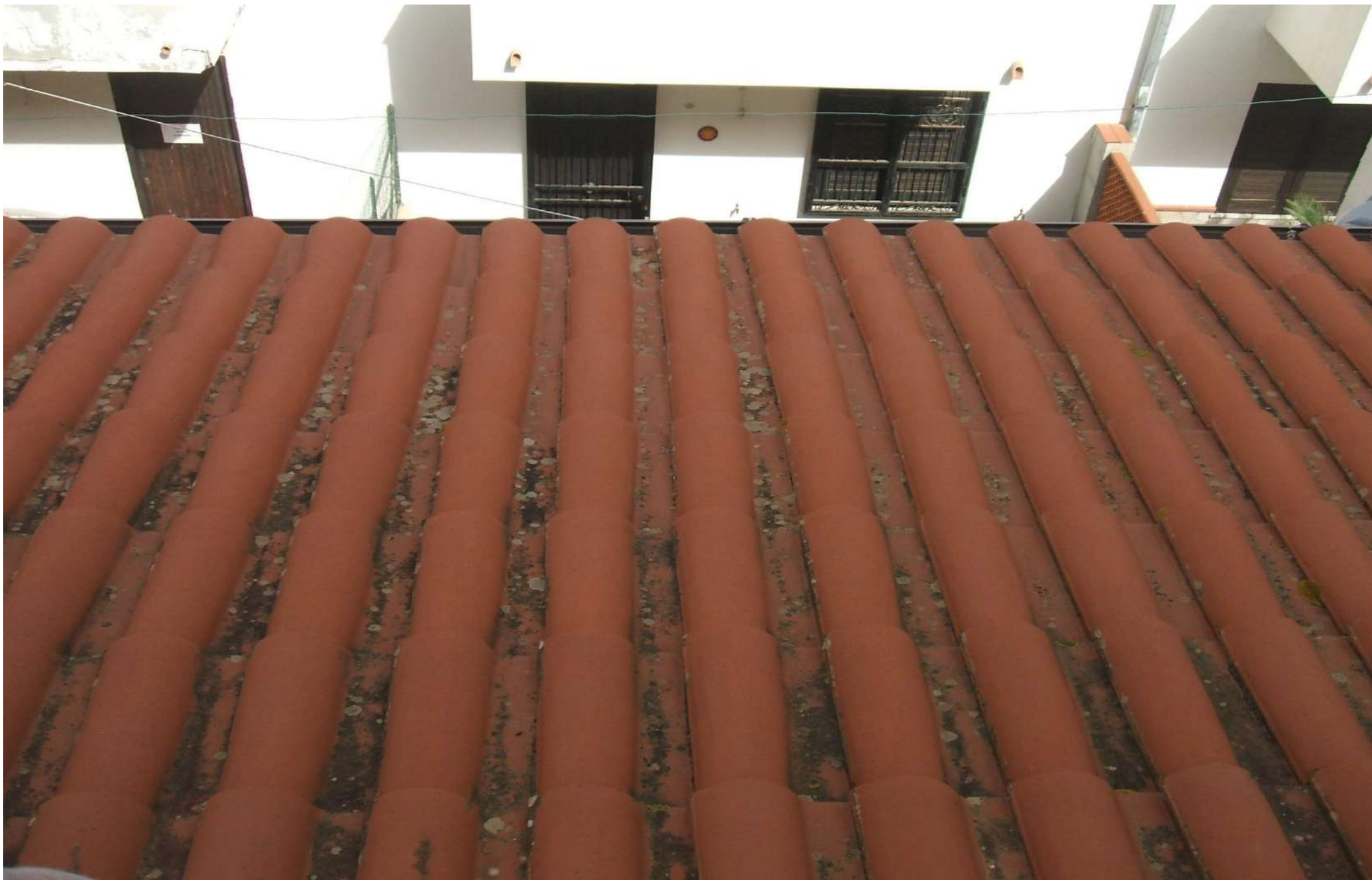
Vista dal 1°p. della copertura sottostante della corte lato nord.