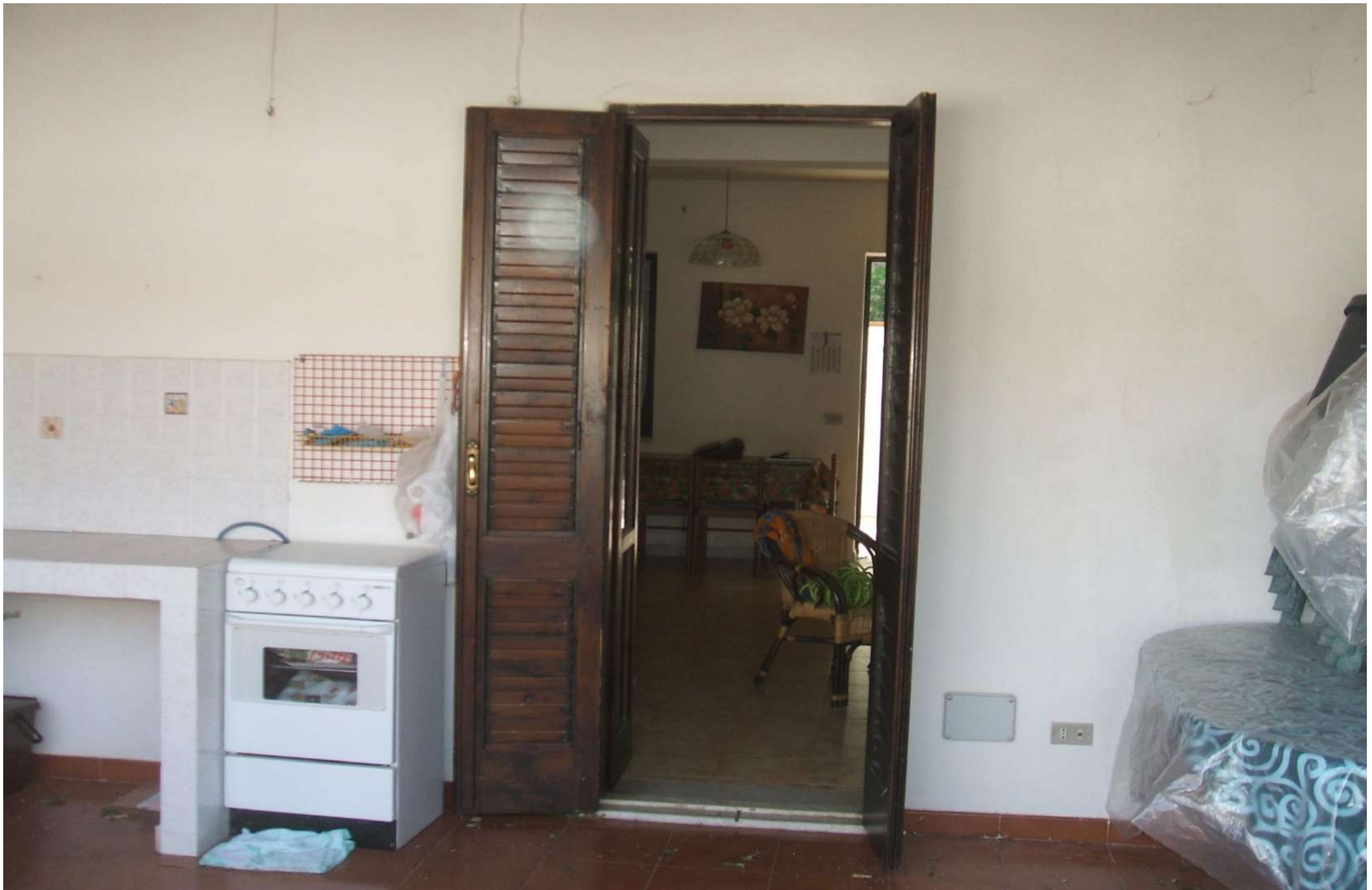
Vista dalla corte esterna lato nord-porta finestra di accesso alla corte dal soggiorno.