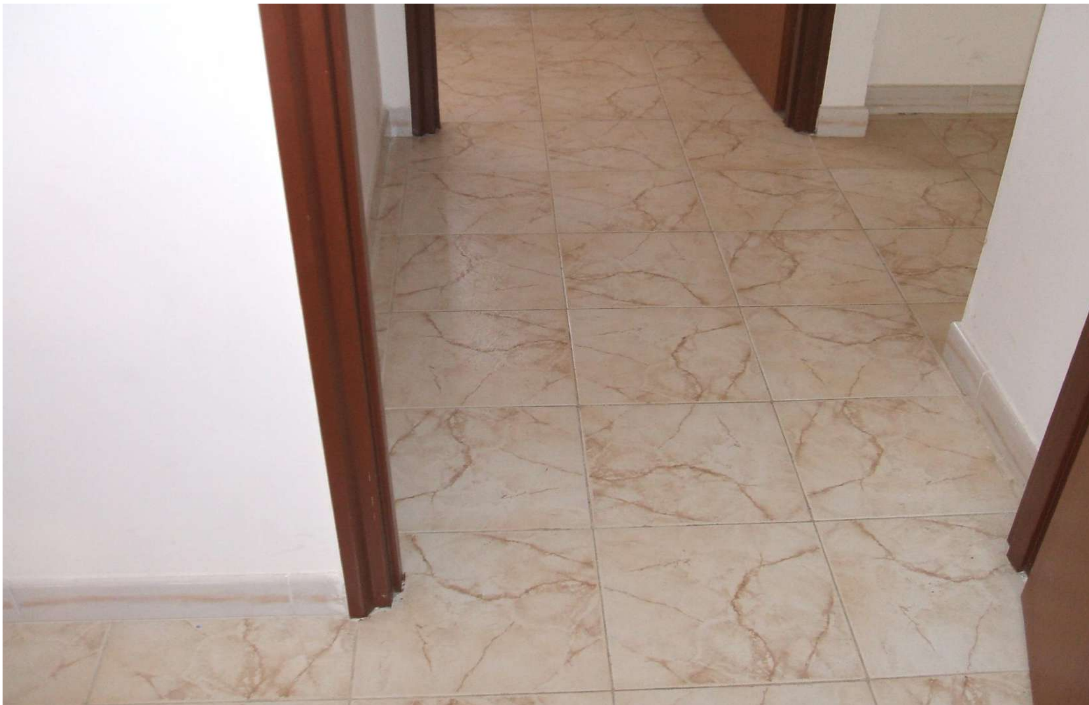
Pavimentazione a tappeto in piastrelle di ceramica (cm.30x30) I° p..