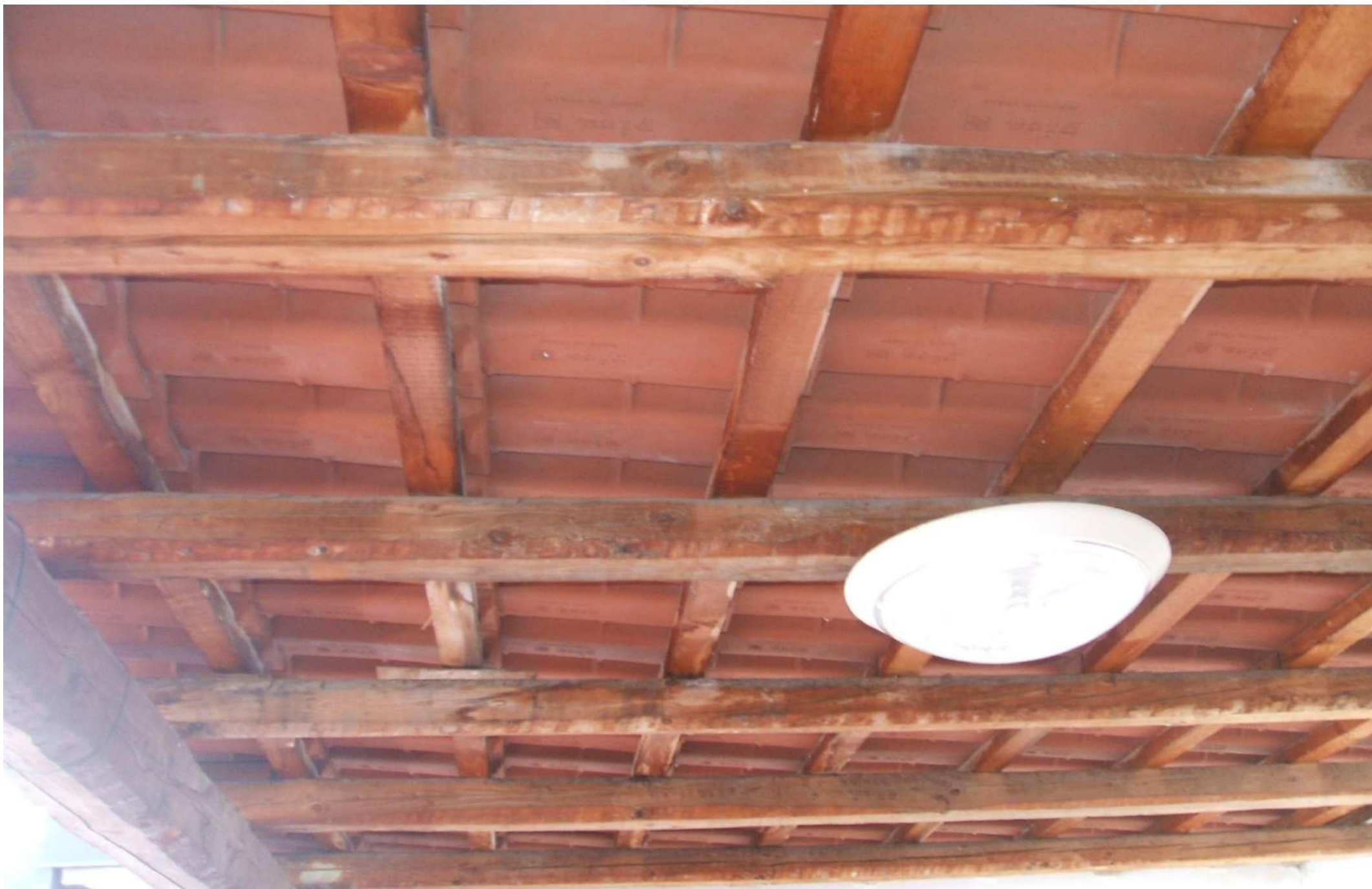
Struttura della copertura corte esterna lato nord.