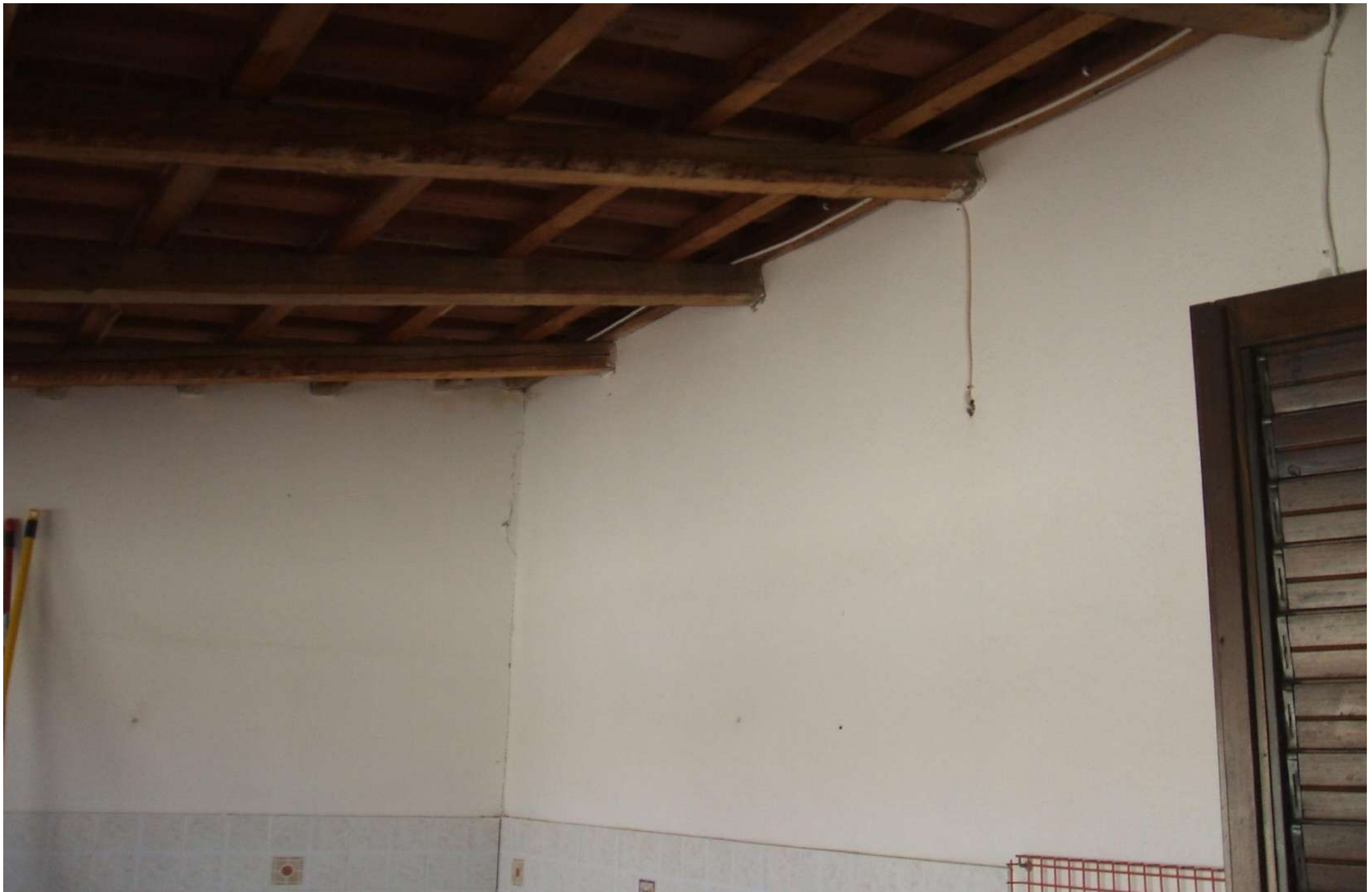
Vista zona coperta della corte lato nord.