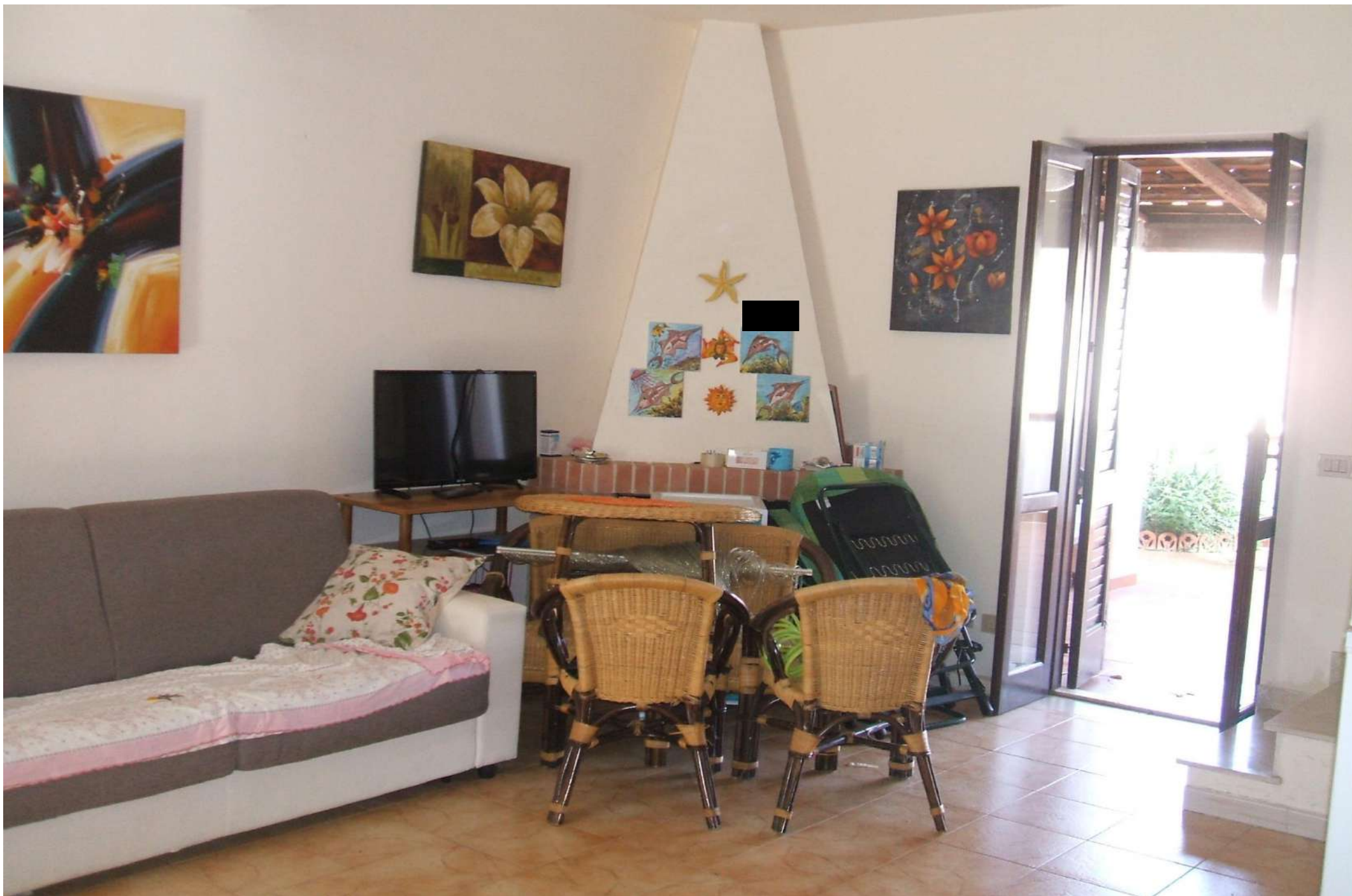
Vista interno p.t. soggiorno – camino ad angolo, porta finestra di accesso alla corte lato nord.