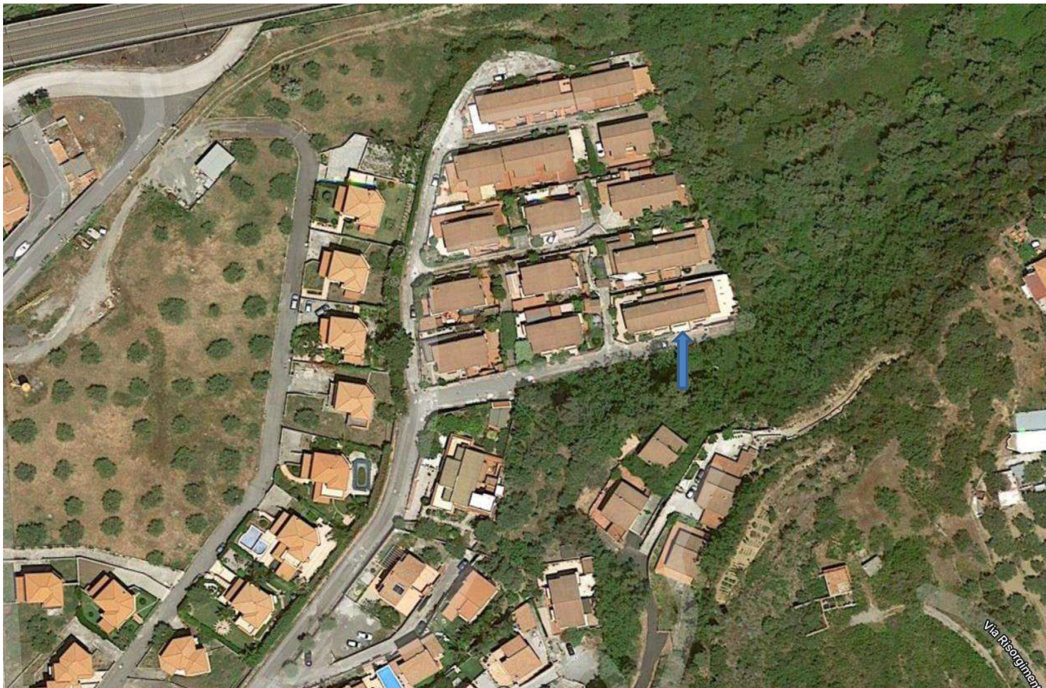
Furnari-Residence poggio delle rose- vista aerea, la freccia indica l'unità imm.al fg.8 part.1696 sub.3.