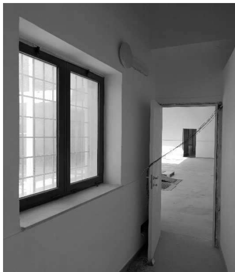
Figura 10 – Ripresa 8: Vano ripostiglio