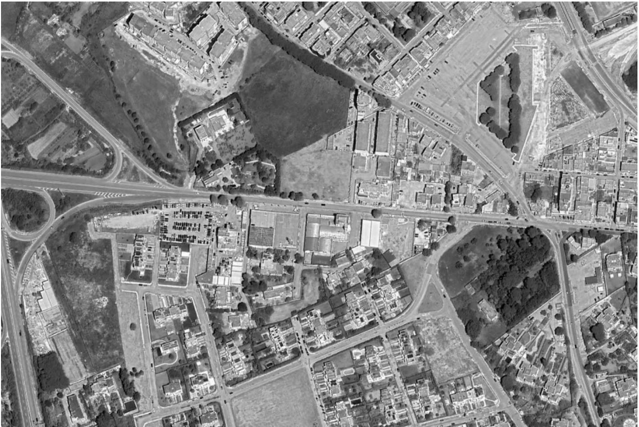
Figura 1 - Ortofoto circondario ed individuazione fabbricato ed evidenziazione Sub 31