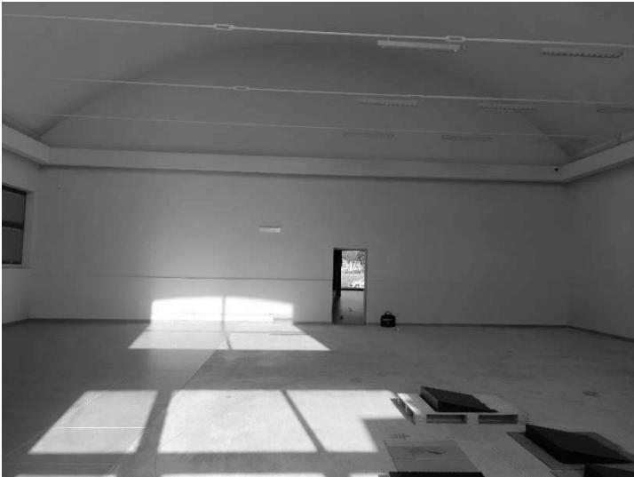
Figura 7 – Ripresa 5: Parete Nord con vano passaggio sub 26- sub 28