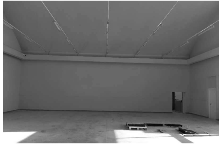
Figura 6- Ripresa 4 : Parete Est con vano passaggio sub 31- sub 28