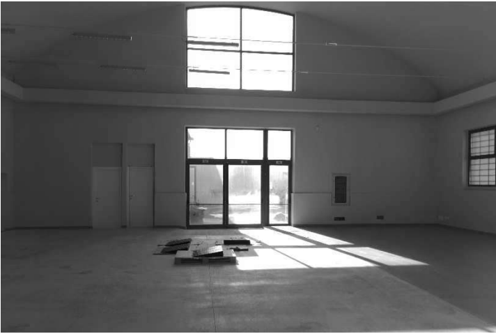
Figura 5 –Ripresa 3: parete Sud che accede al B.c.n.c sub 32 - cortile