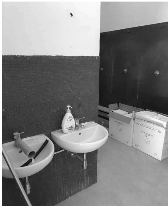
Figura 12 – Ripresa 10 Scorcio servizi igienici – Lavelli