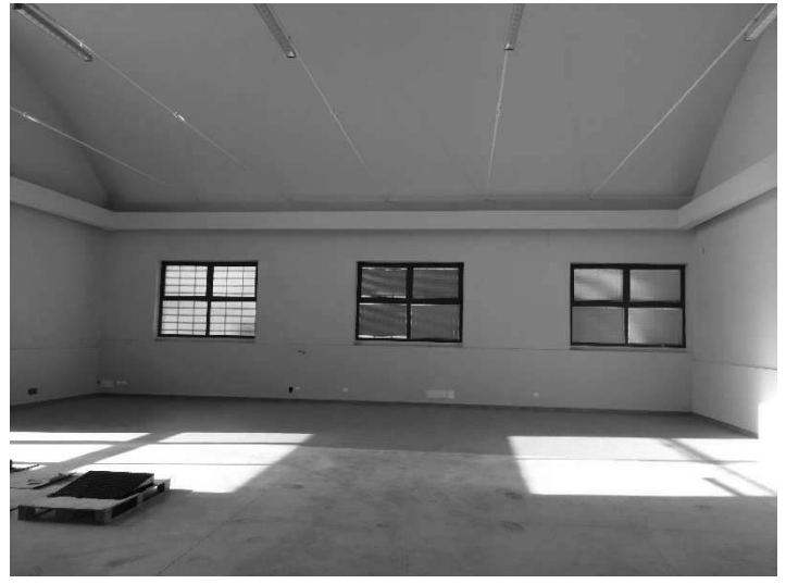
Figura 8 –Ripresa 6 : Parete Ovest