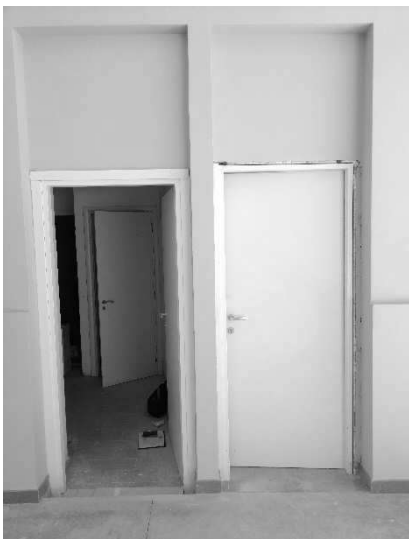
Figura 9 - Ripresa 7: Porte accessi vani accessori