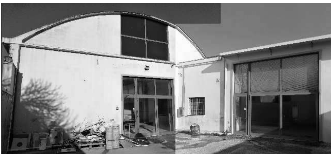
Figura 4 – Ripresa 2: Fronte unità immobiliare Sub 31 da cortile Sub 32 ed individuazione dell'immobile