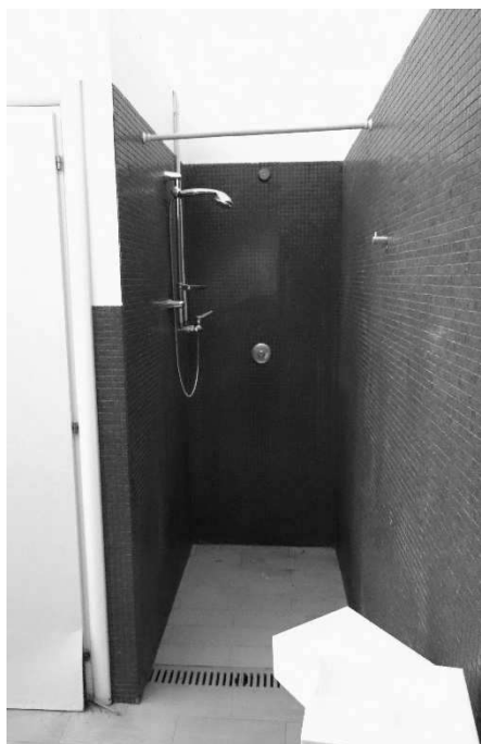
Figura 14 – Ripresa 12: Doccia