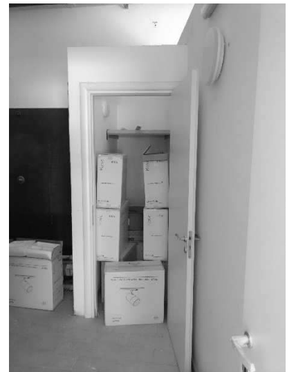
Figura 11- Ripresa 9 : Vano Rip in Wc