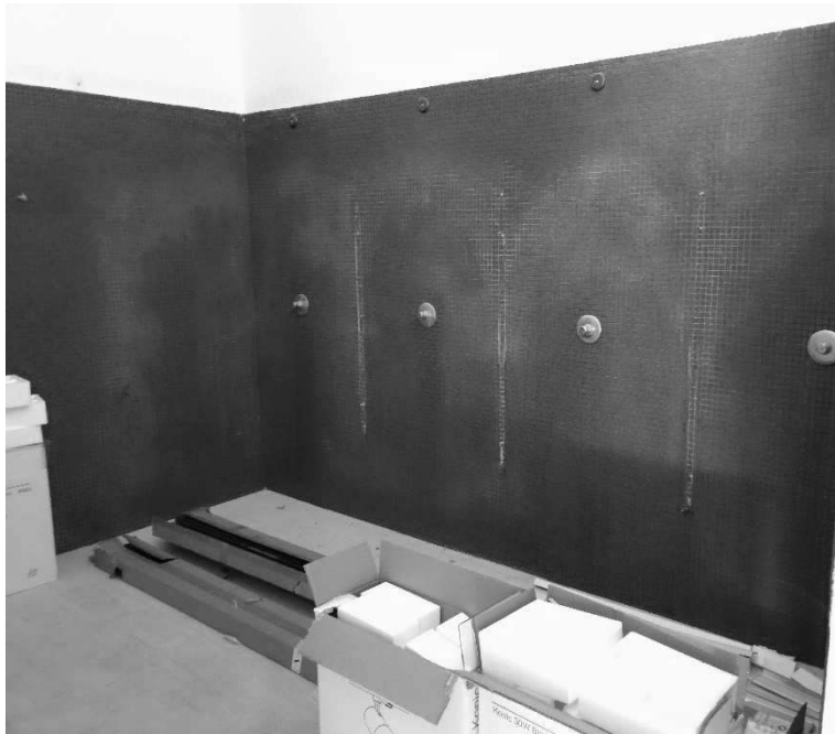
Figura 13 – Ripresa 11 Scorcio servizi igienici – Docce