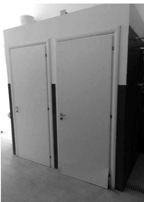
Figura 15 – Ripresa 13: Wc