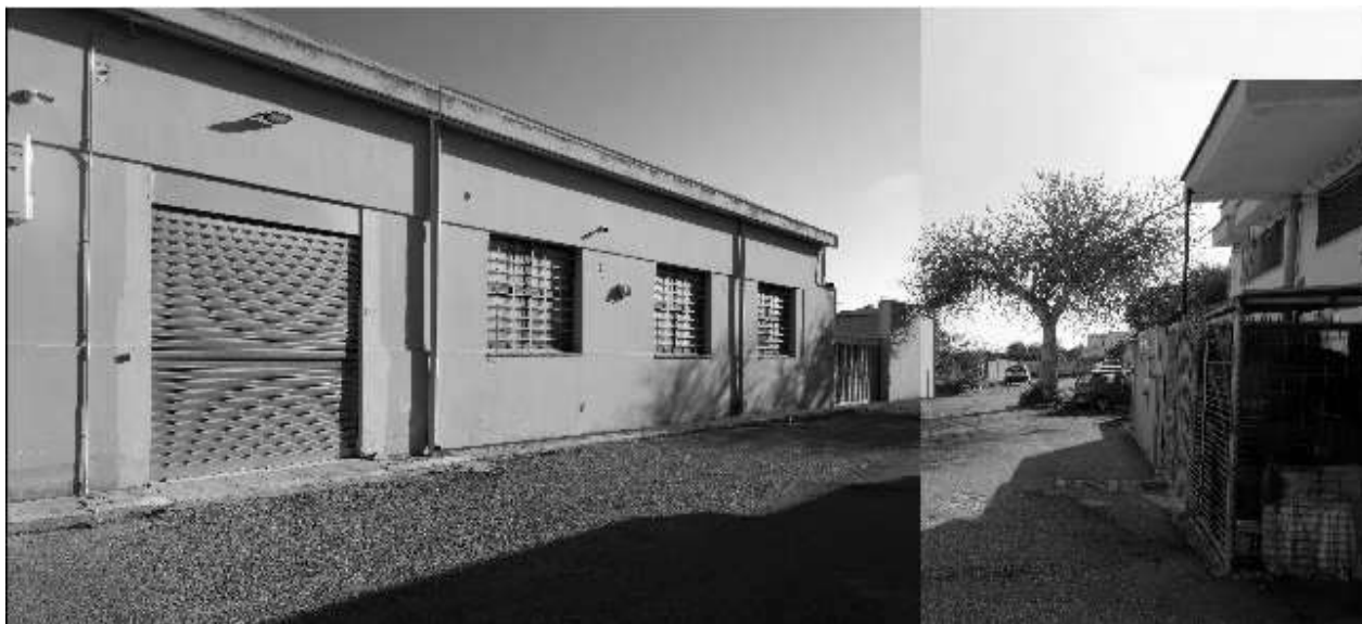
Figura 3 - Ripresa 1: Scorcio prospettico fabbricato con individuazione Unità Fg.49 - P.lla 85 Sub 31 da Trav Prov.le per San Vito