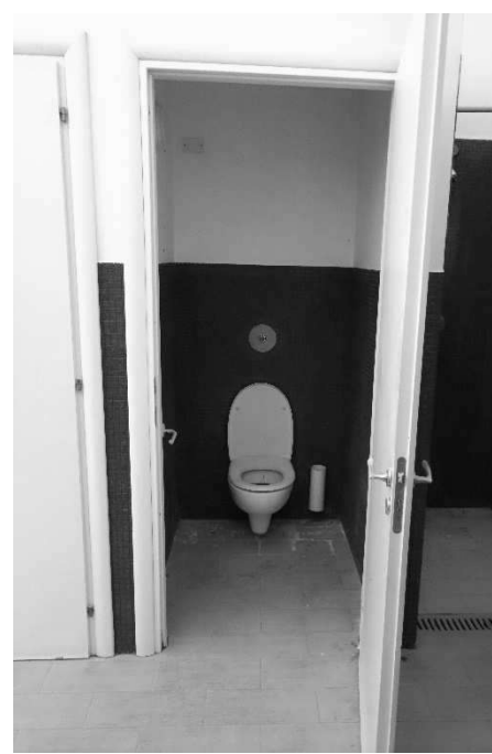
Figura 67– Ripresa 14: interno vano wc